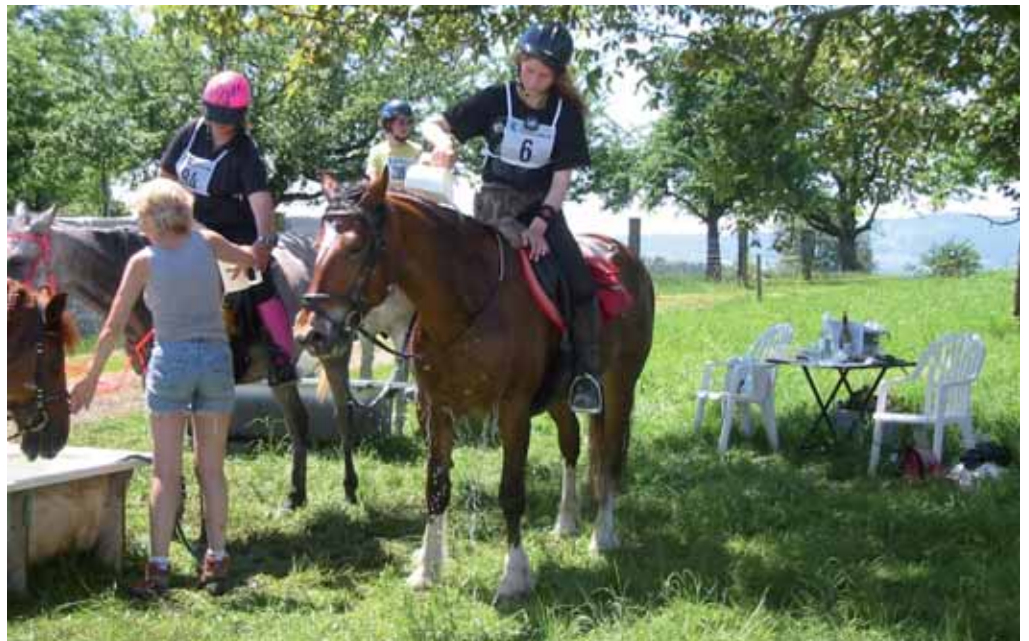
Epreuve d'endurance à Fehraltorf, durant l'épreuve. Distanzritt Fehraltorf, unterwegs.