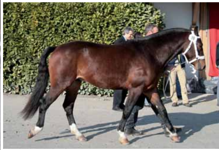
5. Valenzio (Vulkan) (Vitali - Lasko - Radical)