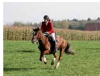
Chasse au renard à Merenschwand, en route pour la victoire.

Fuchsjagd Merenschwand, auf dem Weg zum Sieg