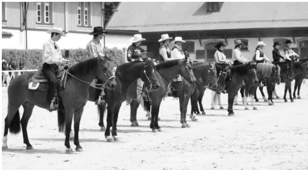
Proclamation des prix lors du concours FM-Western de l'Aventicum Western Classic en 2007, Rangverkündigung an einem FM-Western Turnier: Aventicum Western Classic 2007.

FM-Western ist aus einem losen Zusammenschluss von einigen Freiburger- und Westernfans entstanden. Am 6. Februar 2004 wurde FM-Western offiziell als Verein nach Art. 60 ff. ZGB gegründet. Ziel unseres Vereins ist die Förderung des Freiburgerpferdes in der Western- und Freizeitreiterei sowie im Turniersport. FM-Western ist sozusagen eine «Verbraucherorganisation» im Rahmen der Freibergerszene. Inzwischen zählt FM-Western gegen 120 Mitglieder, von denen die meisten ein oder sogar mehrere eigene Freiburgerpferde besitzen.