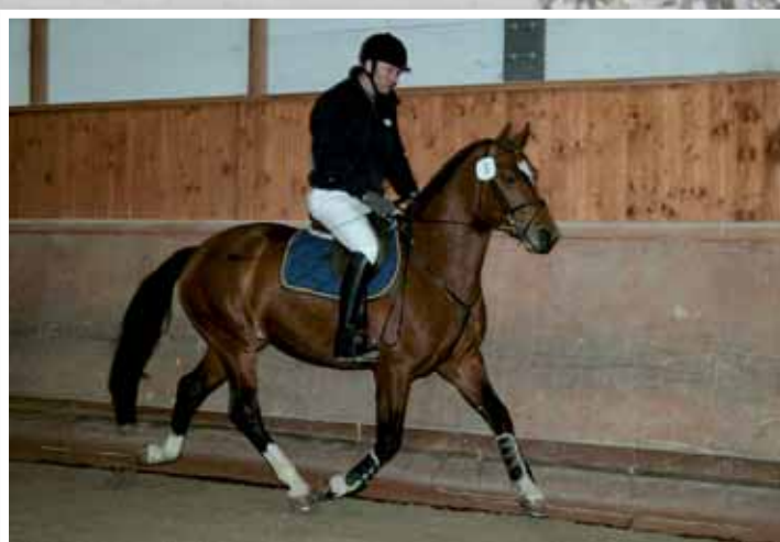
7. Nacre de Jasman (Nestor - Havel - Uzès)