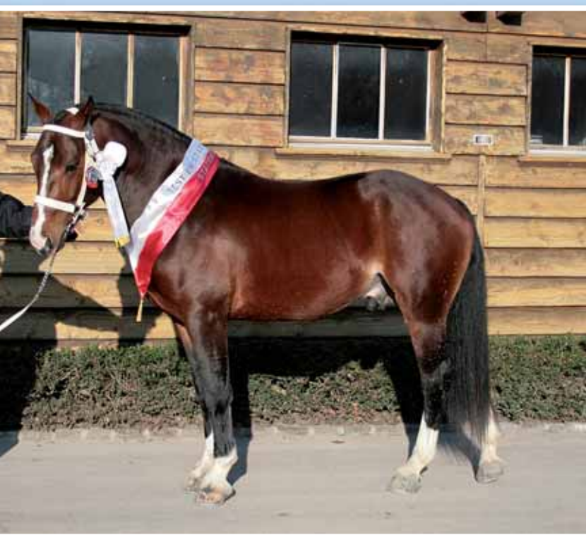
1. Euro (Esprit) (Eiffel - Cabaret - Judo)