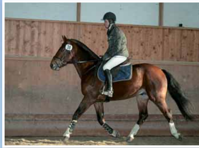
2. Valderama (Kalderama) (Versace - Eco - Josquin)