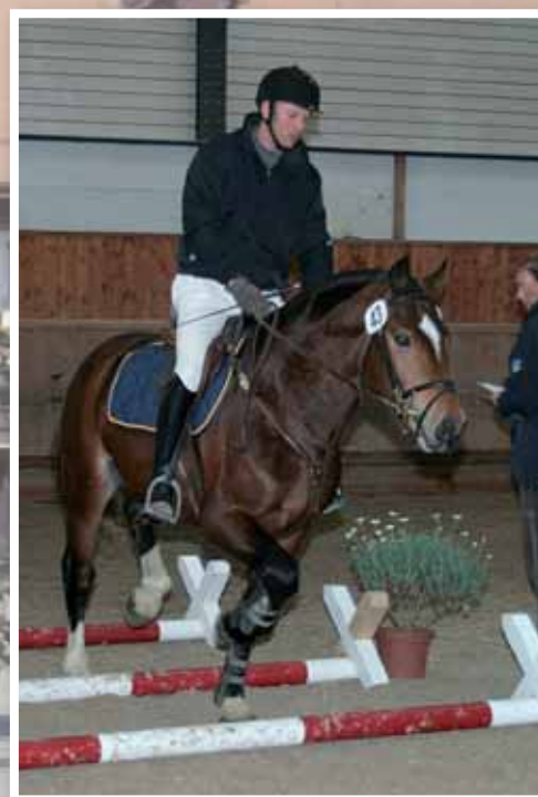
8. Héliaque (Hamilton) (Harding - Cajoleur - Elvis)