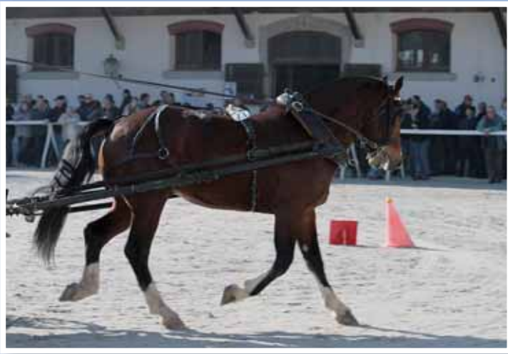
3. Hall (Hébron - Raidibus - Conquérant)