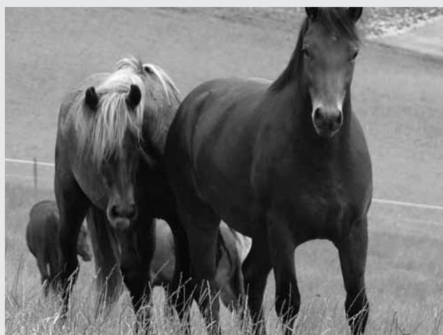
Préliminaires à la saillie. Einleitung des Deckaktes.

La plupart des saillies durent moins d'une minute et il s'agit d'un événement plutôt calme, après lequel les chevaux restent souvent quelques minutes l'un auprès de l'autre. Pendant le pic des chaleurs