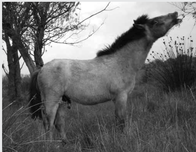
Jeune étalon confronté à de nouvelles odeurs. Junghengst nimmt neue Gerüche wahr

Wenn man sich all dessen bewusst ist, versteht man, dass das Unterdrücken z.B. eines Aufsteigens ohne Erektion, v.a. bei einer jungen Stute, oder das Abstellen des Hengst-Verhaltens gegen die Natur geht und langfristig eine kontraproduktive Auswirkung hat. Ein guter Hengsthalter muss seinen Hengst kontrollieren können, v.a. ohne ihn zu stark zu dominieren, was seine Libido reduzieren würde. Dieses Verhalten setzt viel Feingefühl und Kenntnis des natürlichen Verhaltens voraus. Auch ist es wichtig, dass sich Stute und Hengst beschnupern und im Rahmen der Sicher-