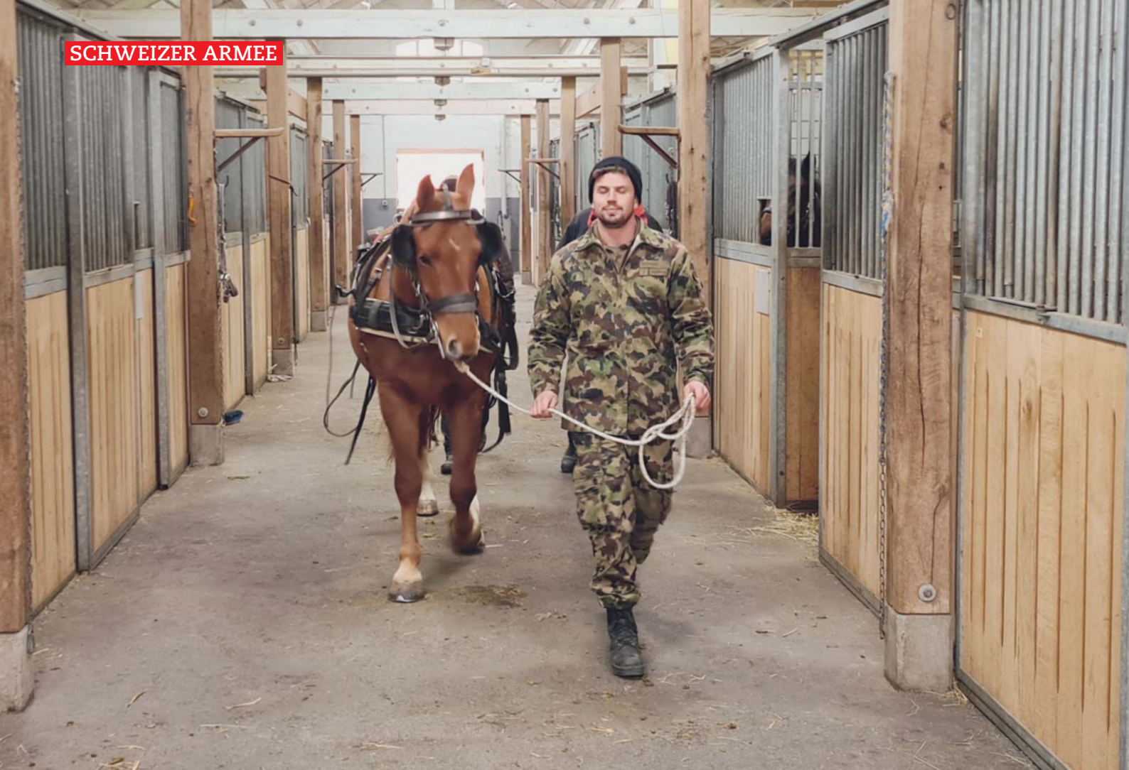
Préparation dans les écuries. / Vorbereitung im Stall.