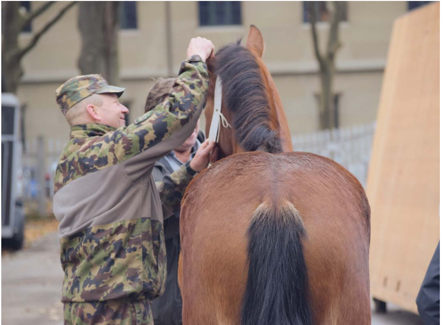
Les candidats sont examinés sous toutes les coutures. / Die Kandidaten werden genau unter die Lupe genommen.

Les sélections pour les futurs chevaux et mulets du train se sont déroulées au Centre équestre national (CEN) de Berne, les 8 et 9 novembre 2021. Ce sont au total 39 chevaux et mulets qui ont été annoncés au secrétariat avant la présentation. Ceci fût une très bonne surprise, car le marché du cheval cette année s'était plutôt bien porté.