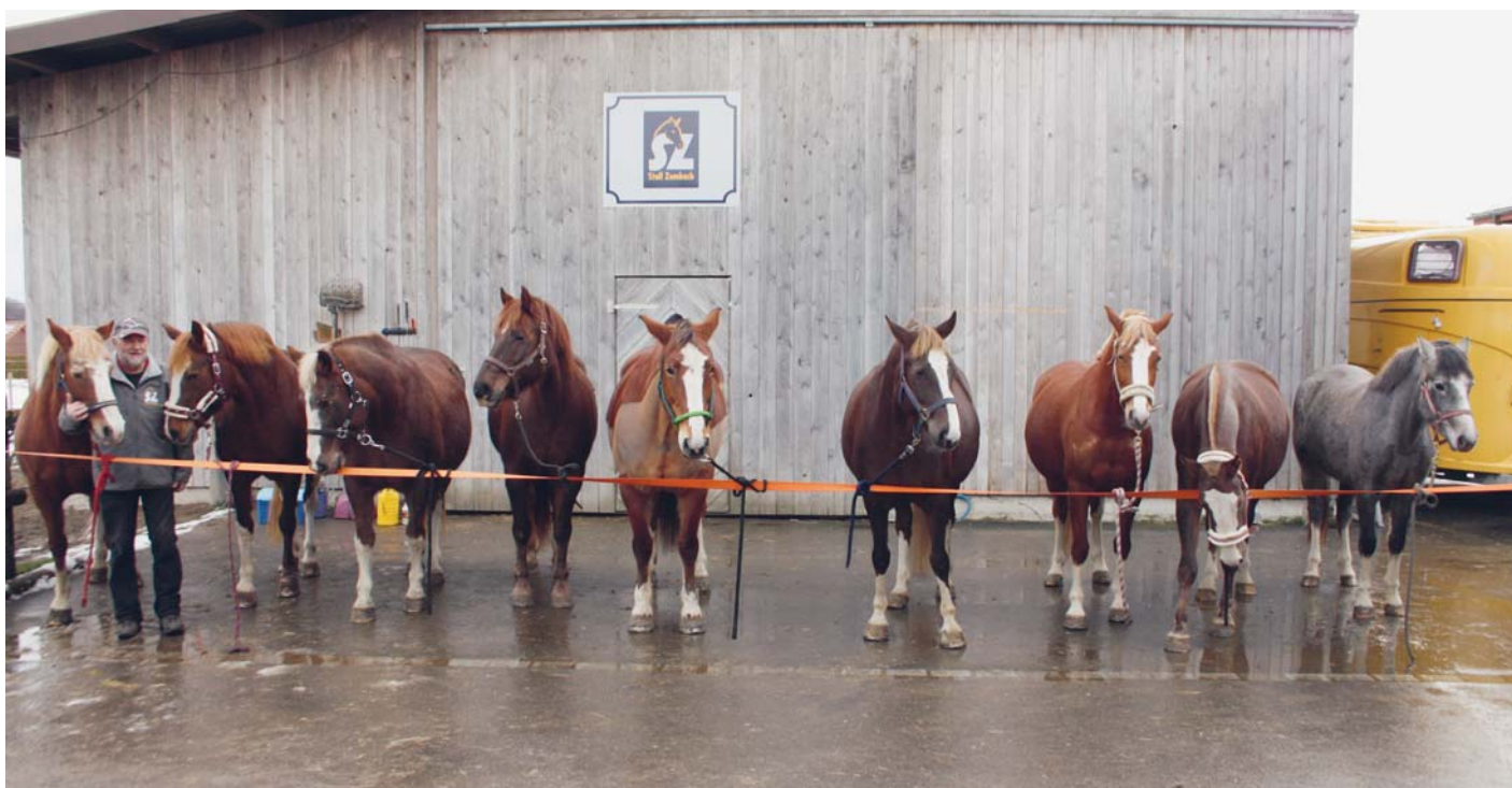
Sira avec ses 8 filles, de gauche à droite: / Sira mit ihren 8 Töchtern von links nach rechts: Sira (Cajoleur), Alegra (Harquis), Lana (Libero), Camira (Calif), Vianne (Verdicain), Castella (Calypso), Starlight (Calypso), Camille (Calypso), Grey (Hydromel).