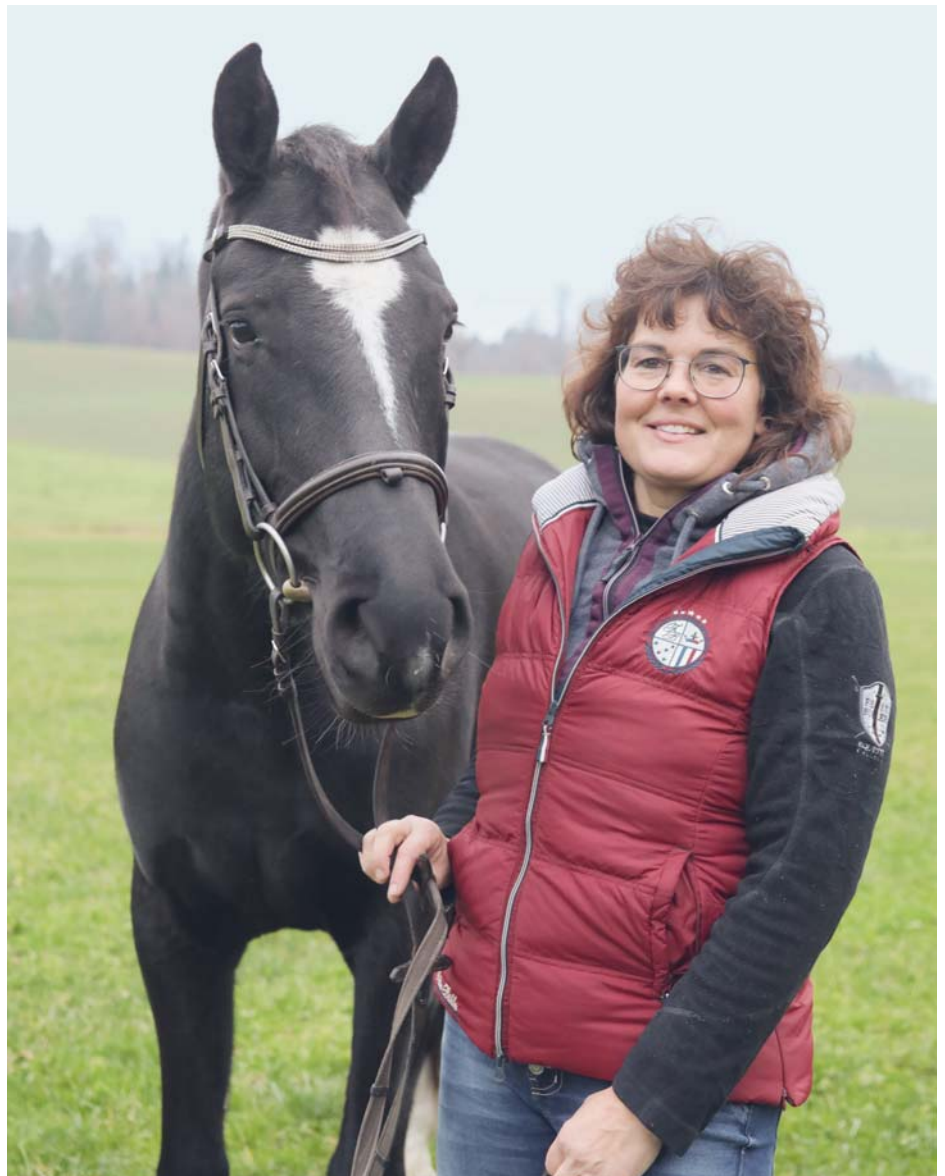
Luna-Rose (Novac vom Meierhof).