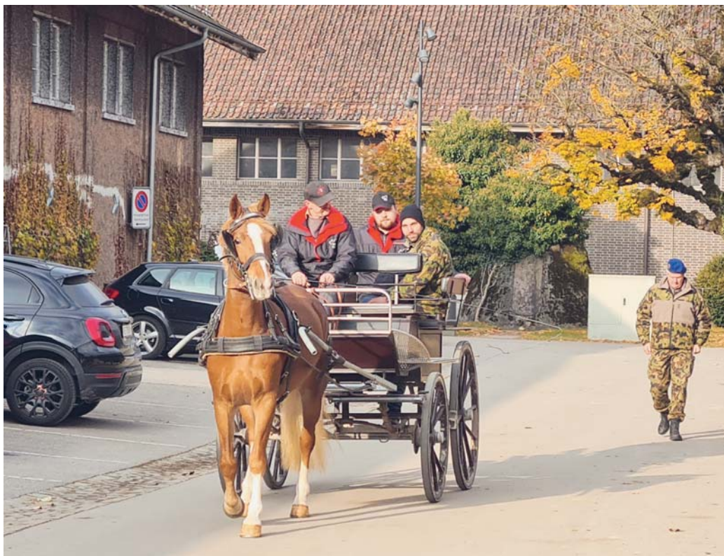
Test d'attelage réussi, le soleil en prime! / Fahrtst gelungen und dazu noch Sonnenschein!

Nach einer erholsamen Nacht vor Ort, werden die für den zweiten Tag ausgewählten Pferde und Maultiere eingespannt. Alle Kandidaten werden auf die gleiche Weise geprüft: als Einspanner.