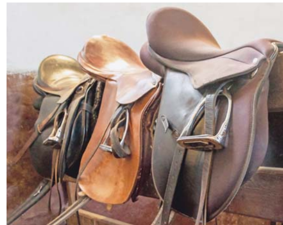
Selles en cuir ou matériaux alternatifs ? / Sattel aus Leder oder Lederalternative?