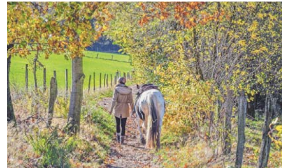
Les amis des chevaux aiment passer du temps dans la nature et devraient la préserver. Pferdefreunde lieben die Natur und sollten sie schützen.

• Laver correctement : Privilégier un programme de lessive aussi court et froid que possible afin d'économiser de l'eau et de l'énergie et d'éviter le détachement de microplastiques. Utiliser un produit de lessive écologique.