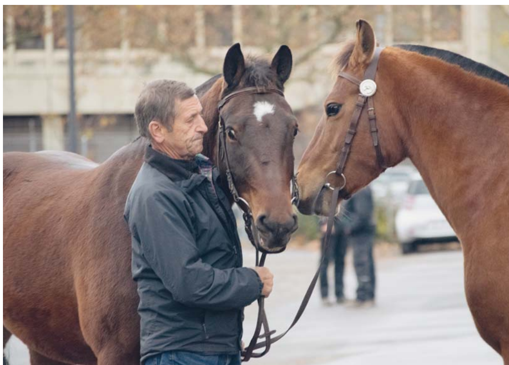
Impressions lors de la première journée de sélection. / Impressionen am ersten Tag der Selektion.