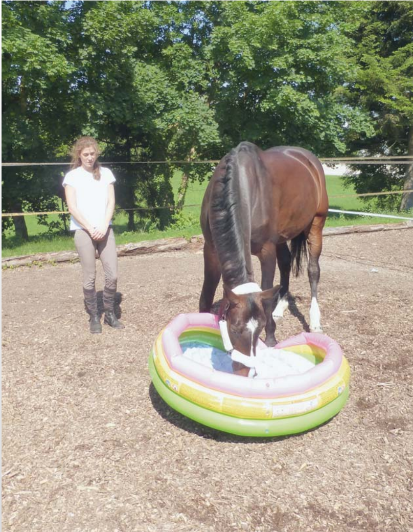
Foto 4: Die Forscherinnen erfassten anschliessend die Reaktion des Pferdes auf das unbekannte Objekt. Photo 4: La réaction du cheval face à l'objet inconnu était ensuite observée par les chercheuses.

Teddybären, einem Plüschschwein und einem Kinderplanschbecken) (Fotos 2-4) konfrontiert. Die Tests dauerten jeweils 90 Sekunden und wurden direkt nacheinander in einem abgesteckten Bereich von 6 auf 10 Metern eines Vierecks durchgeführt. Der Besitzer oder die Besitzerin drückte nach dem Zufallsprinzip eines der folgenden Gefühle aus: Freude, Angst oder Gleichgültigkeit und schaute dabei auf den im Viereck befindlichen Gegenstand.