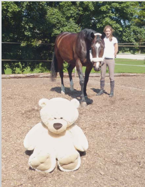
Foto 3: Der Besitzer oder die Besitzerin musste für jedes gezeigte Objekt Freude, Angst oder Gleichgültigkeit ausdrücken.

das Loch. Zeigt die Person hingegen Angst, bleiben die Kinder unbeweglich. Diese Fähigkeit entwickelt sich bei einem Kind, sobald es in der Lage ist, sich selbst alleine fortzubewegen und dient dazu, potentielle Gefahrenquellen zu vermeiden. Diese Kapazität wurde auch bei einigen Tieren (Affen, Hunden und Katzen) und ihnen nahestehenden Menschen beobachtet, ebenso bei Pferden und einem Versuchsleiter. Zwei Kriterien müssen erfüllt sein, wenn man von Sozialem Referenzieren sprechen möchte: das Tier muss mehrmals und aufeinanderfolgend zur Bezugsperson und zum verunsichernden Objekt blicken (Foto 1). Zudem muss es sein Verhalten je nach beobachteter Gefühlsäußerung des Menschen anpassen. Das heisst, dass das Pferd sich wachsam zeigen muss, wenn der Mensch angesichts eines unbekanntem Gegenstandes einen negativen Ausdruck signalisiert und sich umgekehrt beruhigt zeigen und auf den Gegenstand zugehen, wenn der Ausdruck des Menschen positiv ist.