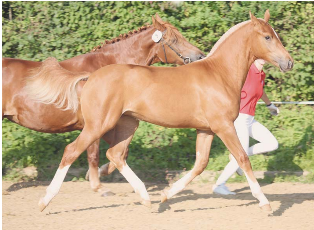
Concours de poulains Subigen 2021 - Lady (Nahel des Aiges) - 1 er rang. / Fohlenschau Subingen 2021 - Lady (Nahel des Aiges) - 1. Rang.

Le débouillage des jeunes chevaux est une affaire de famille. Dès la mi-octobre, Renate Schöni commence à les habituer au pansage, à les entraîner au chargement et au travail au sol, à gérer les peurs. Elle consacre beaucoup de temps afin d'inculquer de bonnes bases : « Nous