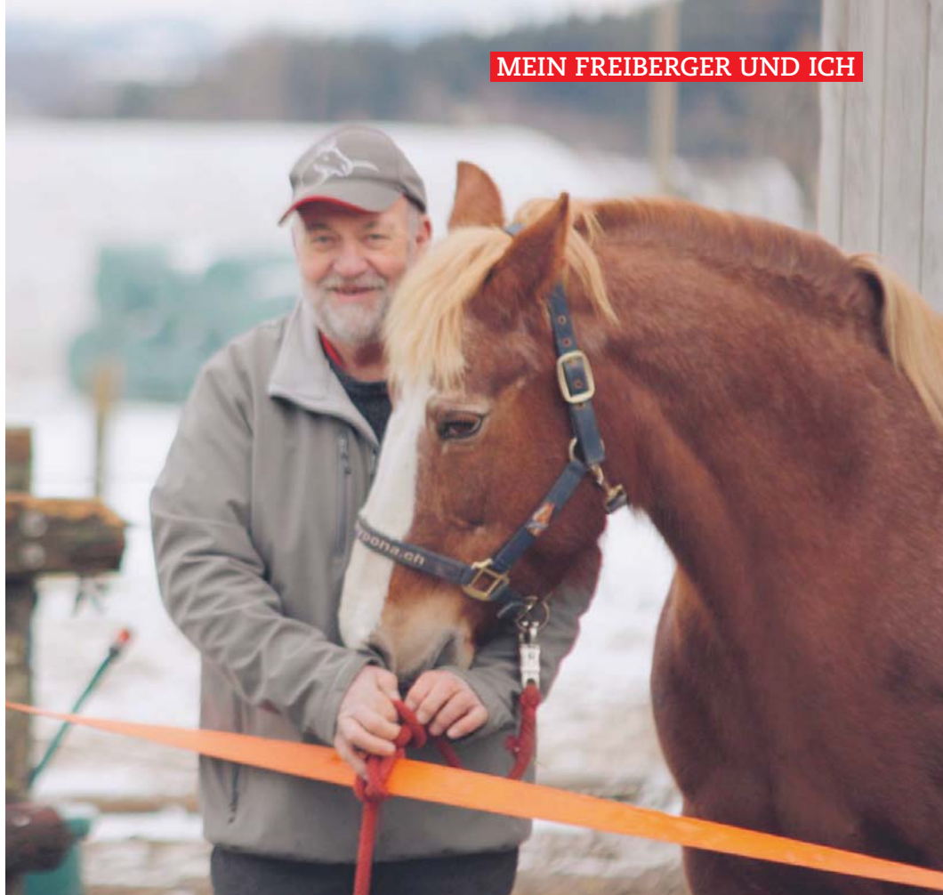
Sira (Cajoleur), née en 2000 - 1 er poulain de Franz. / Sira (Cajoleur) geb. 2000 - Franz' erstes Fohlen.