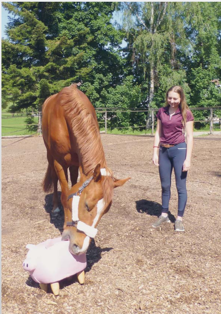
Photo 2 : Les couples cheval – propriétaire ont été confrontés aléatoirement à trois objets inconnus. Ici un cochon en peluche.

Sabrina Briefer Freymond Groupe de recherche Equidés Agroscope, Haras national suisse HNS