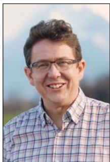
Albert Rösti président de la Fédération suisse du franches-montagnes, conseiller national Président Freibergverband, Nationalrat