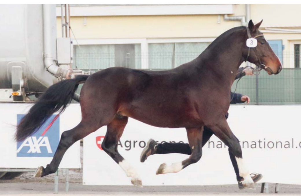
N° 13 ex. : Lucky (Laos x Népal), Pierre Koller, Bellelay