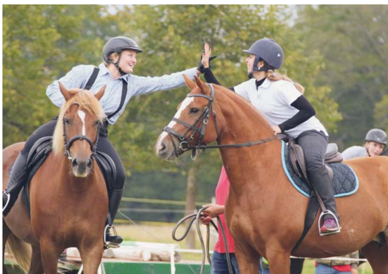
La journée équestre c'est avant tout, le fair-play, le plaisir et l'amitié. Der Reiertag ist vor allem Fair-Play, Vergnügen und Freundschaft.