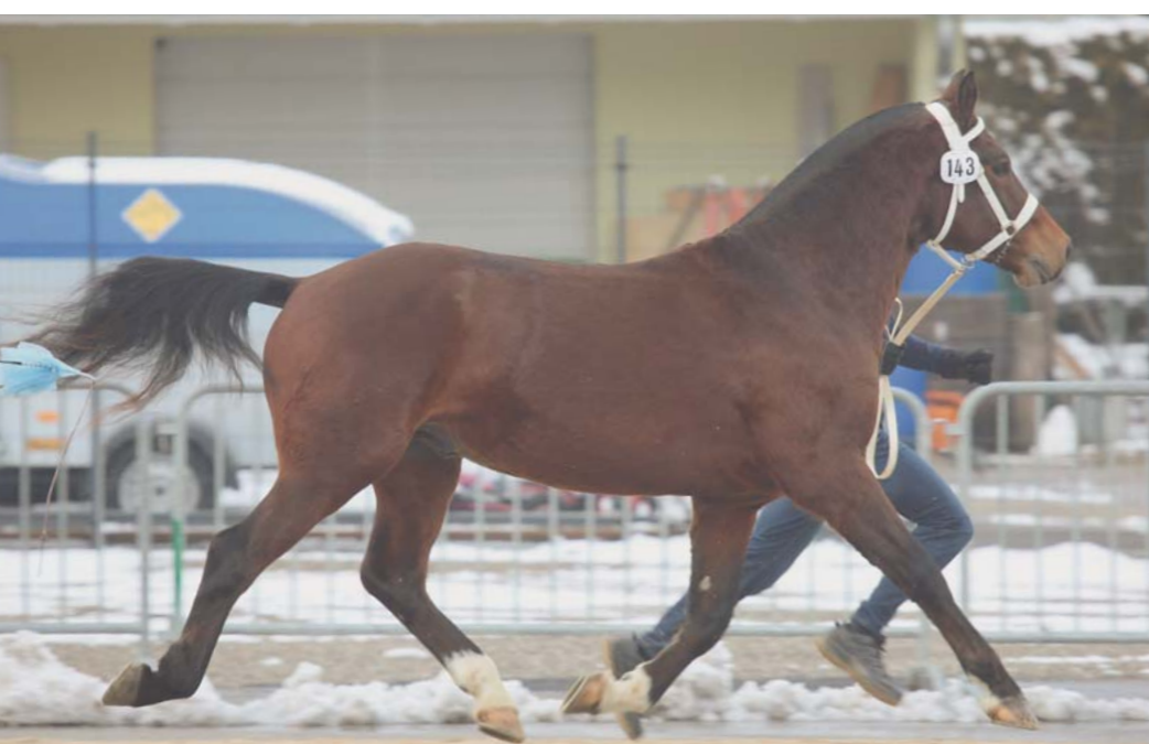
N° 3 : Koca de Roumont (Hitch - Halipot - Lucky Boy), Pierre Koller, Bellelay