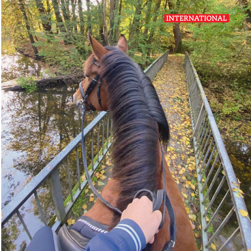
De magnifiques promenades à travers la nature, de quoi défier la pandémie. Herrliche Ausritte durch die heimatische Natur, so kann man der Pandemie etwas trotzen.