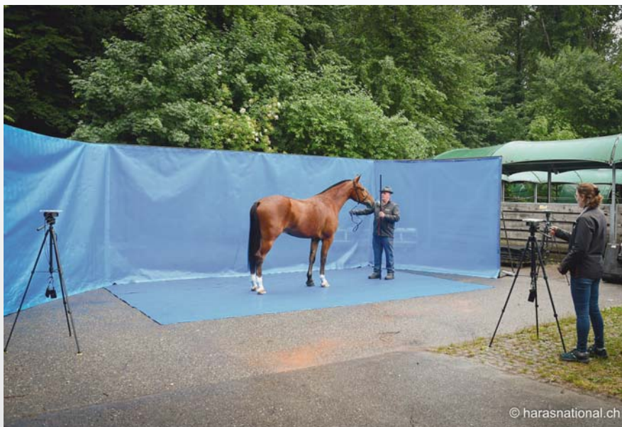
Abbildung 4: Am Feldtest in Avenches wurden die Pferde vor einem einheitlichen Hintergrund aus verschiedenen Perspektiven fotografiert. Die seitliche Perspektive ist die aussagekräftigste für die Analyse mit dem Horse Shape Space Modell. Figure 4: Lors du test en terrain à Avenches, les chevaux ont été photographiés de différentes perspectives devant un fond uni. La perspective de côté est la plus pertinente pour les analyses avec le Horse Shape Space.

Trotz der Begrenzungen durch die Covid-19 Pandemie konnten wir letztes Jahr zirka 50 Pferde messen. Wir danken den Besitzern für ihre Teilnahme am Projekt.