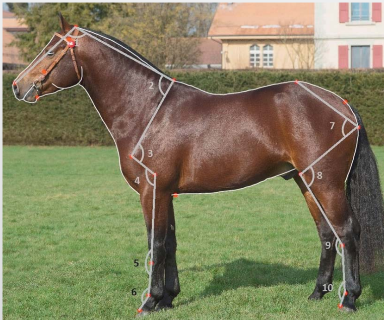
Figure 1 : Pour le Horse Shape Space , on doit d'abord tracer le contour de toutes les photos à l'ordinateur, puis extraire les angles morphologiques entre certains points anatomiques.

Le projet de recherche Modèle et allures 2.0 a pour but de mesurer des traits de la description linéaire de manière objective. Les premiers tests du projet ont eu lieu l'été dernier. Nous présentons ici les résultats clés concernant la conformation.