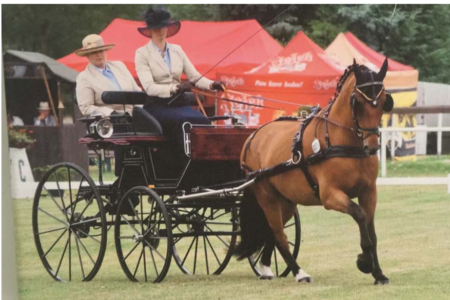
Dressage, pas exactement leur tasse de thé. / Die Dressur, nicht gerade unsere Paradeprüfung.

sorti de la tête ce qui l'a amenée à s'arrêter, leur faisant perdre de précieuses secondes. Mais cela a tout de même été suffisant pour se placer et obtenir la 7 e place.