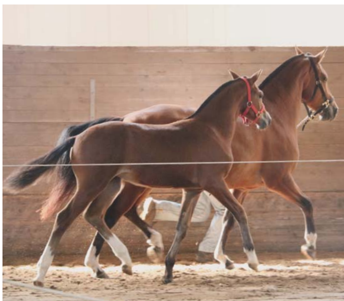
2 e pouliche Malorie du Malipa de Horizon des Oués par Calvaro à Pierre-Alain Monney 8/7/7. 2. Stutfohlen Malorie du Malipa de Horizon des Oués aus Calvaro von Pierre-Alain Monney 8/7/7.