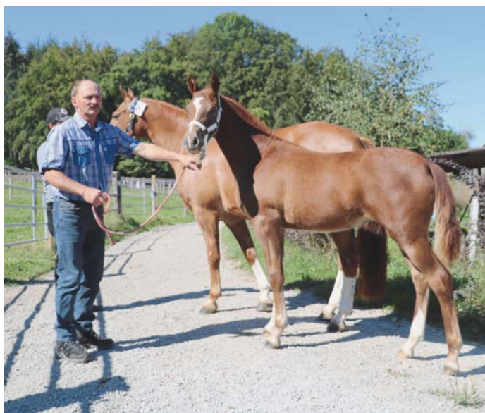
1 re pouliche Diva de Edoras par Hermitage à Hugo Piller 9/7/8. 1. Stutfohlen Diva de Edoras aus Hermitage von Hugo Piller 9/7/8.

Bei den Stutfohlen landet Diva von Edoras aus Hermitage mit den Noten 9/7/8 auf dem 1. Rang, Besitzer ist Hugo Piller. Es folgt das