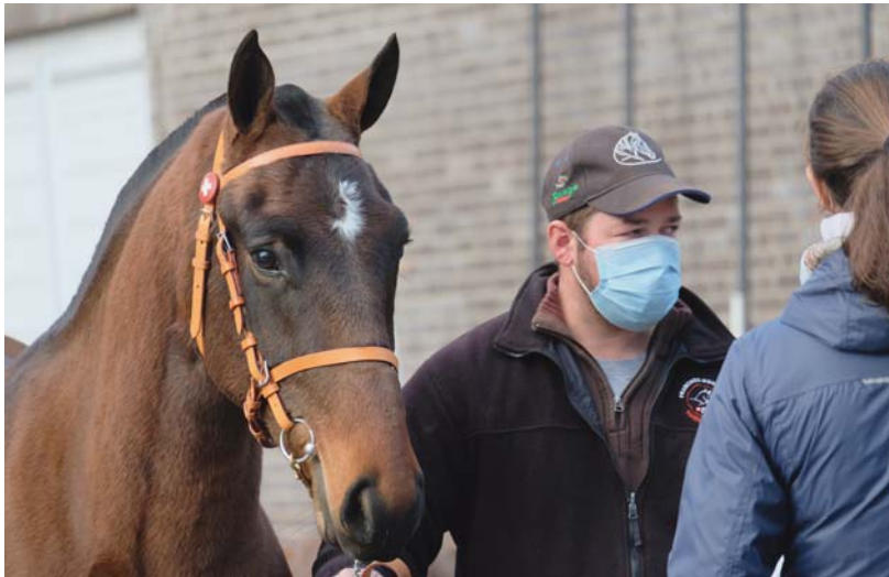
Même les franches-montagnes qui disposent de plus de sang étranger répondent au mieux aux exigences du train. Auch die Freiburger mit etwas mehr Fremdblut bringen die Train-Anforderungen bestens mit.

pour les épreuves d'attelage et un mulet ne les a pas réussies. Finalement, ce sont 26 franches-montagnes, soit 12 hongres et 14 juments, ainsi qu'une mule tout aussi convaincante, qui débiteront leur formation au CEN. Le colonel Montavon a félicité la très bonne qualité de la constitution, du comportement et du bon entraînement des chevaux inscrits cette année. Il a aussi souligné leurs excellentes performances à