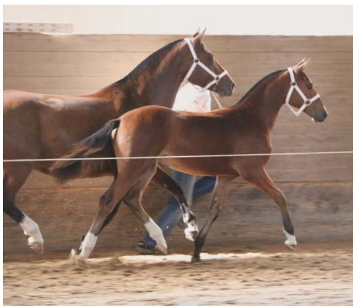
3 e pouliche Jonquille de Evident par Calvaro à Martin Schmid 8/7/7. 3. Stutfohlen Jonquille de Evident aus Calvaro von Martin Schmid 8/7/7.

Text: Linda Wohlhauser