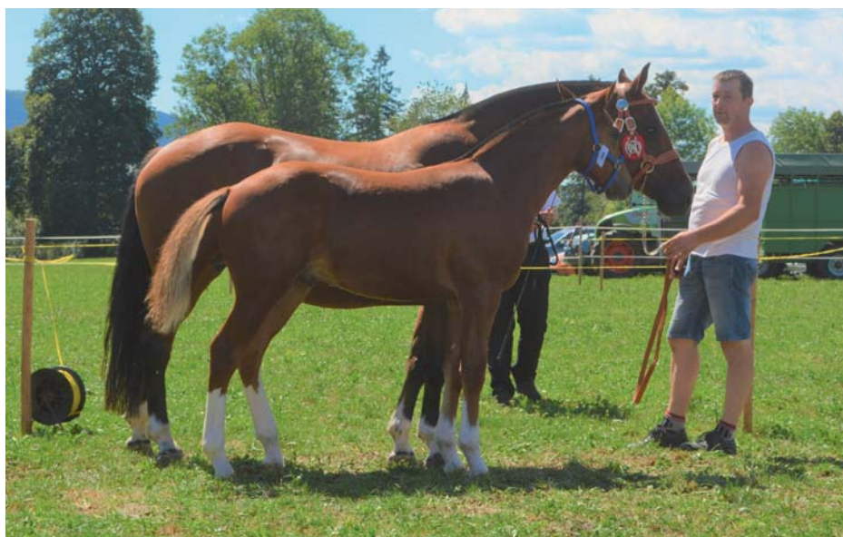
2 e rang pour No One (Niagara) également à Thierry Theurillat d'Epauvillers.

Hoffentlich also auf ein Wiedersehen am kulinarischen Ausflug, der normalerweise im April stattfindet und am nächsten Schautag im nächstjährigen August.