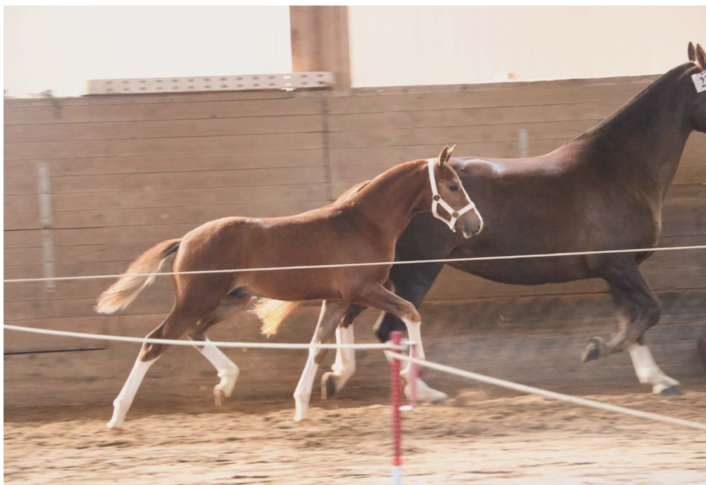
1 er mâle Emilio de Edoras par Helvetica appartenant à Hugo Piller 8/8/8. / 1. Hengstfohlen Emilio von Edoras aus Helvetica von Hugo Piller 8/8/8.

Texte : Linda Wohlhauser