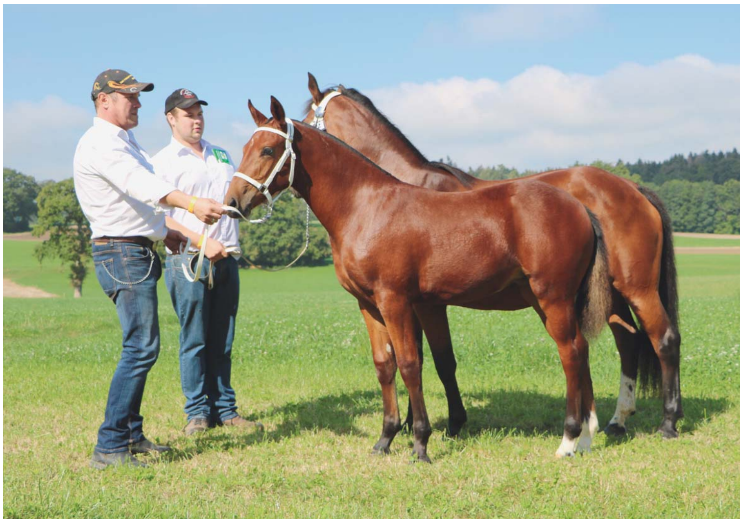
1 er rang des pouliches pour Makalani des Grands-Champs, fille de Népal et propriété de Steeve et Thierry Maillard à Villarimboud. 1. Rang Stutfohlen für Makalani des Grands-Champs, Tochter von Népal, Besitzer Steeve & Thierry Maillard, Villarimboud.

Text: Anne-Catherine Magne