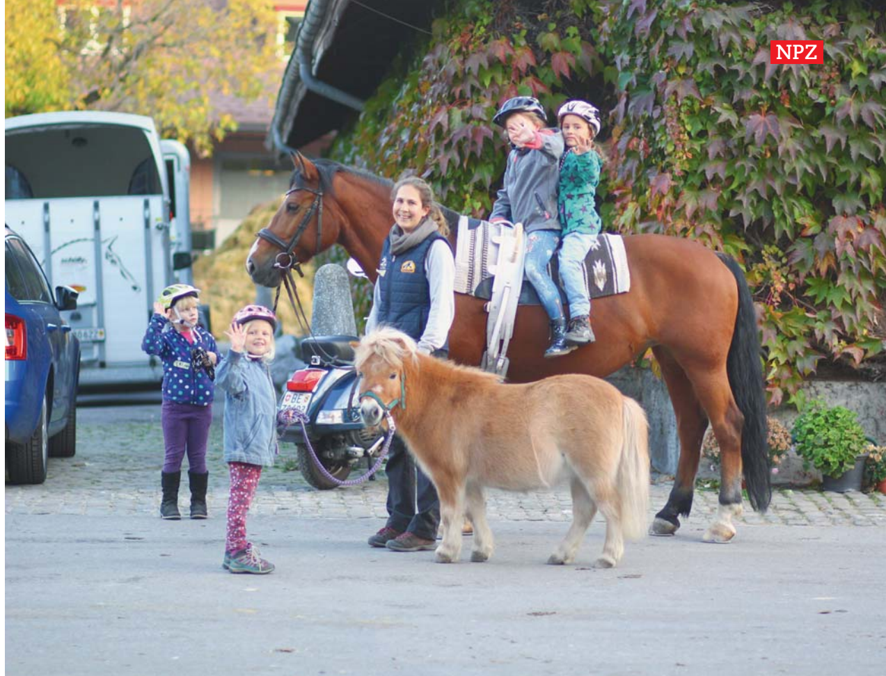
Convoitée: Chanelle a de nombreux fans, grands et petits. / Begehrt: Chanelle hat viele grosse und kleine Fans.

Text: Tina Bigler