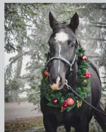
Couverture / Frontblatt Belles Fêtes de Noël et bonne et heureuse année 2021. Schönes Weihnachtsfest und ein gutes und glückliches Jahr 2021.

Ausland Raiffeisenbank Much-Ruppichterhof BLZ 37069524 – Deutschland Compte / Konto 5540011 Pour la France, envoyer votre chèque à: FSFM CP 34 - Les Longs Prés 2 1580 Avenches