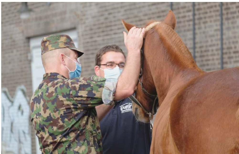
Des alezans séduisants pour le train. / Attraktive Fuchse für den Train.

Wegen Corona musste auch der Ankauf von Landespferden ohne Publikum und ohne Anwesenheit der Presse im NPZ durchgeführt werden. Doch dank der guten Infos von Oberst Stéphane Montavon über den Ankauf der Pferde konnte man sich ein Bild über den Ablauf der zweitägigen Veranstaltung machen. So vernahm man, dass 28 Freiberger und 2 Maultiere aufgeführt wurden. Wegen Exterieurmängeln konnten 2 Freiberger nicht für den Fahrtstest qualifiziert werden und ein Maultier bestand den Fahrtstest nicht. 26 Freiberger, davon 12 Wallache und 14 Stuten, sowie ein ebenso überzeugendes Maultier werden die Ausbildung im NPZ in Angriff nehmen. Montavon freute sich an der sehr guten Exterieur-, Verhaltens- und Ausbildungsqualität der heurig aufgeführten Pferde und unterstrich auch die überzeugenden Leistungen im Fahrtstest. Dies alles widerspiegelte sich auch in den Ankaufspreisen, die im Vergleich