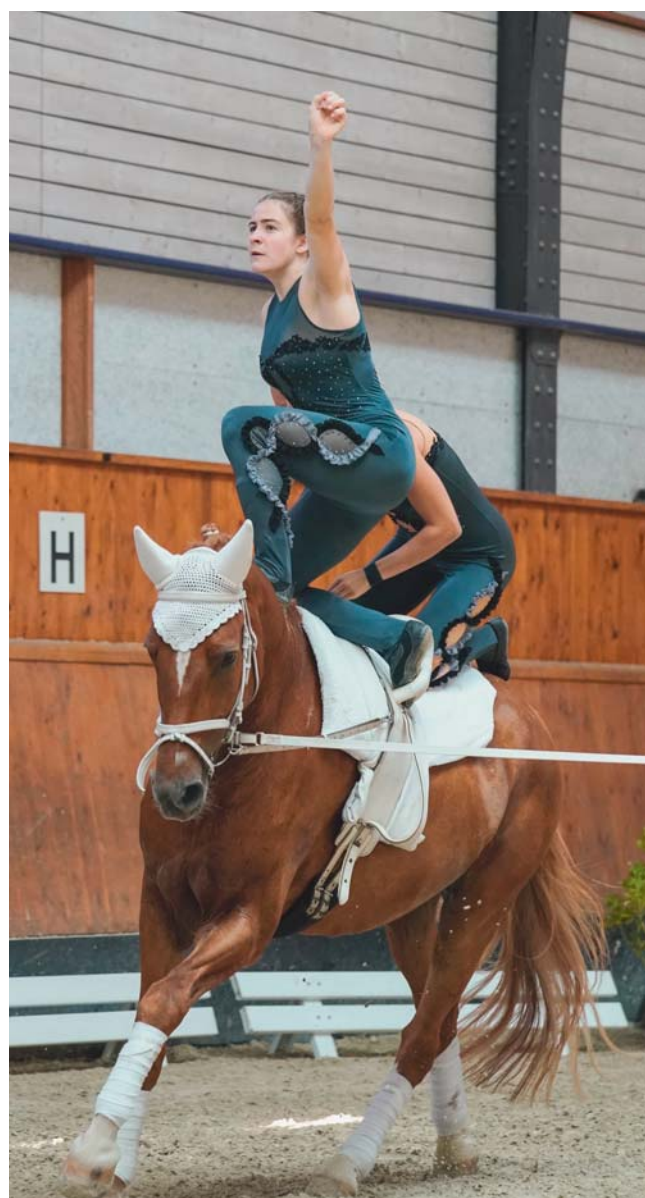
Elegance et harmonie: Câlin, ce mois de septembre au CVN à Avenches. Eleganz und Harmonie: Câlin diesen September am CVN in Avenches.