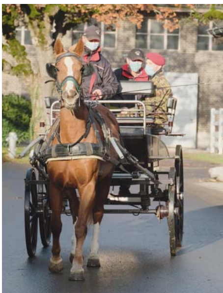
Les FM ont surtout été convainquants à l'épreuve d'attelage. Die Landespferde überzeugten im Fahrtest bestens.