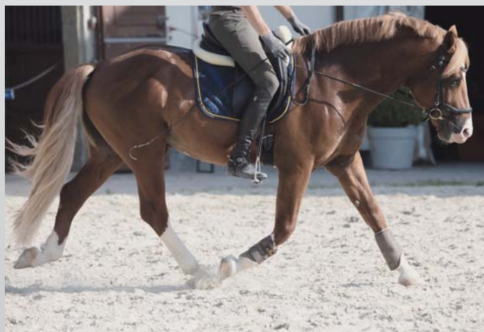
Une position latérale des oreilles sur une longue période peut indiquer que le cheval est stressé. Wenn Pferde über einen längeren Zeitraum eine seitliche Ohrenstellung zeigen, kann dies ein Anzeichen von Stress sein.

Selon certaines études, des oreilles orientées vers l'arrière chez les chevaux montés sont un signe d'inconfort. Néanmoins, une récente étude n'a pas pu confirmer cette hypothèse. Des oreilles dressées et orientées vers l'arrière ont même été associées à un rythme cardiaque plus faible par rapport aux autres