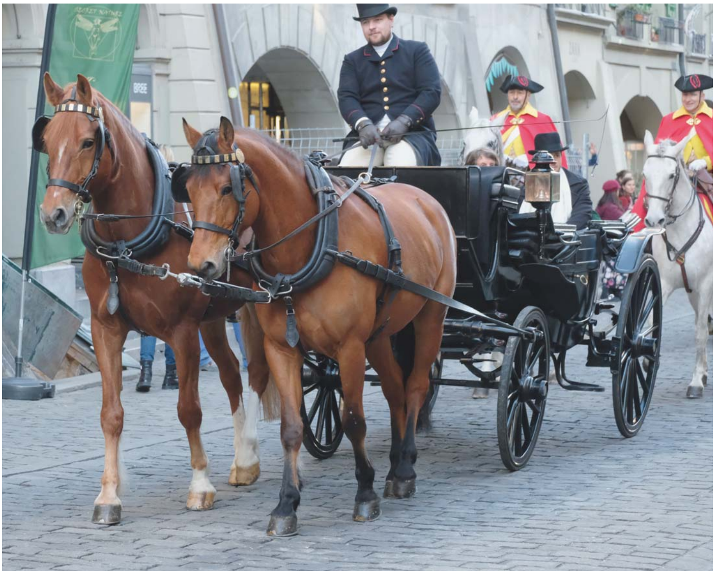
Habitué à présent aux feux de la rampe: le cheval de l'école d'équitation Călin (à gauche) et Nadir (à droite, Père: Nejack/PM: Hulax) à la traditionnelle réception de nouvel-an à Berne. Sind sich das Rampenlicht mittlerweile gewohnt: Die Reitschulpferde Călin (links) und Nadir (rechts, V: Nejack/MV: Hulax) am traditionellen Neujahrempfang in Bern.

Genau solche Freiberger gibt es in der Reitschule von Fränzi im NPZ. Charakterstark, liebevoll und verschmust. Egal ob kostümiert beim Weihnachtsgymkhana oder elegant im Dressurprogramm – die NPZ Freiberger meistern mit ihren Schülerinnen und Schülern jede Aufgabe. Vom RittiRössli