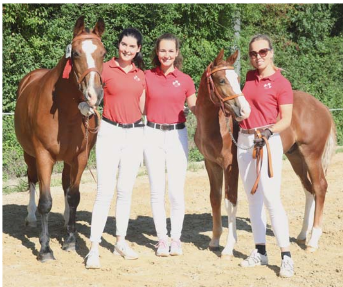
Les jeunes éleveuses suisses, très engagées. / Die engagierten Schweizer Jungzüchterinnen.