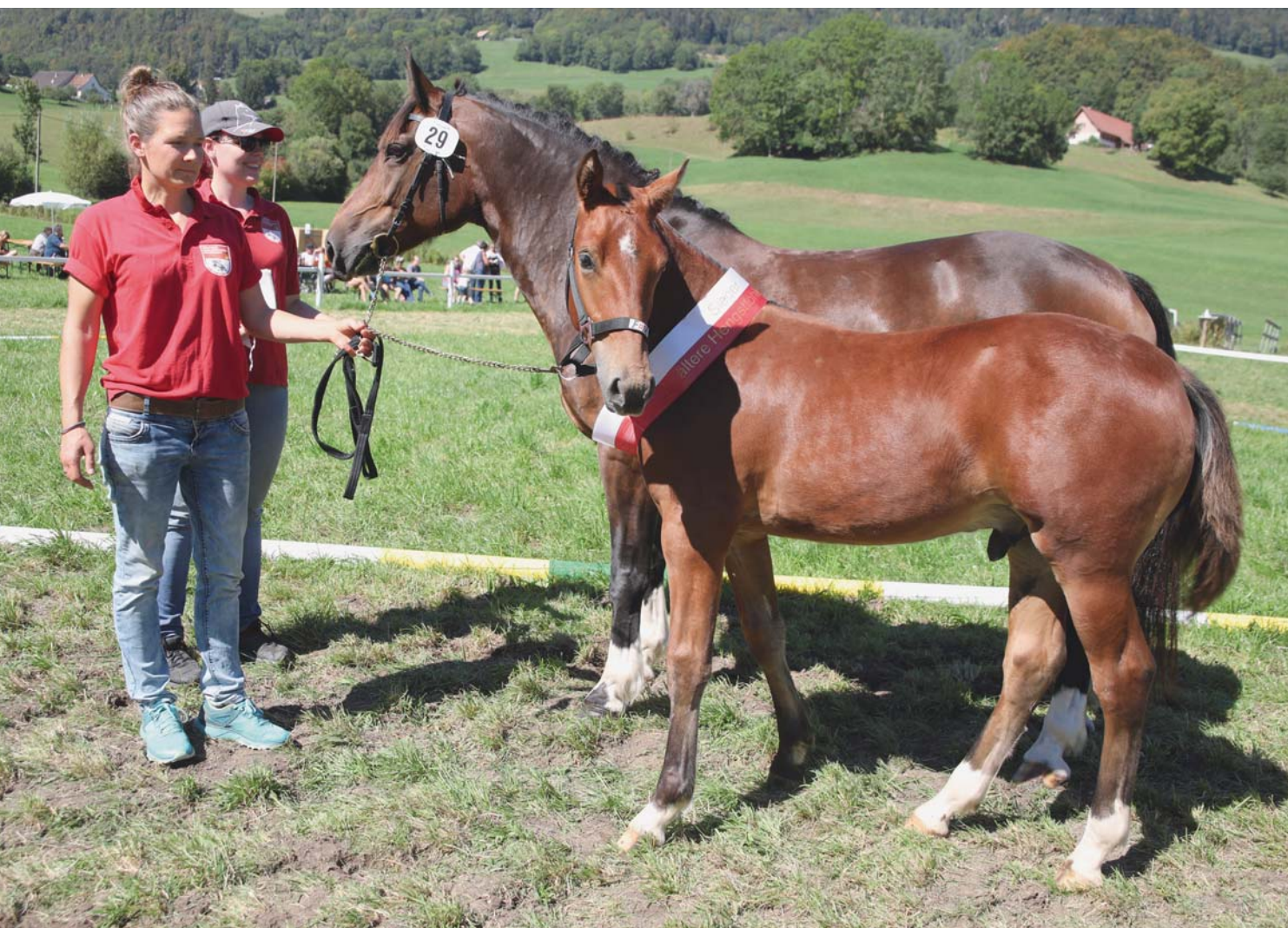
1 re place des poulains plus âgés et 4 e place générale pour Noe (Never BW) appartenant à Margreth Nützi-Studer de Wolfwil. 1. Rang ältere Hengste und 4. Gesamtrang für Noe (Never BW) von Margreth Nützi-Studer aus Wolfwil.