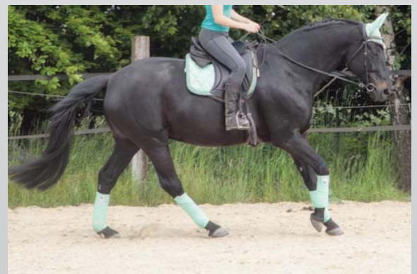
Sans stress et bien musclé, c'est l'objectif qui devrait être visé pour un cheval de selle. Frei von Stress und gut bemuskelt, das sollte immer das Ziel für das Reitpferd sein. (K. Kienapfel)

Si quelque chose ne va pas, les chevaux disposent de nombreuses possibilités pour le communiquer au cavalier, et ils les utilisent. Selon les observations scientifiques, fouailler de la queue est l'un des comportements les plus fréquents pour signaler du stress ou un