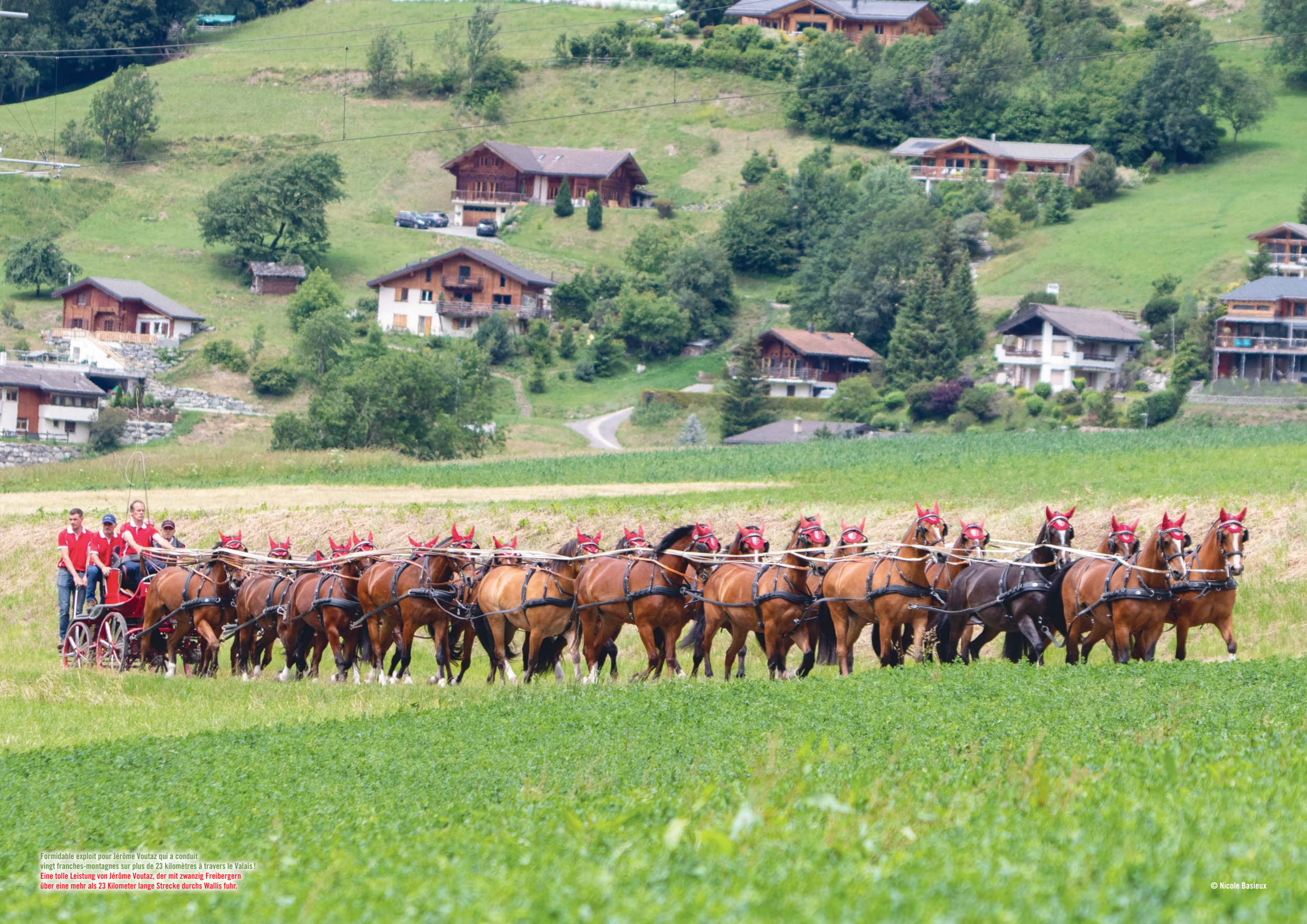
Formidable exploit pour Jérôme Voutaz qui a conduit vingt franchises-montagnes sur plus de 23 kilomètres à travers le Valais! Eine tolle Leistung von Jérôme Voutaz, der mit zwanzig Freibergern über eine mehr als 23 Kilometer lange Strecke durchs Wallis fuhr.