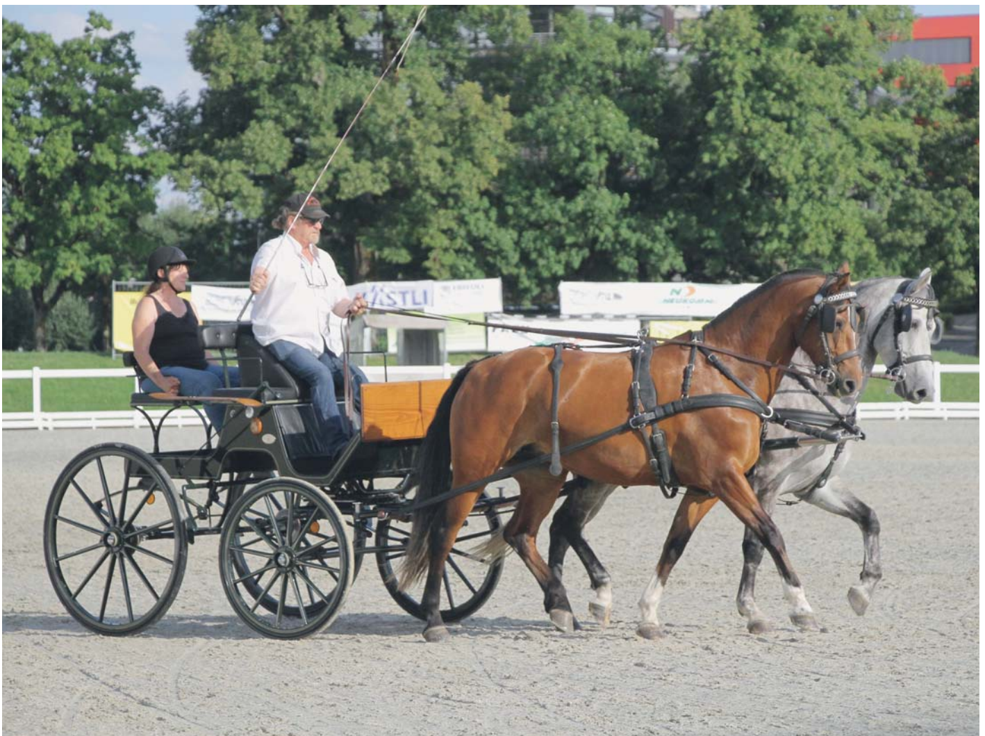
Harmonie Saba et Legolas forment un bel attelage. / Harmonie Saba und Legolas geben ein schönes Gespann ab.