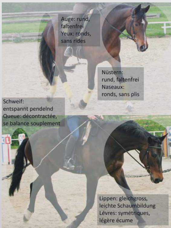
Das zufriedene Pferd: Verhaltensmerkmale. Indicateurs comportementaux du cheval satisfait. (K. Kienapfel)

einer Einheit zu verschmelzen, ist wohl schwer ausserhalb „unserer Welt“ erklärbar. Manchmal klafft aber zwischen den theoretischen Beschreibungen und der praktischen Ausführung eine recht grosse Lücke. Es scheint heute immer mal wieder mehrere, teils unterschiedliche Definitionen von Harmonie zu geben. Aber wie erkenne ich beim Reiten nun aus wissenschaftlich belegter Sichtweise, dass alles gut läuft? Wann ist Reiten noch harmonisch? Zum Glück ist dies recht simpel erklärt: Bei einem zufriedenen, losgelassenen Reitpferd sieht man von aussen „nichts“. Das bedeutet: Der Schweif wird locker pendelnd getragen und schlägt nicht. Das Maul ist geschlossen, eventuell mit leichter Schaumbildung an den Lippen und dezenter Kaubewegung, aber keine Zunge oder Zähne sind sichtbar. Das Pferd geht im Takt, bockt nicht, scheut nicht und zeigt auch sonst nichts, ausser den vom Reiter gefragten Bewegungen. Gutes Reiten ist unspektakulär, harmonisch und sieht leicht aus. Das korrekt gerittene Pferd strahlt und wird im Laufe der Ausbildung immer schöner, die Oberlinie formt sich. Die Halsbasis ist gut bemuskelt, der Hals verjüngt sich bis zum Genick in „V“-Form, die Hinterhand ist rund, der Widerrist ist ohne Kuhlen. Wie ein Pferd geritten wird, lässt sich also in der Regel nicht nur an seinem Verhalten sofort ablesen, sondern auf lange Sicht auch an seinem Exterieur- ein nützlicher Fakt zur Selbstprüfung!