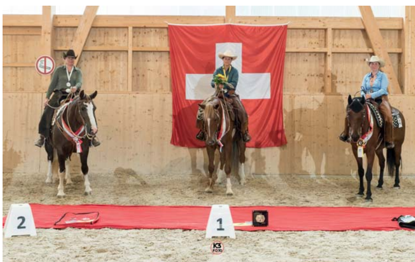
Un succès total où les médailles d'or, d'argent et de bronze des disciplines Ranch Trail sont revenues à des franchises-montagnes. / Erfolg total, so gingen sowohl die Gold, Silber, und Bronzemedaille in der Disziplin Ranch Trail an Freibergpferde.