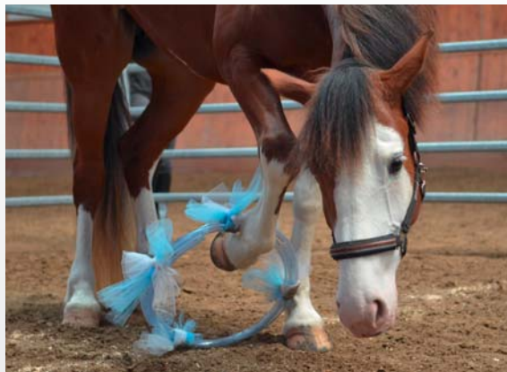
Test de l'objet inconnu. Ce test a pour but d'évaluer la curiosité ou peur des chevaux face à un objet inconnu. Test mit unbekanntem Objekt. Dieser Test evaluiert die Neugierde der Pferde angesichts eines unbekanntes Objektes.

Une différence intéressante est ressortie de manière très prononcée pour un des tests: le test de sensibilité tactile. En effet, les chevaux tiqueurs ont été beaucoup plus nombreux que les chevaux non-tiqueurs à réagir aux 6 différents filaments tactiles appliqués à la base du garrot durant les tests. Ces chevaux sont donc plus sensibles aux stimulations tactiles que les autres chevaux. Autrement dit, ils ressentent plus fortement ou sont plus dérangés par des sensations tactiles. L'application des filaments de Von Frey sur la peau peut être interprétée de différente manière au niveau sensitif. C'est également une méthode utilisée pour tester le seuil à partir duquel une sensation de douleur est ressentie. Le neurotransmetteur connu sous le nom de \beta endorphine est responsable de réguler la douleur. Des études précédentes ont démontré des différences dans la physiologie de ce neurotransmetteur entre chevaux tiqueurs et chevaux non-stéréotypés. Cette différence physiologique pourrait expliquer le fait que les chevaux tiqueurs aient davantage réagi aux filaments de Von Frey que les chevaux non-tiqueurs. Ainsi, il serait