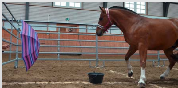
Reaktionstest beim Öffnen eines Regenschirms. Dieser Test ermöglicht, die Angstreaktion bei einem plötzlichen unerwarteten Ereignis zu messen. Test de réaction à l'ouverture d'un parapluie. Ce test permet de mesurer la réaction de peur à un événement soudain.

ihrem jeweiligen Stall auf die oben aufgeführten Persönlichkeitsmerkmale hin getestet. Beim ersten Test blieb eine dem Pferd unbekannte Person drei Minuten lang unbeweglich in der Mitte des Reitplatzes stehen, um die Reaktion des Pferdes auf einen unbekanntes Menschen zu testen. Danach wurden sogenannte Von Frey-Filamente, das sind auf verschiedene Stärken kalibrierte Nylonfäden, an der Widerristbasis der Pferde angesetzt, um die Reaktion der Pferde auf taktile Empfindungen zu testen. Ebenfalls wurde die Neugierde der Pferde mittels eines während drei Minuten in der Mitte des Reitplatzes aufgestellten unbekanntes Objektes evaluiert. Parallel dazu wurde die Bewegungsaktivität der Pferde analysiert, indem