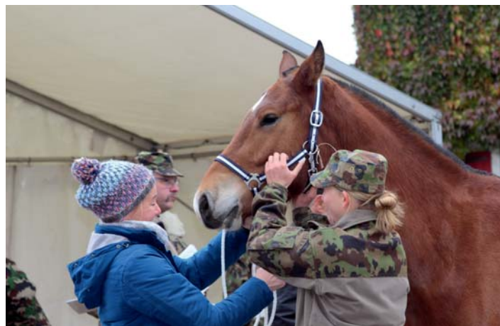
L'évaluation des chevaux a débuté par le contrôle vétérinaire. Mit den veterinär-medizinischen Kontrollen begann die Ueberprüfung der Pferde.