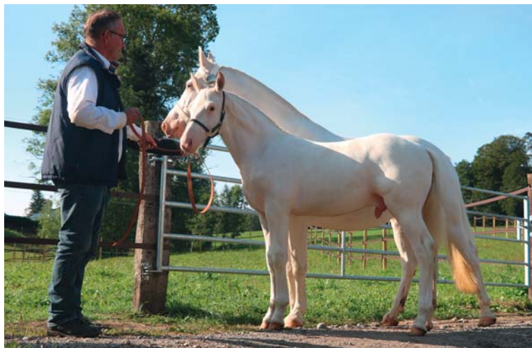
1 er rang des poulains pour Elegant de St-Garin. / 1. Rang Elegant de St-Garin.

Dans le rappel des poulains, nous avons au 1 er rang Elegant de St-Garin. Ce poulain