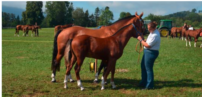
Netflix, 1 er à Epauvillers. / Netflix, 1. in Epauvillers.

Der Tag endete mit einem sympathischen Nachtessen, offeriert für die Mitglieder und die Freiwilligen, die dieses Jahr an 2 Veranstaltungen mithalfen, nämlich am kulinarischen Reitausflug Ende April und am Stand der Pferdegenossenschaft an den Médiévales.