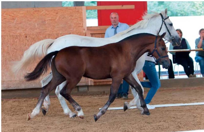
Haeven PBM a été élu champion général 2019 du concours des poulains franchises-montagnes. Un titre bien mérité. Haeven PBM wird 2019 verdienter Gesamtsieger der Freiburger Fohlenschau.

Bei der jüngeren Abteilung gewann Ronaldo PBM (8/7/8) gezüchtet von Werner Pfister aus Maisprach. Das Fohlen stammt ab vom Hengst Ryvers de Jasman, welcher eine bedrohte Hengstlinie vertritt. Muttersvater ist Henrique, ebenfalls im Besitz von Werner Pfister. Naldivo PBM (Nino FW/Vulcain) gezüchtet von Werner Pfister belegte mit (7/7/8) den zweiten Platz und