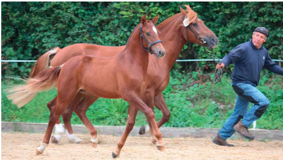
4 e place pour le poulain Lui (Hélixir) appartenant à Ueli Gerber de Oschwand.

Le concours des poulains du SEC de Soleure et environs et du SEC de l'Oberaargau s'est déroulé sur la magnifique place en sable de Subingen. 18 poulains y ont trotté à côtés de leur mère et neuf d'entre eux ont été sélectionnés pour le rappel.