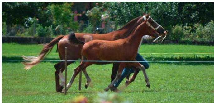
Nike, 1 er à St-Ursanne. / Nike, 1. in St-Ursanne.