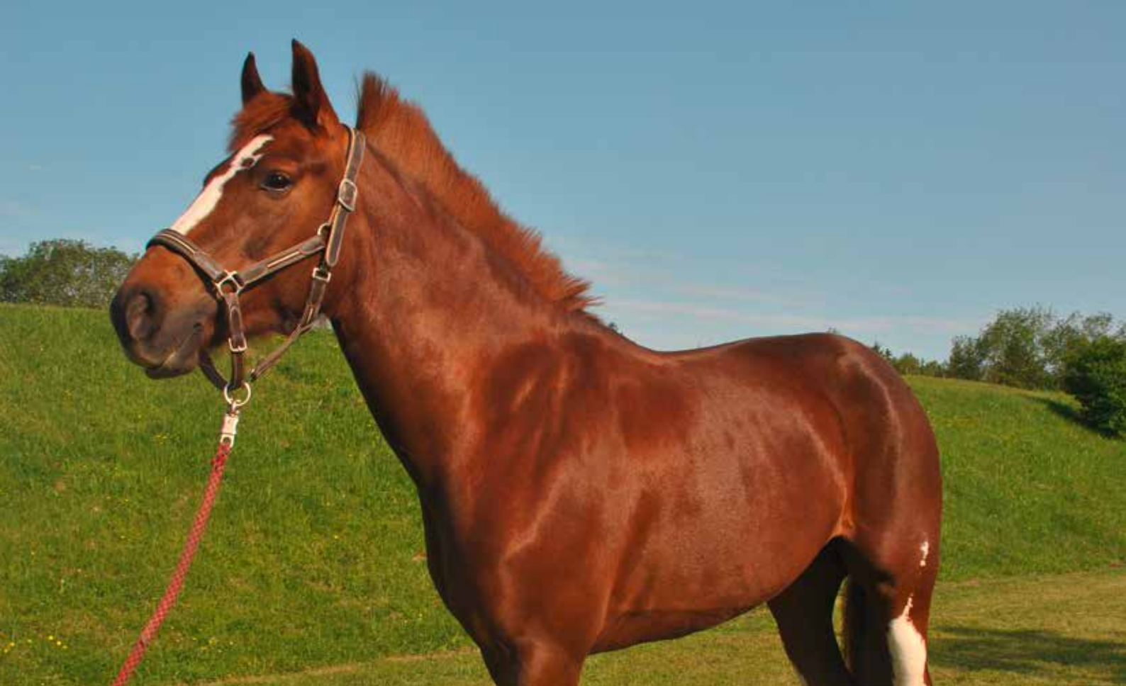
Danae, jument de six ans, prend de la valeur depuis son arrivée dans le manège du Chalet-à-Gobet. Die sechsjährige Stute Danae hat an Wert gewonnen, seit sie in der Reitschule Chalet-à-Gobet ist.