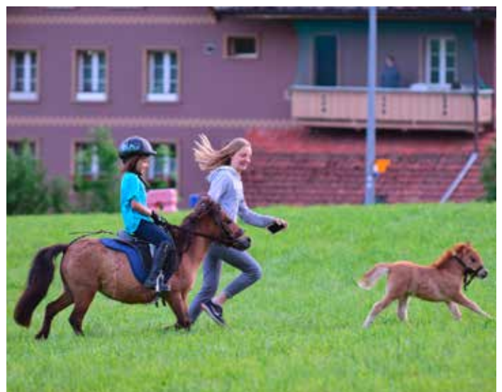
Les grands et les petits ont eu du plaisir à Gohl, photo de Marie Roeck. Gross und Klein hatten viel Spass im Gohl, Bild von Marie Roeck