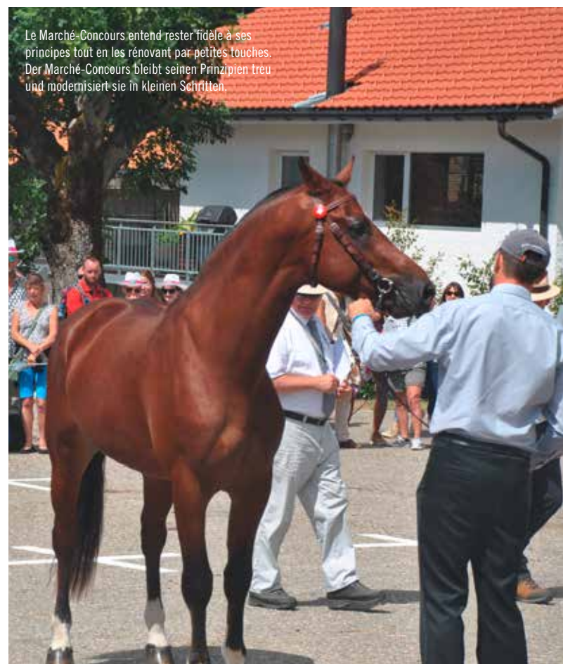
Le Marché-Concours entend rester fidèle à ses principes tout en les rénovant par petites touches. Der Marché-Concours bleibt seinen Prinzipien treu und modernisiert sie in kleinen Schritten.