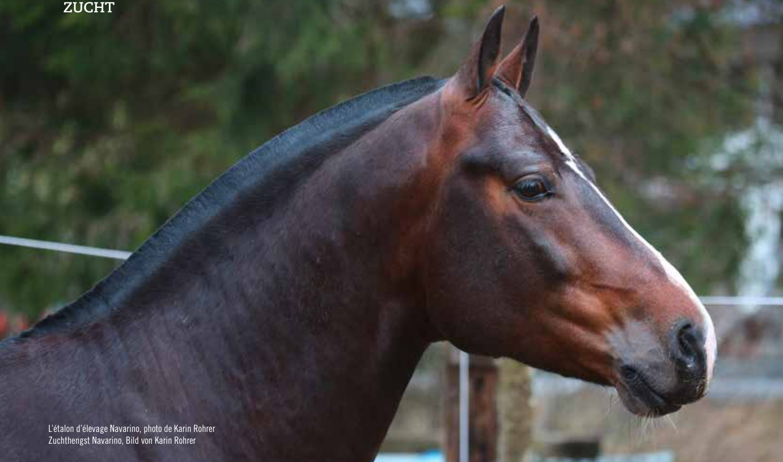
L'étalon d'élevage Navarino Zuchthengst Navarino