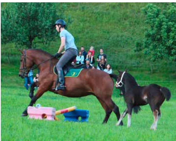
Die Zuchtstute von Martin Baumgartner mit ihrem Fohlen (Abstammung Envöl), Bild von Fritz Muster La jument d'élevage de Martin Baumgartner accompagnée de son poulain (issu de Envöl), photo de Fritz Muster.

Texte: Karin Rohrer Photos: Fritz Muster & Marie Roeck & Karin Rohrer