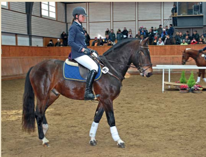
11. Enrice (Euridice - Libero - Hybris)