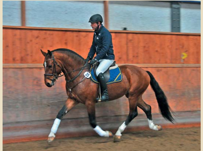
10. Vako des Voûtes (Vol de Nuit - Latéo - Havane)