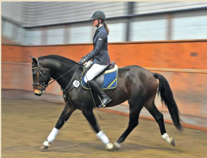
9. Vartan (Vol de Nuit - Nautilus - Quinoa)