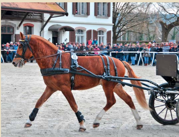
13. Chaumanne du Peupé (Crepuscule - Havane - Lecarlo)