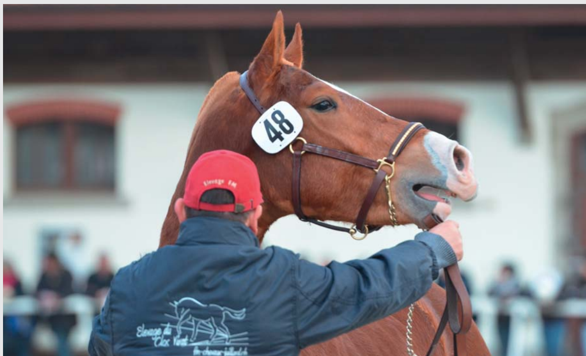
Les juges d'extérieurs évaluent la grégarité des chevaux au triangle Die Exterieurrichter beurteilen den Herdentrieb im Dreieck

Une enquête menée auprès des juges et des éleveurs a soulevé en revanche beaucoup de points positifs. En effet grâce au tour de triangle en plus, les jeunes FM semblent plus décontractés sans le fouet et présenter plus de respect en main. L'idée prometteuse de continuer à sélectionner un cheval FM de bon caractère et de pouvoir donner des indications plus précises à l'acheteur sur ce qu'il désire trouver chez son compagnon a pris le dessus. L'AC continue donc en 2015. Cette fois-ci seules les échelles d'évaluations seront maintenues pour les trois caractères et une nouveauté cette année, l'émotivité sera évaluée lors de la mise en limonière. L'indépendance entre les trois caractères devrait s'améliorer avec l'entraînement des juges et des mises au point sur le déroulement des tests en terrains. Par exemple, l'évaluation de la grégarité pourra être améliorée, si les chevaux sont bien positionnés dos aux autres chevaux au moment de l'AC.