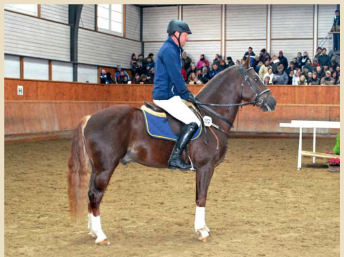
14. Landlord (Lordon - Deli - Rocard)