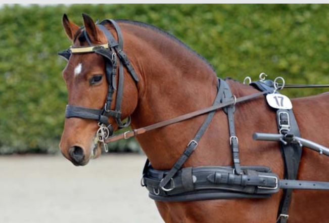
Une nouveauté cette année, l'émotivité sera évaluée lors de la mise en limonière Eine Neuerung in diesem Jahr: die Emotivität wird beim Einspannen beurteilt