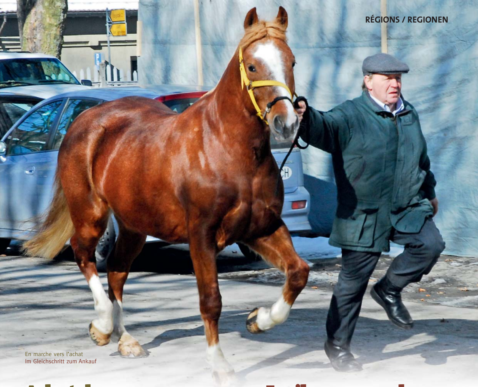
En marche vers l'achat Im Gleichschritt zum Ankauf