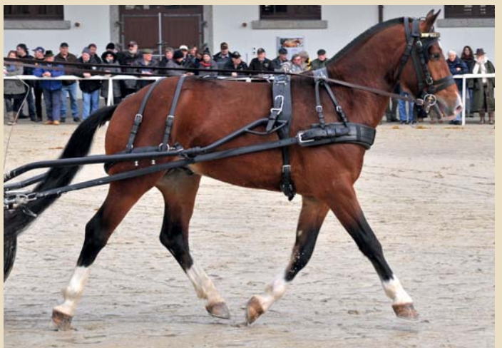
5. Hodler (Hermitage - Libero - Estafette)