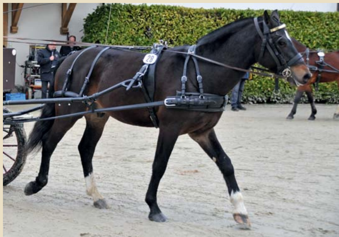
8. Novac vom Meierhof (Norton - Ecosais - Redaktor)