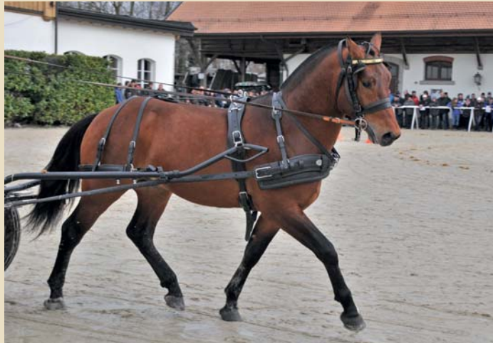
6. Carlsson (Canada - Lucky Boy - Judäa)