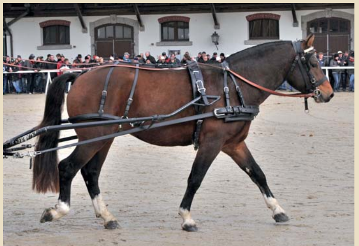
9. Ernest (Emilio - Eidgenoss - Joinville)