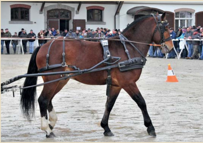
2. Calva (Cookies - Natif des Aiges - Estafette)