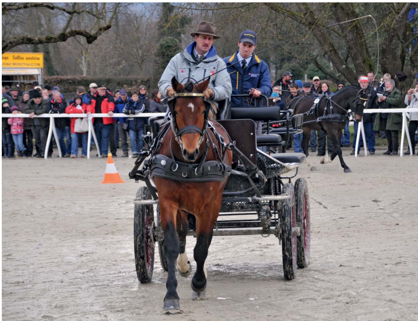
Calva (Cookies - Natif des Aiges- Estafette)