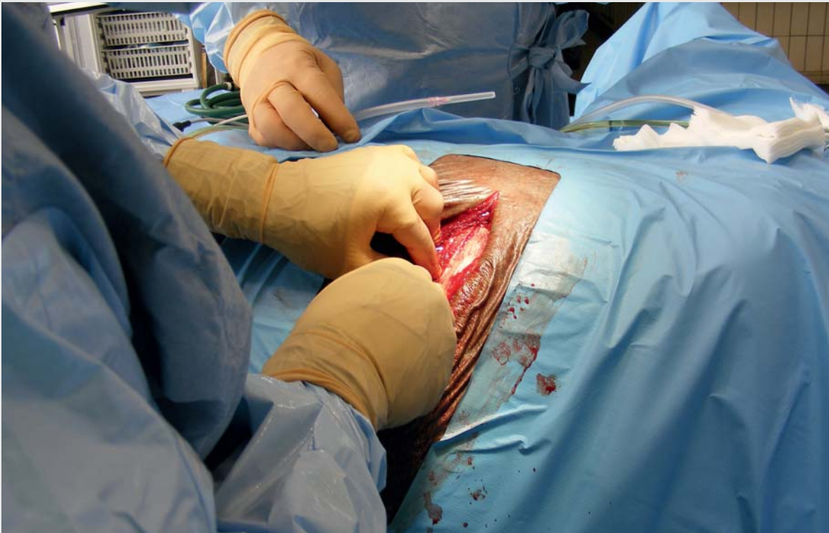
Une opération de coliques

Chez le cheval âgé, la présence de masses abdominales telles que les lipomes constitue un facteur de risque pour les coliques. Les intestins peuvent s'enrouler autour de ces néoplasies, provoquant ainsi une obstruction et une incarceration des intestins. Il faut alors remettre l'intestin en place, puis évaluer son état afin de déterminer s'il faut enlever une partie de l'intestin touché.