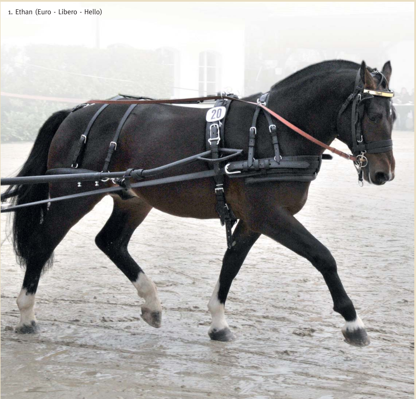
1. Ethan (Euro - Libero - Hello)