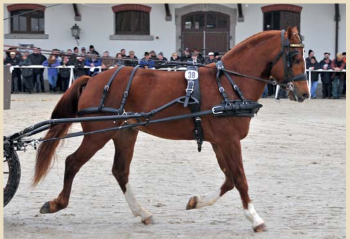
11. Haribo des Voûtes (Halipot - Latéo - Havane)