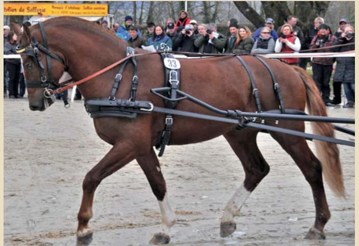
7. Calypso du Padoc (Coventry - Hermitage - Nejack)