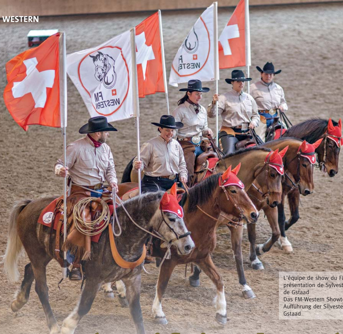
L'équipe de show du FM-Western lors de la présentation de Sylvestre dans le manège de Gstaad Das FM-Western Showteam an der Aufführung der Silvestershow im Reitzentrum Gstaad