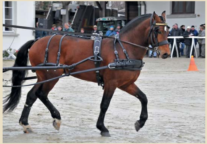
3. Newton (Nitendo - Looping - Cheyenne)