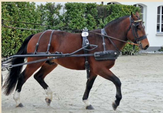
10. Lovari v. Kappensand (Littoral - Nicolo - Cabaret)