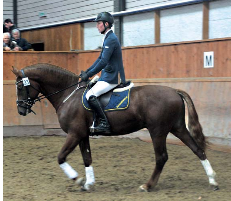
Calypso du Padoc (Coventry - Hermitage - Néjack)

Pour le président de la FSFM, Bernard Beuret, la question d'un apport éventuel de sang d'une autre race ne sera abordée que dans une démarche visant à améliorer l'élevage selon un ordre de priorité défini. Il