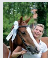
Couverture / Frontblatt 1. Elite Caline

Etranger Ausland Raiffeisenbank Much-Ruppichteroth BLZ 37069524 – Deutschland Compte/Konto 5540011 Pour la France, envoyer votre chèque à: FSFM CP 190, Les Longs Prés 1580 Avenches