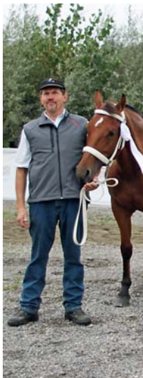
Texte et photos: Karin Rohrer

1 er rang au rappel des poulains pour Nino vom Meierhof, à Otto Portmann de Sigigen 1. Rang Hengst-Rappel für Nino vom Meierhof, von Otto Portmann aus Sigigen