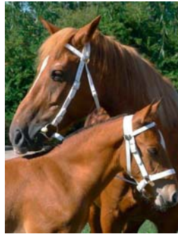
Brides de présentation