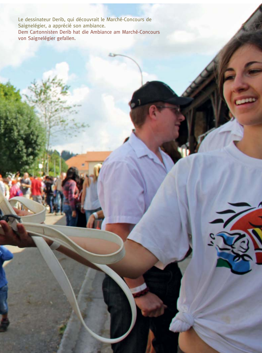
Le dessinateur Derib, qui découvrait le Marché-Concours de Saignelégier, a apprécié son ambiance. Dem Cartoonisten Derib hat die Ambiance am Marché-Concours von Saignelégier gefallen.

Hinter dem zukünftigen Comic, worin die Freiburger Pferde und ihre Heimat eine Hauptrolle spielen, stecken wahre Personen, es ist nicht alles erfunden. Wie bereits bei den Kühen des Val d'Hérens, verwendet Derib echte Personen und Erfahrungen für sein Album. Seine Arbeitsweise hat er sich bereits bei früheren Arbeiten erfolgreich angeeignet (Jo, No Limits und Pour toi Sandra). Auch die Heldin des kommenden Comics existiert in Fleisch und Blut: es ist eine junge und