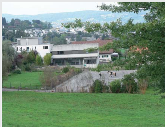
La procédure de consultation officielle arrivera à terme fin novembre. Die öffentliche Vernehmlassung dauert bis Ende November

Der genaue Text des Entwurfes sowie der erläuternde Bericht dazu können heruntergeladen werden unter: http://www.are.admin.ch/themen/recht/04651/index.html?lang=de . Es sind die Artikel 34b und 42b E-RPV, welche die Pferdehaltung direkt betreffen.