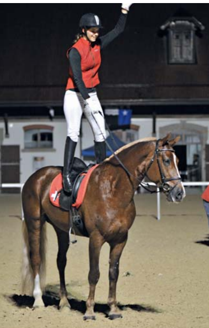
FM-Show le samedi soir Freibergershow am Samstagabend