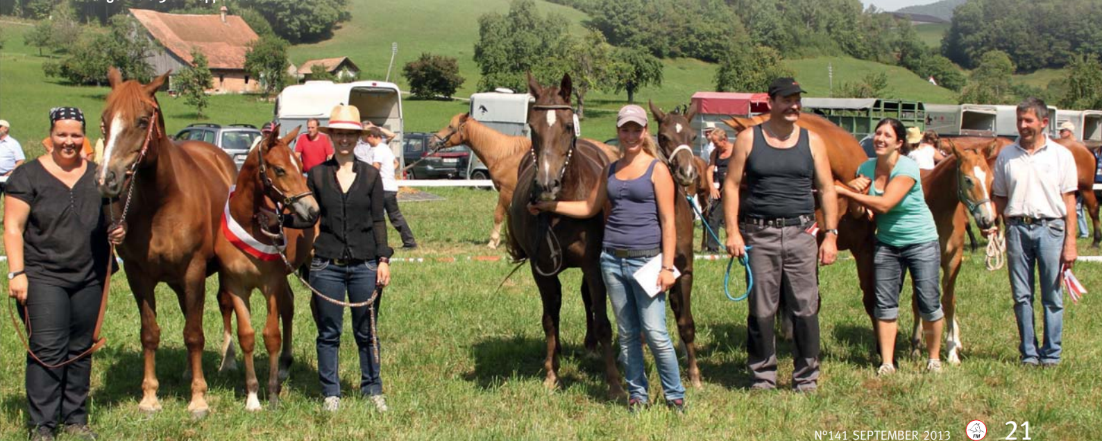
Les trois premières du rappel des pouliches Die Ränge 1 bis 3 im Rappel der Stutfohlen