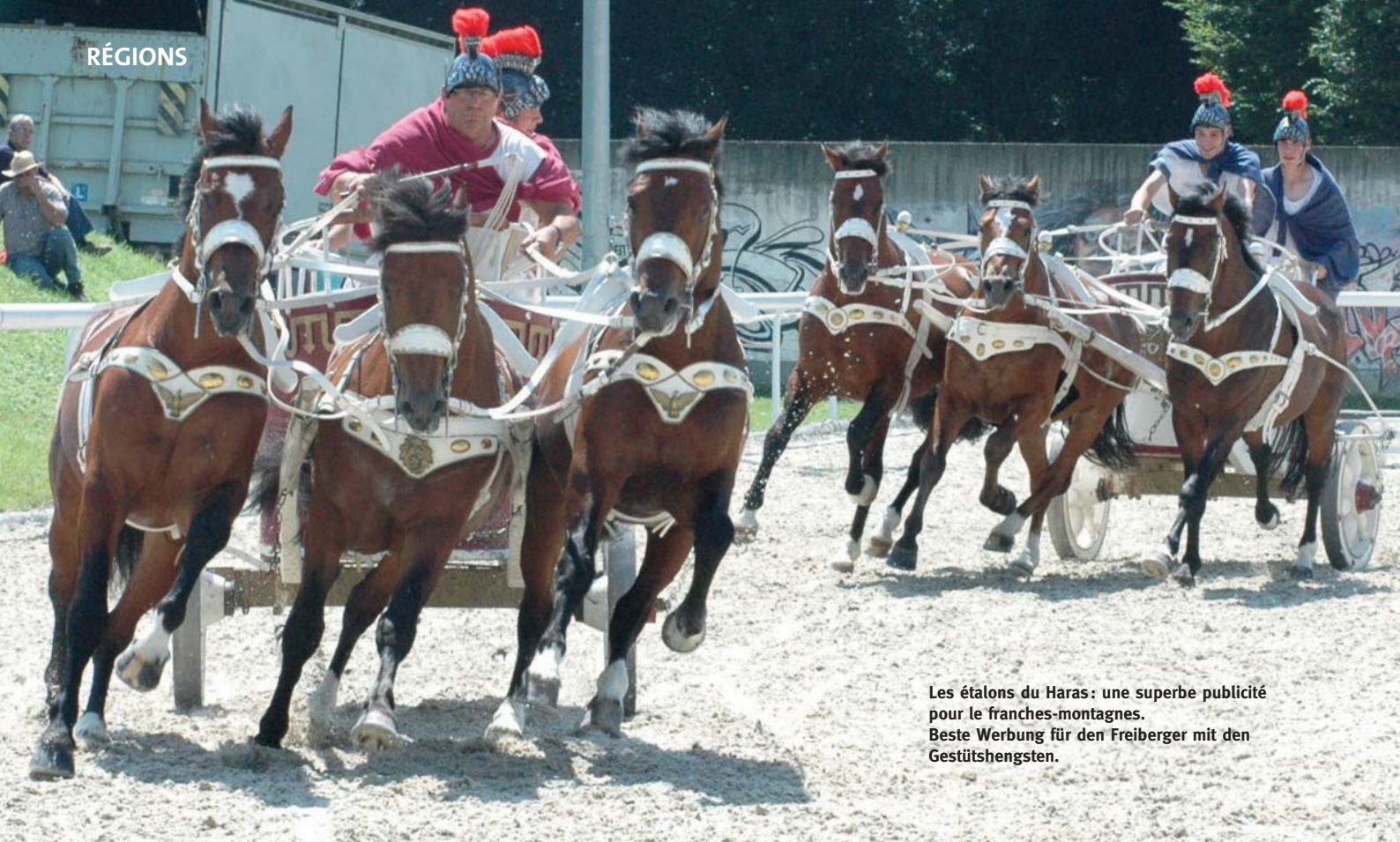
Les étalons du Haras: une superbe publicité pour le franches-montagnes. Beste Werbung für den Freiberger mit den Gestütshengsten.