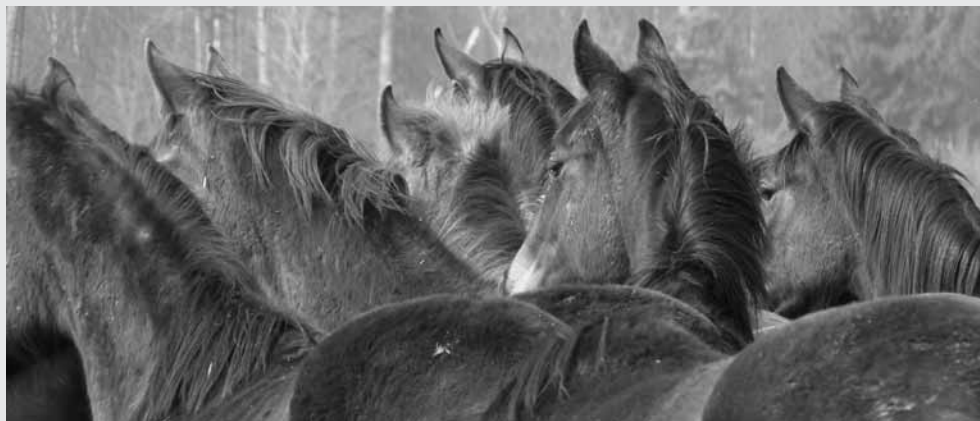
Les jeunes chevaux au pré seront bientôt mieux protégés.

L'image traumatisante de la mort subite de troupeaux entiers de chevaux, sans aucun signe précurseur, pourrait devenir de l'histoire ancienne. Les chercheurs de la Clinique équine de l'Université de Berne ont identifié la toxine de la bactérie Clostridium sordelli comme responsable d'une maladie mortelle: 'la myopathie atypique des équidés'.