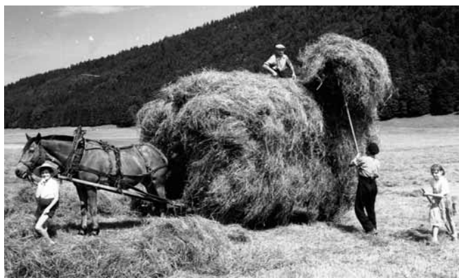
Les foins dans la vallée de La Sagne, en 1956.

C'est le 13 juin 1909 que le «Syndicat d'élevage du cheval postier» a vu le jour. M. Hans Strubin fut le premier président.