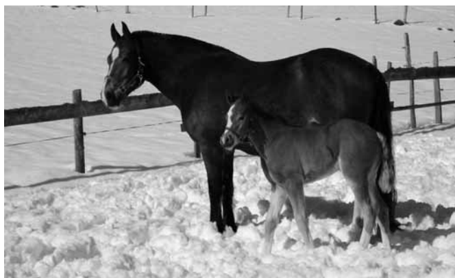
Première sortie pour California (Halloween) avec sa mère Pâquerette.

Am 13. Juni 1909 wurde die «Pferdezuchtgenossenschaft des Postpferdes» gegründet. Herr Hans Strubin war der erste Präsident. An der zweiten Versammlung wurde der Name der Genossenschaft in «Pferdezuchtgenossenschaft Postier-Breton»,