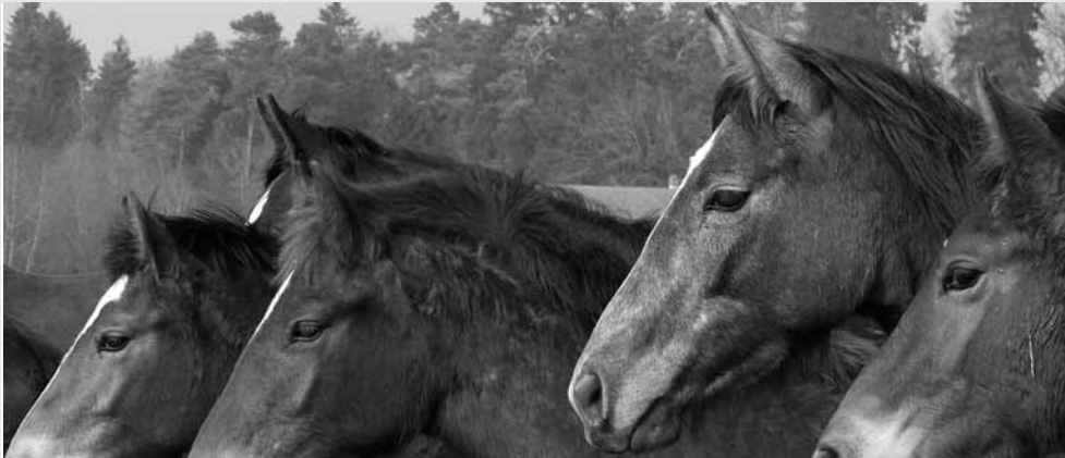
Junge Weidepferde werden bald besser geschützt.

Das schreckliche Bild des plötzlichen Todes meist mehrerer Weidepferde auf einen Schlag könnte bald der Vergangenheit angehören. Anlässlich der diesjährigen Jahrestagung des Netzwerks Pferdeforschung Schweiz im letzten April, haben die Forscher der Pferdeklinik der Universität Bern ihre Resultate vorgestellt. Die Berner Equipe hat das Toxin des Bakteriums Clostridium sordelli als Verantwortlichen einer fatalen Krankheit beim Pferd identifiziert: «Die atypische Weidemyopathie».