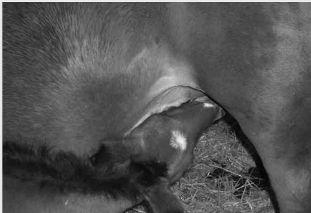
Un poulain trouve instinctivement la tétine de sa mère Ein Fohlen findet instinktiv die Zitzen seiner Mutter, um daran zu saugen.

Garder un cheval motivé est essentiel pour avoir un cheval coopératif. L'équitation est souvent basée sur le renforcement négatif qui, d'après les études, construirait une relation négative entre le cheval et le cavalier. Pour améliorer la relation avec son cheval, il ne faut pas oublier de le récompenser lorsqu'il répond de manière correcte. Pour limiter le renforcement négatif, on peut aider le cheval à comprendre la demande en utilisant son instinct. Par exemple, pour apprendre à un jeune cheval à avancer à la suite de la pression des jambes, on peut mettre un cheval devant lui et mettre de la jambe au moment où celui-ci part au pas et le récompenser ensuite. Le cheval associe ainsi les jambes au départ au pas.