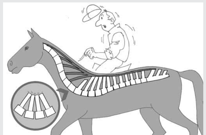
Tête haute : faux. Kopf hoch: falsch