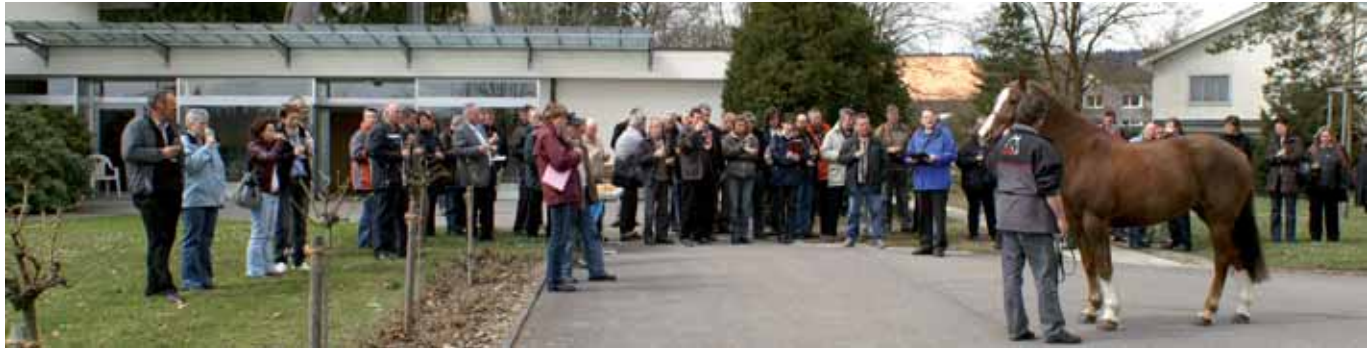
Après l'assemblée, les délégués ont apprécié l'élevage chevalin du Seeland lors de l'apéro. Nach der Versammlung geniessen die Delegierten bei einem Apéro die seeländische Pferdezucht.

Der Bernische Pferdezuchtverband läuft Gefahr in wenigen Jahren Konkurs zu gehen. An der Delegiertenversammlung wurde über mögliche Lösungen orientiert.