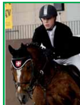
OFFA St-Gall: Le franchises-montagnes comme cheval de saut, une des épreuves de la coupe FM OFFA St. Gallen: Der Freiburger als Springpferd, Teilprüfung FM-Cup

Ein – ja sogar ein mehrfaches – grosses «Hut ab» und ein riesengrosses Dankeschön richte ich an Euch, meine Damen, liebe Mitarbeiterinnen und meine Herren, liebe Mitarbeiter der Geschäftsstelle. Eure Arbeit war vorbildlich und verdient meine und unsere restlose Anerkennung.