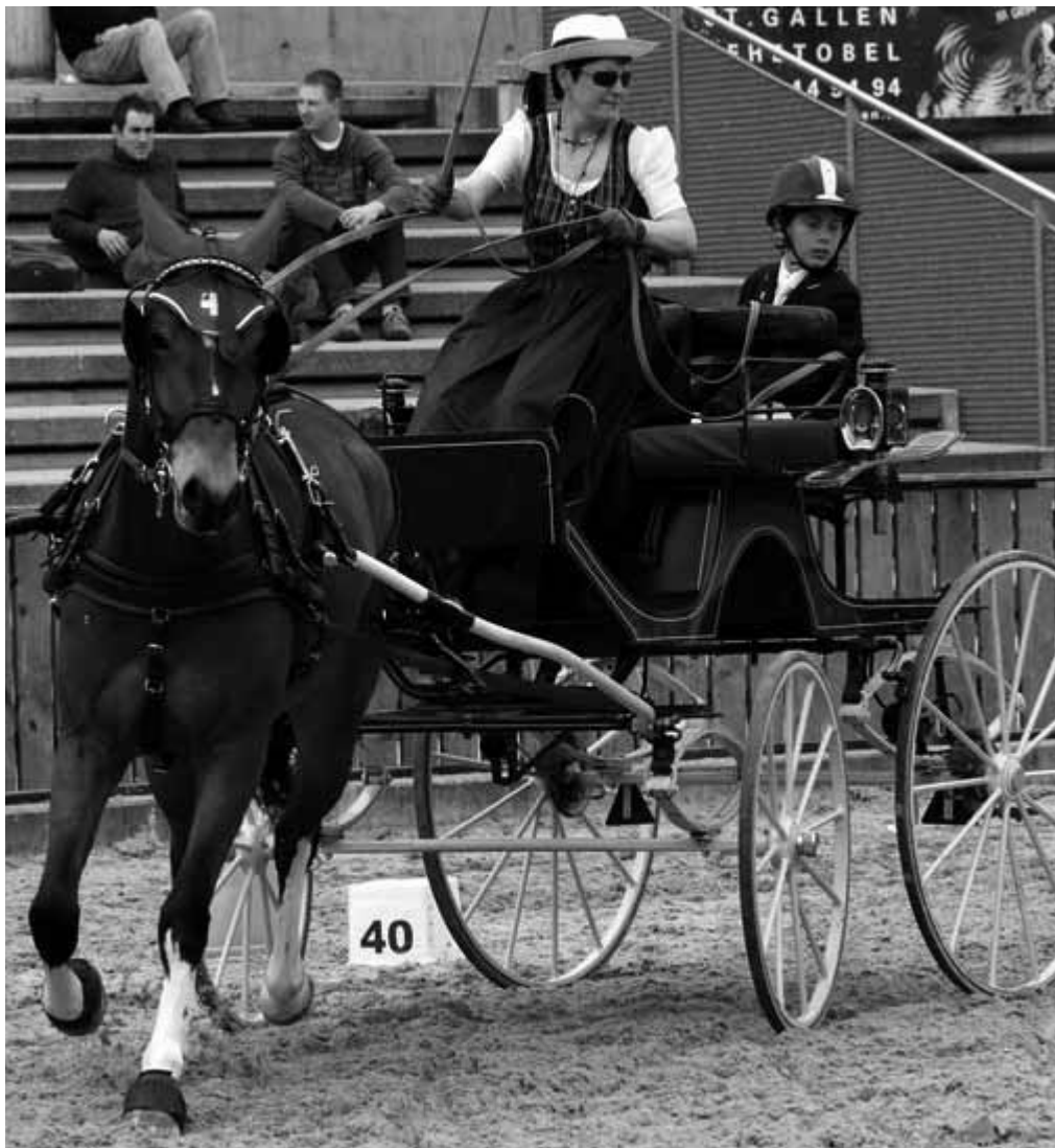
L'attelage, une des épreuves de la Coupe FM. Der Freiburger im Punktefahren, Teilprüfung FM-Cup.