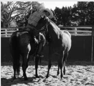
L'utilisation d'un autre cheval durant l'apprentissage permet au jeune cheval d'être moins stressé.

Wie lernt das Pferd? Es ist essentiell für jeden Pferdeausbilder, dass er die wichtigsten Antworten auf diese Frage kennt. Wie alle Tierarten lernen Pferde wesentlich schneller diejenigen Aufgaben, die ihrer Natur entsprechen. Kleine Horizonsverweiterung betreffend «erlernt» und «angeboren».