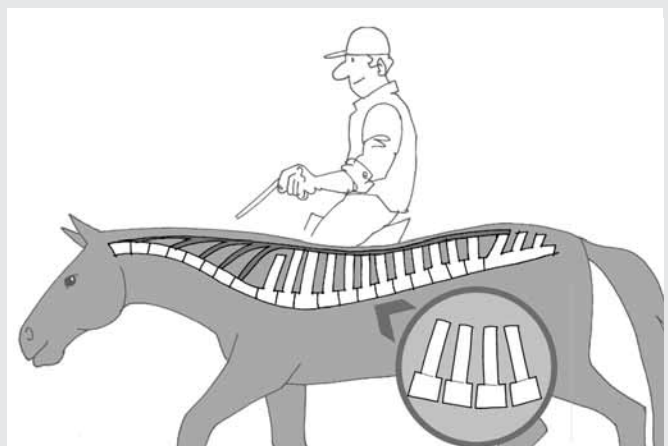
Tête basse: juste. Kopf unten : richtig

Referenzen : Netzwerk Pferdeforschung Schweiz 2007, Vortrag von M. Weishaupt und K. von Peinen. Eine von vielen Publikationen. Von Peinen K., Wiestner T., Bogisch S., Roepstorff, L., van Weeren P.:R., Weishaupt, M.:A., Relationship between the forces acting on the horse's back and the movements of rider and horse while walking on a treadmill . Equine vet. J. , 41 (3), 285-291, 2009.