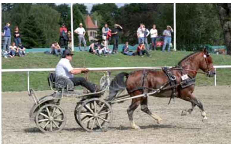
L'attelage, un sport où le FM s'illustre régulièrement.

rique, mais cela reste un ouvrage sur la race, avec des éléments techniques comme les lignées, les pedigrees, les croisements, l'apport de sang étranger, etc. Ce livre n'est cependant pas un manuel d'élevage. Il n'est pas là non plus pour dire à quoi devrait absolument ressembler le FM parfait.