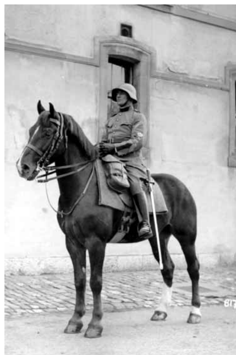
Un sous-officier de cavalerie dans les années 1940.

Jahren des zwanzigsten Jahrhunderts eröffnete der Freizeitsektor dem Freiburger Pferd neue Perspektiven. Mit all den