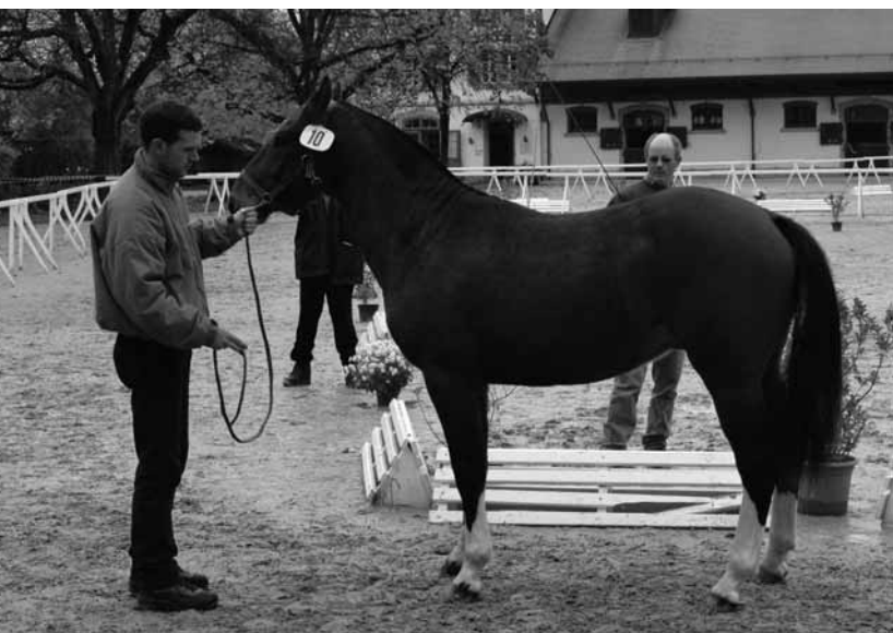
Champion du rappel des dix-huit mois: Vol de Nuit (Van Gogh/Lucky Luke), Jean-Martin Gigandet, Le Prédame. Rappelsieger bei den 1 1/2-Jährigen: Vol de Nuit (Van Gogh/Lucky Luke) von Jean-Martin Gigandet Le Prédame.

Cette présentation permet de constater aisément, ceci entre les étalons les plus âgés, nés en 1990 / 91, et les plus jeunes, la tendance vers un type sportif, qui imprègne l'élevage, même si l'âge des étalons ne peut pas toujours être mis en relation directe avec leur type. Ces présentations à la main procurèrent aux éleveurs le plaisir de s'émerveiller devant des étalons de types variés