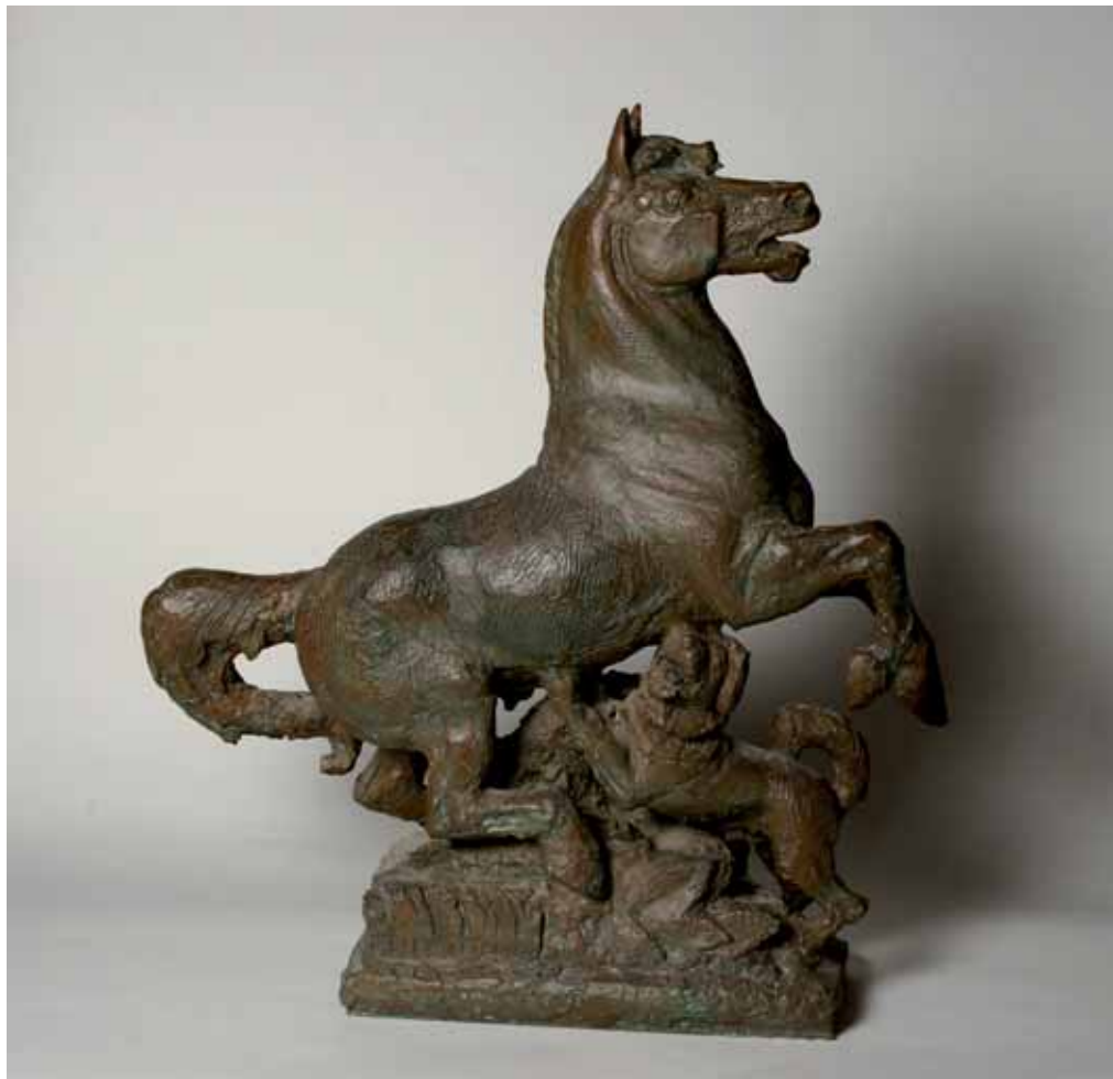
Projet de Charles L'Eplattenier pour un monument dédié au franchises-montagnes.

Ich habe die Machtkämpfe zwischen den diversen Stellen, welche für das Zuchtziel verantwortlich waren, untersucht. Der Bund, das heisst die Armee, welche das Pferd in der Kavallerie einsetzte, wollte ein robustes, eher aufgewecktes