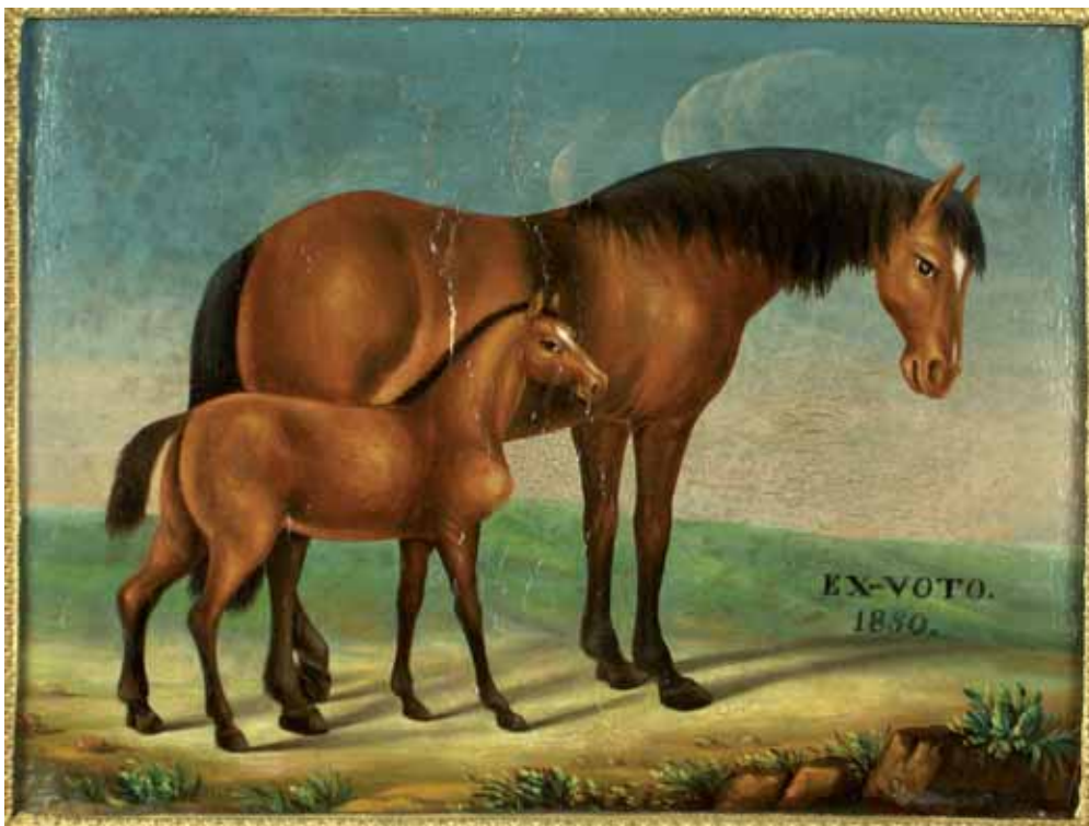
Une des premières représentations du franches-montagnes. Ex-voto de 1850 dans l'église des Bois. Ein der ersten Bilder der Freiberger. Ex-voto von 1850 in der Kirche Les Bois.