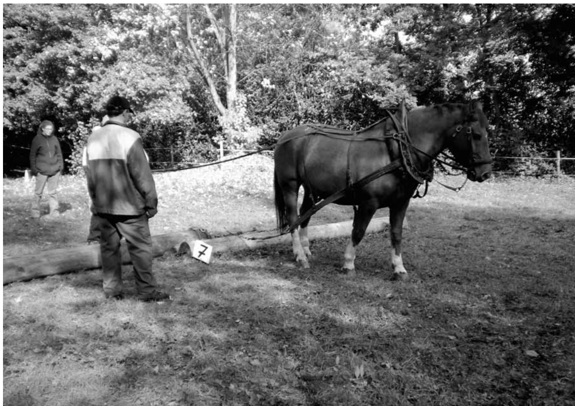
Débardage, Hans Graf. Rücken, Hans Graf.

konnten die Teilnehmer die verschiedenen Fahrsysteme, darunter hauptsächlich die Achenbachmethode (die im Schweizerischen Fahrbrevetkurs des Schweizerischen Pferdesportverbandes SVPS ebenfalls angewendet wird) verstehen und ausprobieren.