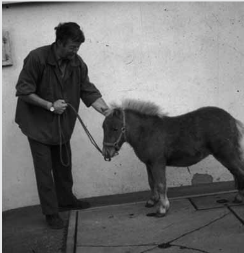
Contrôler le poids du cheval représente une prévention importante contre la fourbure. Gewichtskontrolle ist eine wichtige Prophylaxe gegen Hufrehe.