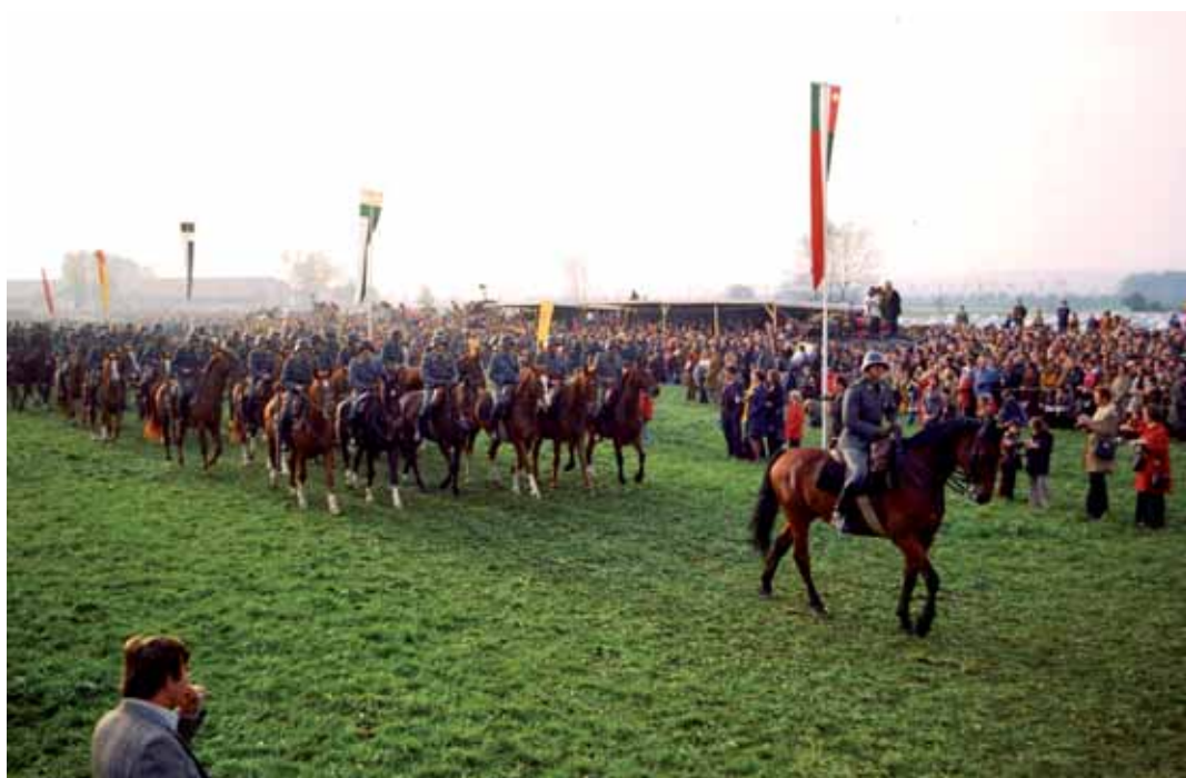
Le dernier défilé de la cavalerie à Avenches en 1973. Der letzte Parade der Kavallerie in Avenches 1973.