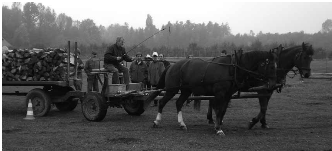
Traction lourde, Henri Spychiger. Schwertransporte, Henri Spychiger.

Marcel Jäggi insiste sur les règles de sécurité à appliquer avec des machines à traction animale, comme ne jamais se placer entre le cheval et la machine, car si l'animal s'emballle, le meneur serait en grand danger. Si les chevaux s'emballent alors que le meneur est assis sur la machine,