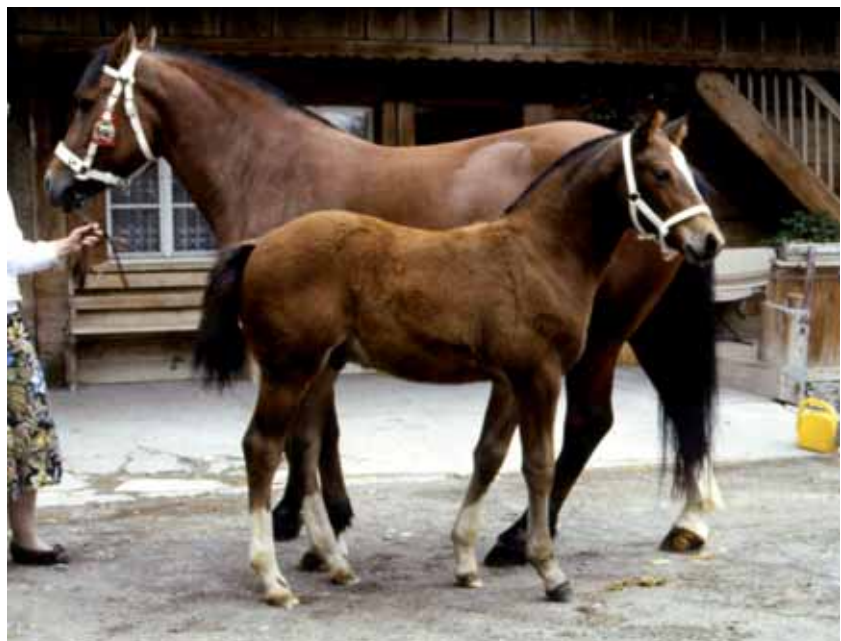
L'étalon Nestor à l'âge de six mois. Der Hengst Nestor im Alter von sechs Monaten.

Rasse mit technischen Elementen, wie die Zuchtlinien, die Stammbäume, die Kreuzungen, der Fremdblutzufluss usw. Dieses Buch ist trotzdem nicht ein Handbuch für Züchter. Und es wurde auch nicht gemacht, um uns zu sagen, wie der perfekte Freiburger aussehen sollte.