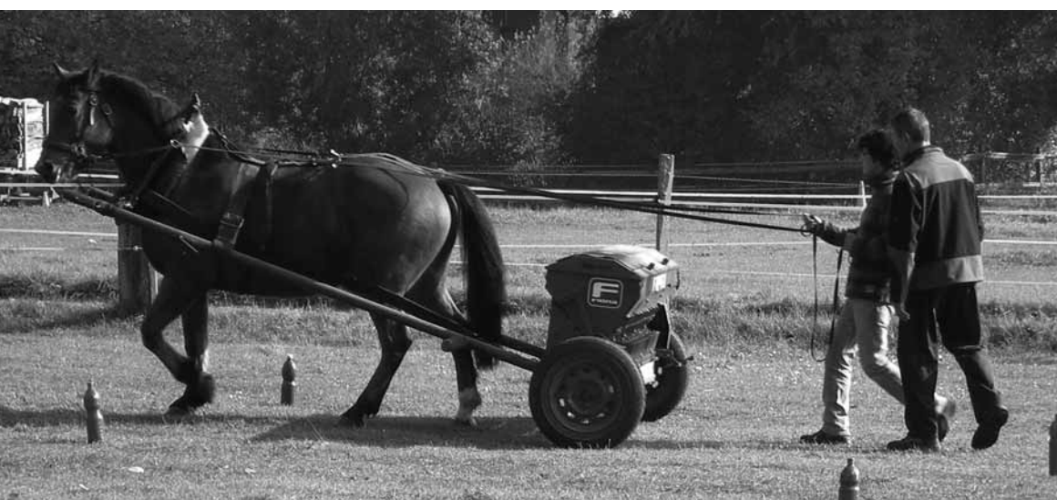
Semoir à engrais, André Stähli. Düngerstreuer, André Stähli.

l'importance d'avoir un cheval totalement à l'écoute de ses ordres, etc.