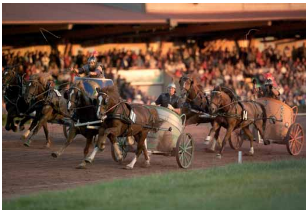
Les courses de chars romains, une des attractions du Marché-concours de Saignelégier. Die Rennen der römischen Wagen, eine der Attraktionen des Marché-Concours in Saignelégier.

Je me suis intéressé aux luttes d'influence entre les diverses instances responsables de l'élevage. La Confédération, c'est-à-dire l'armée, qui utilisait le cheval pour la cavalerie souhaitait un sujet robuste, plutôt vif et léger. Tandis que la commission cantonale bernoise, qui privilégiait le travail agricole, voulait un cheval lourd pouvant se maintenir face au