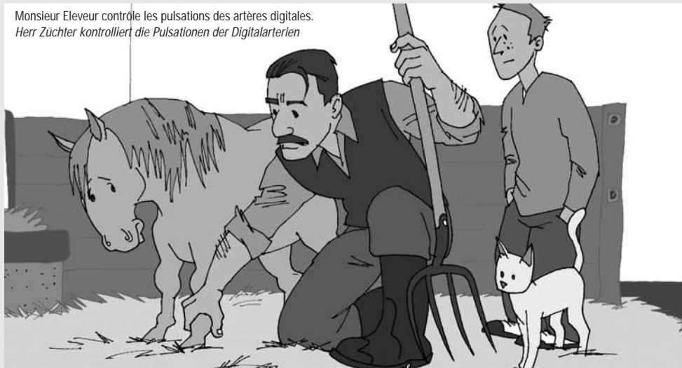
Monsieur Eleveur contrôle les pulsations des artères digitales. Herr Züchter kontrolliert die Pulsationen der Digitalarterien