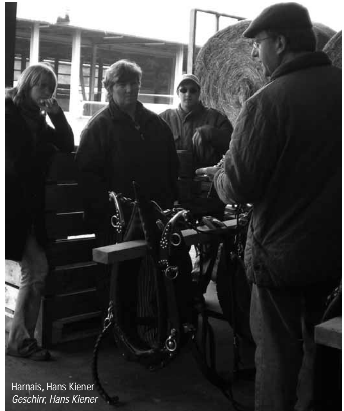
Harnais, Hans Kiener Geschirr, Hans Kiener

Ein gut eingestelltes und dem Pferd angepasstes Geschirr verhindert Druckstellen und Verletzungen. Ein zu grosses Arbeitskummet führt zu Reibungen an den Schultern oder um den Hals des Pferdes und ist der Grund für offene Stellen. Um dies zu verhindern, kann man ein Unterkummet verwenden, welches die zu grossen Partien des