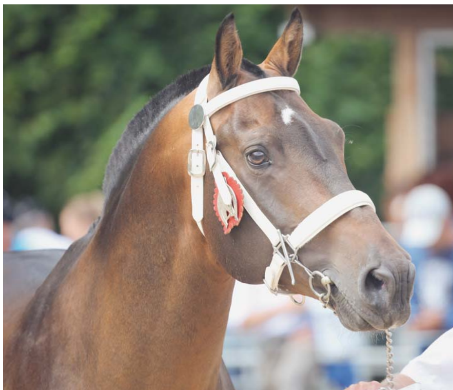
La présentation des étalons reproducteurs était un régal pour les yeux, avec en photo l'étalon Chianti. Die Präsentation der Zuchthengste war eine Augenweide, im Bild Hengst Chianti.