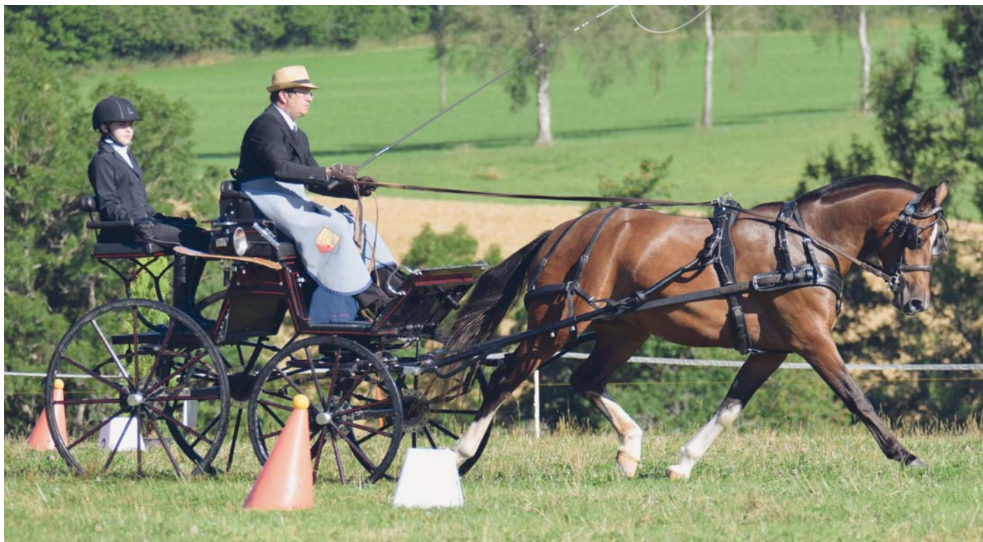
Charmeuse de la Pommerai (Etendard du Clos Virat x Népal) s'est placée au 3 e rang dans l'épreuve des 3 ans. Charmeuse de la Pommerai (Etendard du Clos Virat x Népal) belegte den dritten Platz in der Prüfung für 3-Jährige.