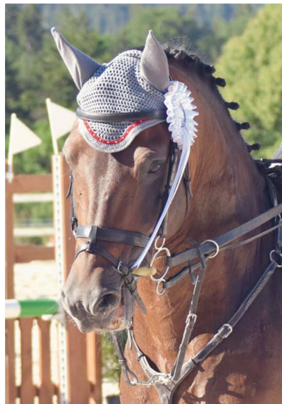
Historique (Hermitage x Hybrid) a remporté l'épreuve de FMIII. Historique (Hermitage x Hybrid) gewann die FMIII-Prüfung.

Müde, aber mit einem Lächeln im Gesicht, schloss das Organisationskomitee dieses Wochenende in Tavannes ab, dass ganz im Zeichen des FM stand. Wir möchten uns auch bei allen Sponsoren und Helfern bedanken, die für den reibungslosen Ablauf dieses Tages gesorgt haben. Ohne ein gut eingespieltes Team wäre eine