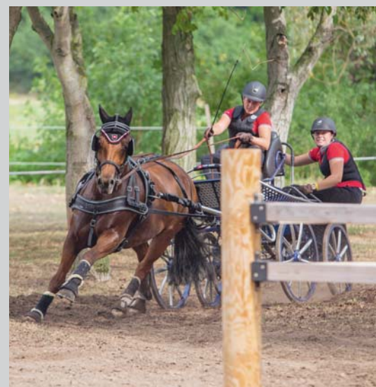
Couverture / Titelseite Championnat d'Europe Juniors. Junioren Europa-Meisterschaft.

Ausland Raiffeisenbank Much-Ruppichteroth BLZ 37069524 - Deutschland Compte/Konto 5540011 Pour la France, envoyer votre chèque à: FSFM CP 34 - Les Longs Prés 2 1580 Avenches