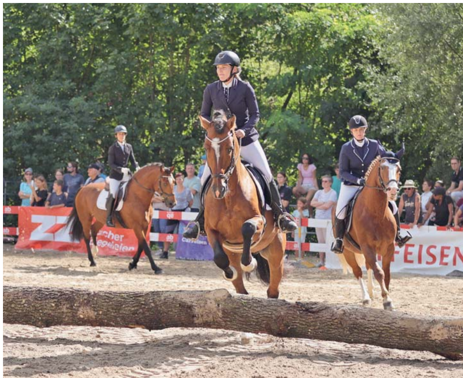
Farandole d'étalons, un moment fort du programme du spectacle. / Farandole mit Hengsten, ein Höhepunkt im Showprogramm.

Freiberger-Kreuzungsnachkommen hatten ihren Auftritt ebenso wie Freiberger-Hengst 'Churchill PBM'. Die Pensionäre des Gastgeber-Stalles hatten die Show-Nummer Lion King parat und mit der abschliessenden Farandole aller Hengste gab es einen weiteren Höhepunkt.