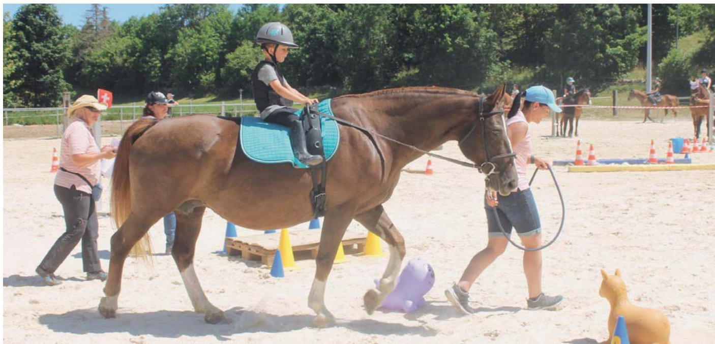
Le cheval franches-montagnes, pour les grands et les petits ! / Das Freiberger Pferd, für Groß und Klein!

Am Sonntag, dem 17. Juli, fand zum vierten Mal der von der Kavalleriegesellschaft der Freiberge organisierte FM-Tag statt. Auf dem Programm standen offizielle und freie Gymkhana-Prüfungen sowie eine Rallye durch die Freiberger Weiden.