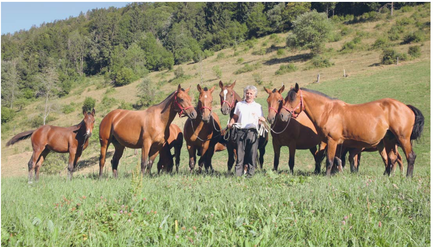
La mère souche 'Lea' (Camillo) avec ses quatre filles Livia, Leandra et Luna (toutes trois par Habanero) ainsi que Leila (par Chianti) avec ses poulains nés en 2022. Stamm-Mutter 'Lea' (Camillo) mit ihren vier Töchtern Livia, Leandra und Luna (alle drei von Habanero) sowie Leila (von Chianti) mit ihren 2022 geborenen Fohlen.