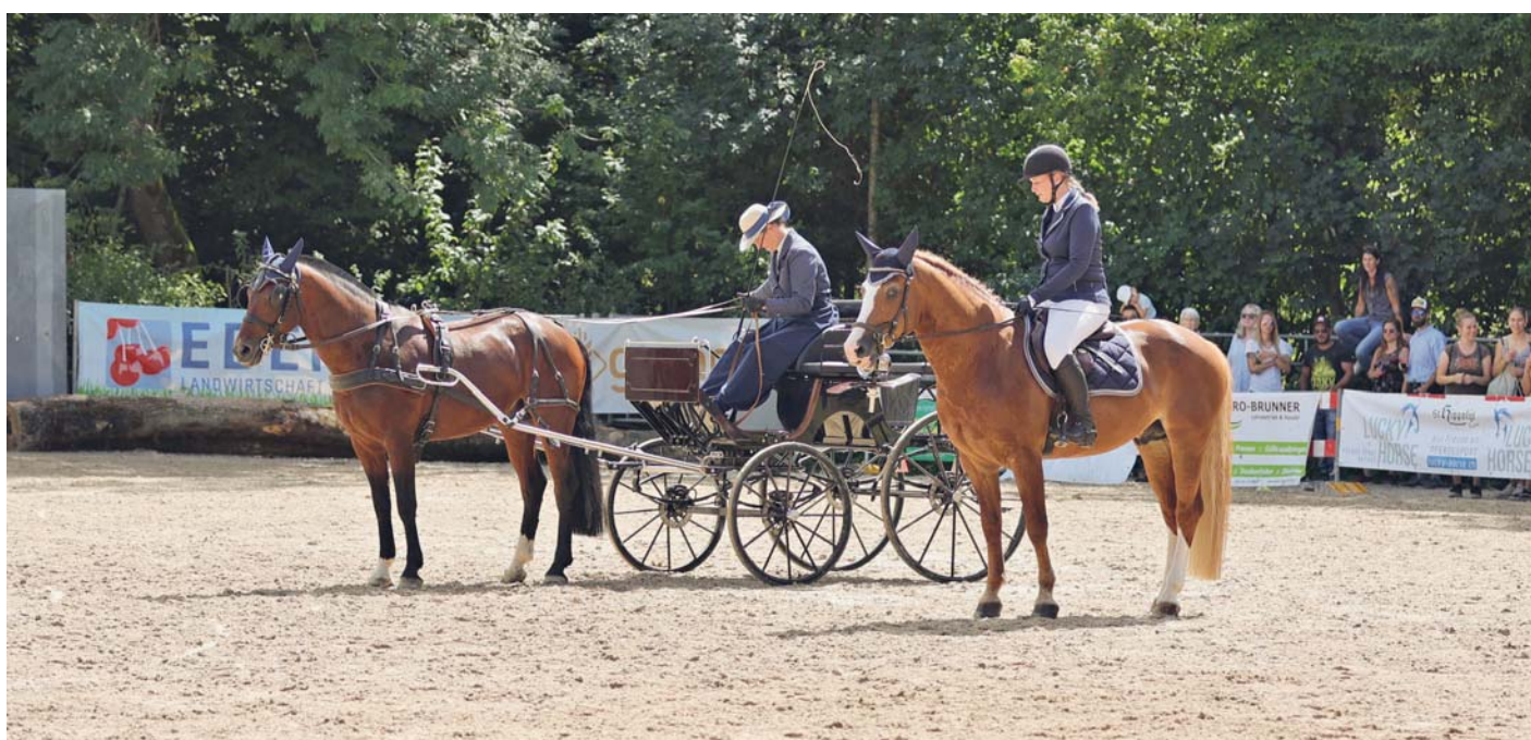
Les étalons franches-montagnes Nax (attelé) et Hornet (monté). / Die Freibergerhengste Nax (gefahren) und Hornet (geritten).

Texte de l'article : Karin Rohrer