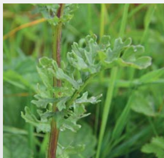
Séneçon Jacobée: Les feuilles, lancéolées (en forme de fer de lance), vert clair et dentées (dont les bords sont crénelés comme des dents), sont présentes de juin à octobre. Jakobskreuzkraut: Die Blätter sind lanzenförmig, hellgrün und gezahnt (die Blattränder sind zinnenförmig wie bei einem Zahnrad) und zwischen Juni und Oktober vorhanden. (Nelly Genoux)

Les signes indiquant une intoxication chronique regroupent : la constipation, l'apparition de coliques récidivantes et de crampes abdominales, l'inflammation de la muqueuse intestinale, la soif excessive,