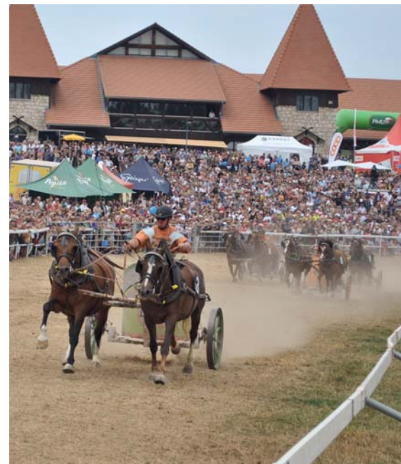
La dureté de la piste et la sécheresse ont rendu les courses de chars romains plus périlleuses. Heureusement sans causer d'accidents. Römerwagenrennen – Der harte Boden wegen der Trockenheit machte das Römerwagenrennen schwieriger – zum Glück ohne Unfall!