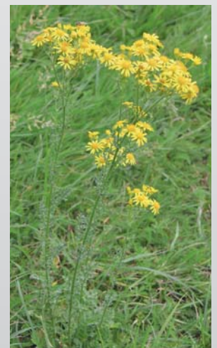
Séneçon Jacobée: cette plante vivace ne forme la première année qu'une rosette de feuilles longues de 20 cm. Tiges et fleurs n'apparaissent que la 2 e année. Jakobskreuzkraut: Diese mehrjährige Pflanze formt im ersten Jahr lediglich eine Rosette von ungefähr 20 cm langen Blättern. Stängel und Blüten erscheinen erst im zweiten Jahr. (Nelly Genoux)

Les signes indiquant une intoxication aiguë regroupent: la modification de l'état de conscience (apparition de phases d'excitation ou au contraire d'abattement), l'ataxie (défaut de coordination motrice - les chevaux titubent, tournent en rond sans but apparent, se cognent contre les murs ou les clôtures) et une baisse de la vision engendrant des blessures. Les animaux malades s'isolent du troupeau, leur pouls et leur fréquence respiratoire augmentent. Ils bâillent, leur urine est brune foncée. Le foie et les reins sont endommagés, ce qui entraîne une coloration jaune des muqueuses (jaunisse) et des conjonctives. La muqueuse intestinale