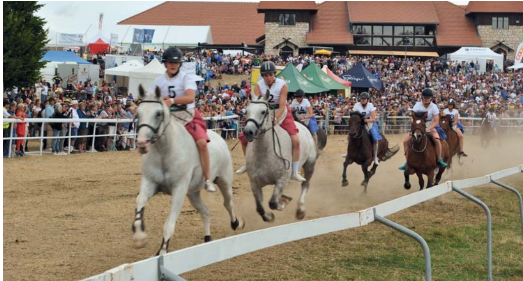
L'art de monter à cru et en costume traditionnel n'exclut pas la volonté de l'emporter. Bauernrennen – Die Kunst, ohne Sattel zu reiten in der traditionellen Tracht, hält nicht davon ab, gewinnen zu wollen.

Das FM-Pferd hat also seinen öffentlichen Wiedereinstieg erfolgreich gemeistert, während verschiedener Shows, die im Zentrum des Rings von Saignelégier präsentiert wurden. Die beiden lokalen Genossenschaften, die 400 Züchter und 700 Tiere zählen, zeigten ihre Vielseitigkeit. Die Gespanne starteten in einer gekonnten Choreografie. Die Stuten galoppierten mit ihren Fohlen frei vor Zehntausenden von Zuschauern und 400 Pferde paradierten. Auch die Kinder wurden nicht vergessen, mit zahlreichen Animationen,