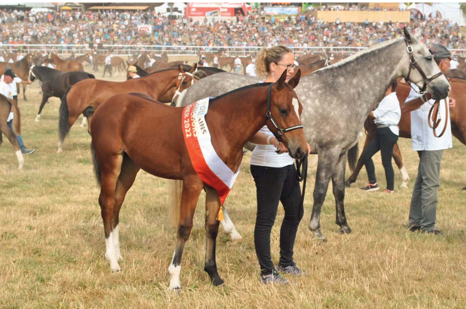
Idylle du Bambois remporte le 1 er rang. / Preisgekröntes Stutfohlen – Idylle du Bambois belegte den ersten Rang.

Euphorisches Wiedersehen mit garantierten Prämien