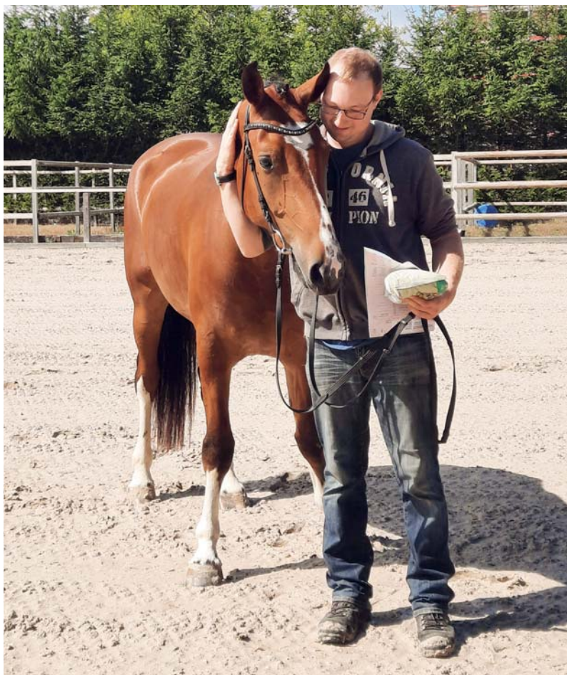
Calysto (Calypso du Padoc/Helvetica) Grand gagnant du TET à Schwarzenburg.

Artikel 13 Absatz 1 des neuen Feldtestreglements sieht vor: "Bei Nichtbestehen oder aus nachgewiesenem Krankheits- oder Unfallgrund kann das Pferd den Feldtest nur einmal wiederholen, grundsätzlich im Alter von 3 Jahren, spätestens aber im Jahr, in dem es 4 Jahre alt wird. Bei Pferden, für die ein tierärztliches Attest (mit Messungen der Körpergröße) vorliegt, dass eine Unfähigkeit zur Teilnahme am Feldtest im Alter von 3 Jahren belegt, kann der Test im Alter von 4 Jahren durchgeführt werden. Der schriftliche Antrag muss jedoch bis zum 31. Oktober des Jahres, in dem das Pferd drei Jahre alt wird, bei der Verwaltung eingehen, d. h. bis zum 31. Oktober 2022 für im Jahr 2019 geborene Pferde. Dieser Antrag muss begründet und zusammen mit der Veterinärbescheinigung (mit Schaftmaß) an folgende Adresse gesendet werden: Gérance FSFM - Service du Stud-book - Les Longs Prés 2 - Case postale 34 - 1580 Avenches/VD. Ein Formular steht auf unserer Website zur Verfügung unter: http://www.fm-ch.ch/fr/infos-pratiques.html .