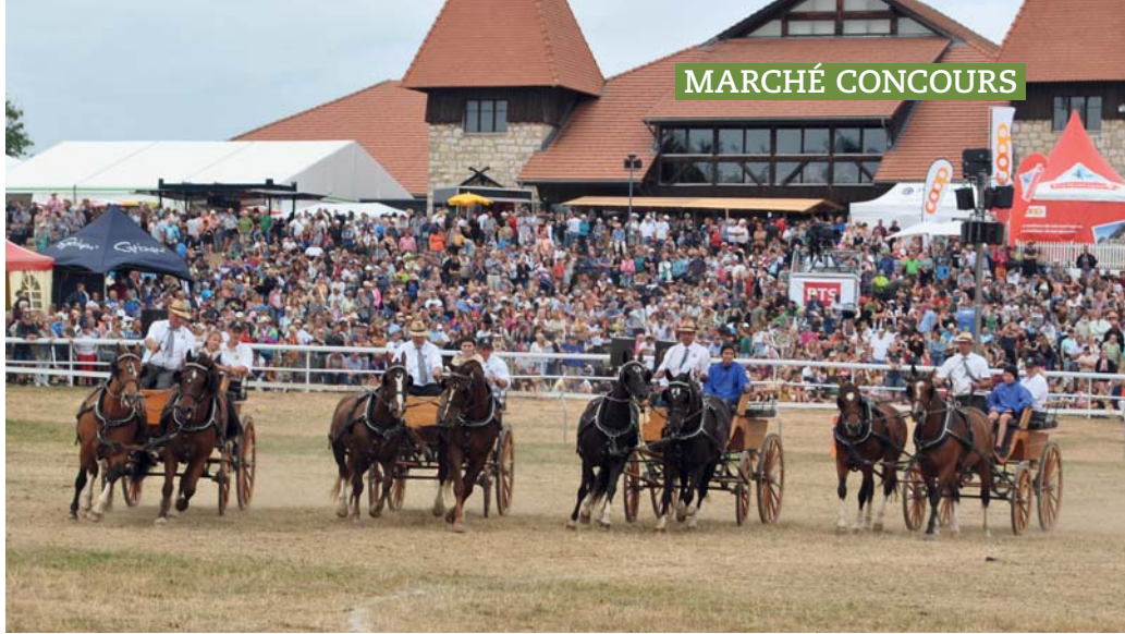
Le traditionnel quadrille campagnard reste l'une des valeurs les plus sûres des démonstrations proposées au nombreux public. Bauern-Quadrille – Sie bleibt die populärste der Vorführungen, die dem zahlreichen Publikum geboten werden.