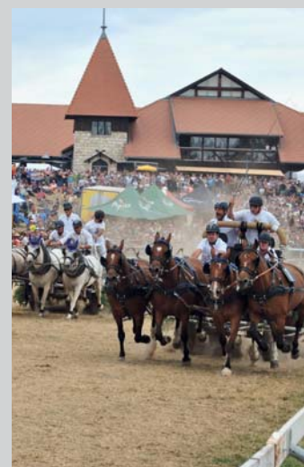
Couverture / Titelseite Course Char 4 chevaux. Vierspänner-Wagenrennen.

Etranger Ausland Raiffeisenbank Much-Ruppichterth BLZ 37069524 - Deutschland Compte / Konto 5540011 Pour la France, envoyer votre chèque à : FSFM CP 34 - Les Longs Prés 2 1580 Avenches