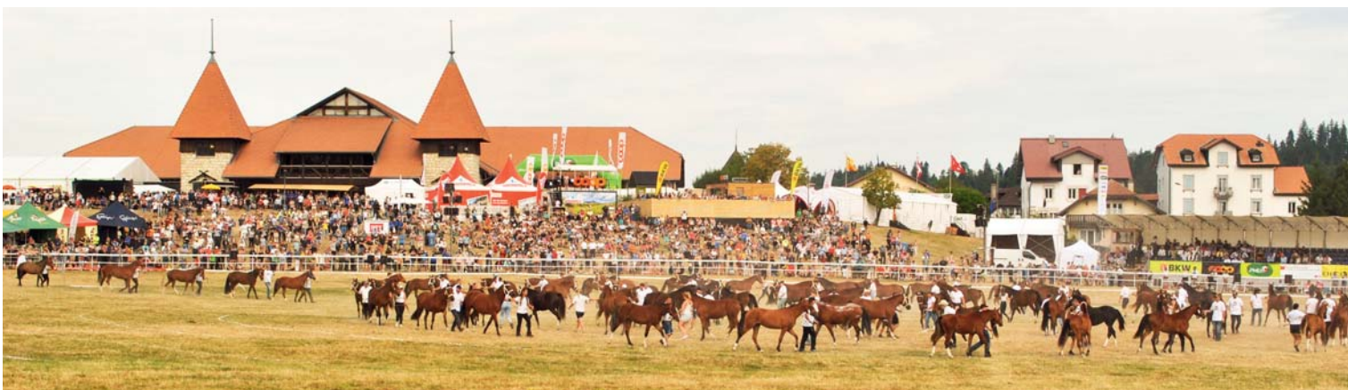
Le dimanche matin, le cheval FM montre toute sa force en formant une rosace géante au milieu de la fête. Pferdeparade - Am Sonntagmorgen zeigt das FM-Pferd seine ganze Stärke, indem es eine riesige Rosette inmitten des Festes bildet.