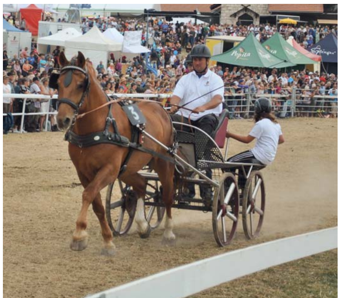
Les attelages montrent aussi leur aptitude à trotter pendant les courses.