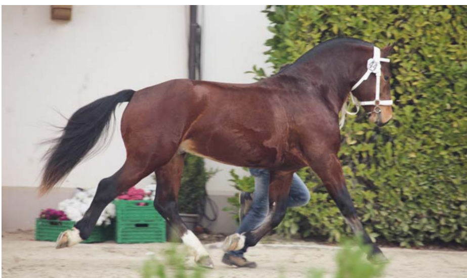
Étalon Coldplay lors du test en station 2019 à Avenches. / Hengst Coldplay im Jahr 2019 am Stationstest in Avenches.

Pour Franz Schwegler, il n'aurait jamais été question de passer à d'autres races : « Cette coolness et cette frugalité sont tout simplement uniques. J'ai toujours apprécié de pouvoir seller mon cheval et de profiter d'une belle balade, même si les chevaux n'ont été qu'au au pré quelques jours. Même en débardant du bois, j'ai toujours été étonné de voir tout ce que ces chevaux sont capables de faire. Pour ce que nous voulons, aucune autre race n'entre en ligne de compte ». Il se souvient aussi avec plaisir de l'expérience qu'ils ont vécue en 2006, lorsqu'ils ont conduit un attelage à deux chevaux (Lianos et Fanny) d'Ettiswil à Offenburg pour l'Eurocheval. 250 km sans problème, profiter du trajet et remporter le concours lors du Vet-Check. « Tous les franchises-montagnes de ce pâturage portent le sang de « Carina », elle a laissé des traces évidentes. Nous faisons ce que nous faisons déjà depuis des années et notre manière de percevoir l'élevage caractérise en fait nos chevaux. Ces Franches-Montagnes se ressemblent tous du point de vue du type, ils sont incroyablement dociles et gentils. Nous avons du plaisir à faire de l'élevage, nous faisons saillir les juments par des étalons appropriés et nous voulons élever des chevaux franchises-montagnes sains, dociles et tout simplement superbes, qui feront le bonheur de leurs futurs propriétaires », s'accordent à dire les Schwegler.