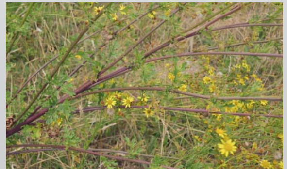
Jakobskreuzkraut: Die Pflanze misst zwischen 30 und 120 cm, ihr Stängel ist aufrecht, eckig und rotbraun gefleckt. Séneçon Jacobée: la plante mesure entre 30 et 120 cm, sa tige est dressée, anguleuse et maculée de brun rougeâtre. (Nelly Genoux)

Die Anzeichen einer akuten Vergiftung umfassen: Bewusstseinsstörungen (Auftreten von Phasen der Erregung oder Abgeschlagenheit), Ataxie (Fehlende motorische Koordination – die Pferde torkeln, drehen sich ziellos im Kreis, schlagen sich an Mauern oder Zäunen) sowie Beeinträchtigungen des Sehsinns, die zu Verletzungen führen. Kranke Tiere isolieren sich von ihrer Herde, ihr Puls und ihre Atemfrequenz sind erhöht. Sie gähnen, ihr Urin ist dunkelbraun. Die Leber und die Nieren sind beschädigt, was zu einer gelben Verfärbung der Schleimhäute (Gelbsucht) und der Bindehaut führt. Die Darmschleimhaut kann zudem entzündet sein. Nach einer schweren Vergiftung ist eine Heilung nicht möglich und das Pferd muss eingeschläfert werden.