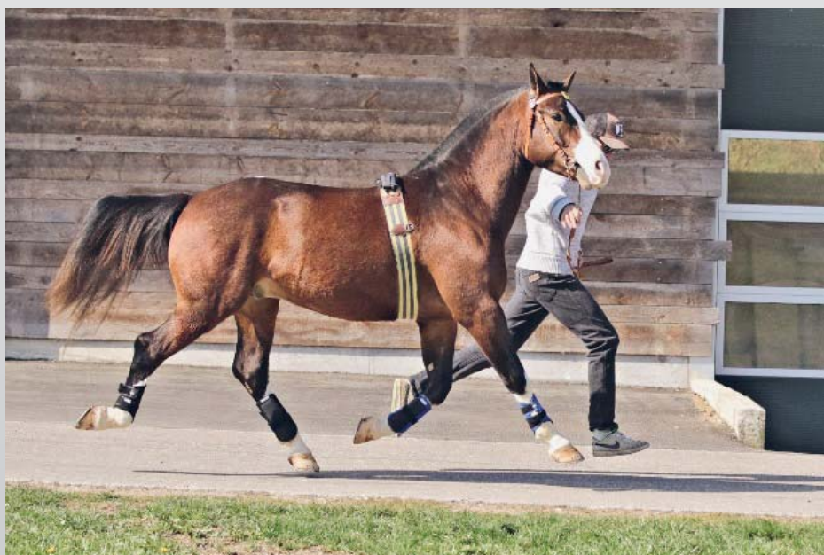
Figure 2 : pour le projet, les chevaux sont présentés sur une ligne droite en asphalt d'environ 30 mètres. Abbildung 2: Für das Projekt werden die Pferde auf einer geraden Asphalt-Strecke von zirka 30 Metern vorgeführt.

Avec les données récoltées en 2022, nous allons estimer l'héritabilité de nos mesures. En plus des angles articulaires mesurés de profil, nous mesurons les chevaux de face, ce qui devrait nous permettre de mieux quantifier la qualité de la jambe antérieure (Figure 4). Nous remercions tous les éleveurs qui nous ont permis de mesurer leurs chevaux. Le projet continue jusqu'en Décembre 2023, et la participation est gratuite. Intéressé(e)s? Vous pouvez vous adresser directement à Annik Gmel (annik.gmel@agroscope.admin.ch) pour plus de détails.