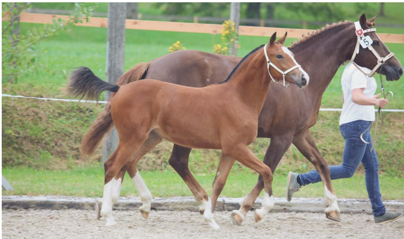
L'année dernière, Nike vom Lauwilberg (Neverboy du Mecolis) a décroché la deuxième place à Laufen. / Letztes Jahr holte sich Nike vom Lauwilberg (Neverboy du Mecolis) den zweiten Rang in Laufen.

Text: Karin Rohrer