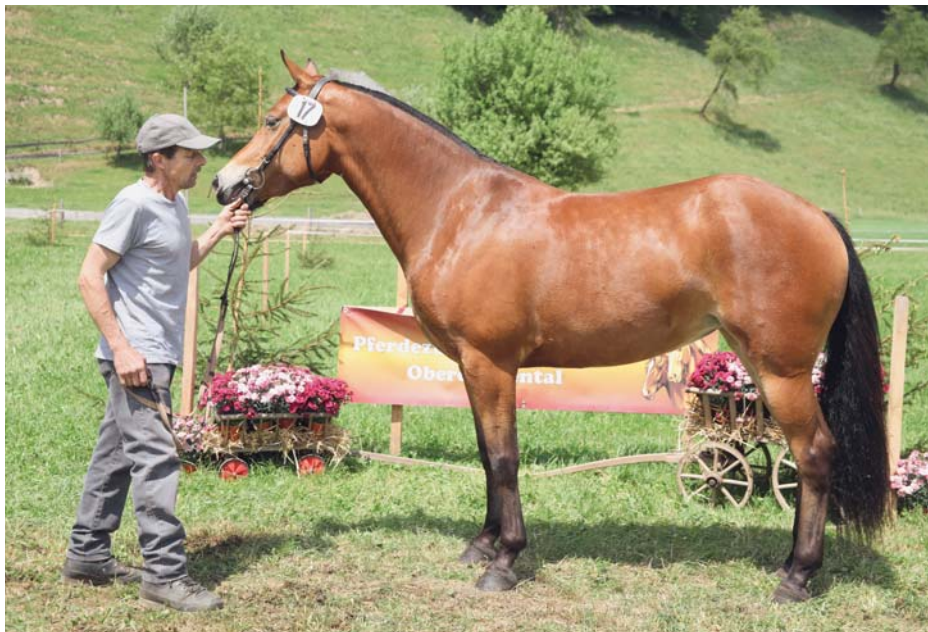
5 e rang pour Cala (Cookies) appartenant à Fritz Röthlisberger de Gohl. / 5. Rang für Cala (Cookies) von Fritz Röthlisberger aus Gohl.