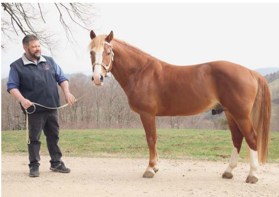
Hornet, l'étalon alezan né en 2007, se présente en pleine forme. Der 2007 geborene Fuchs-Hengst Hornet präsentiert sich in top Form.