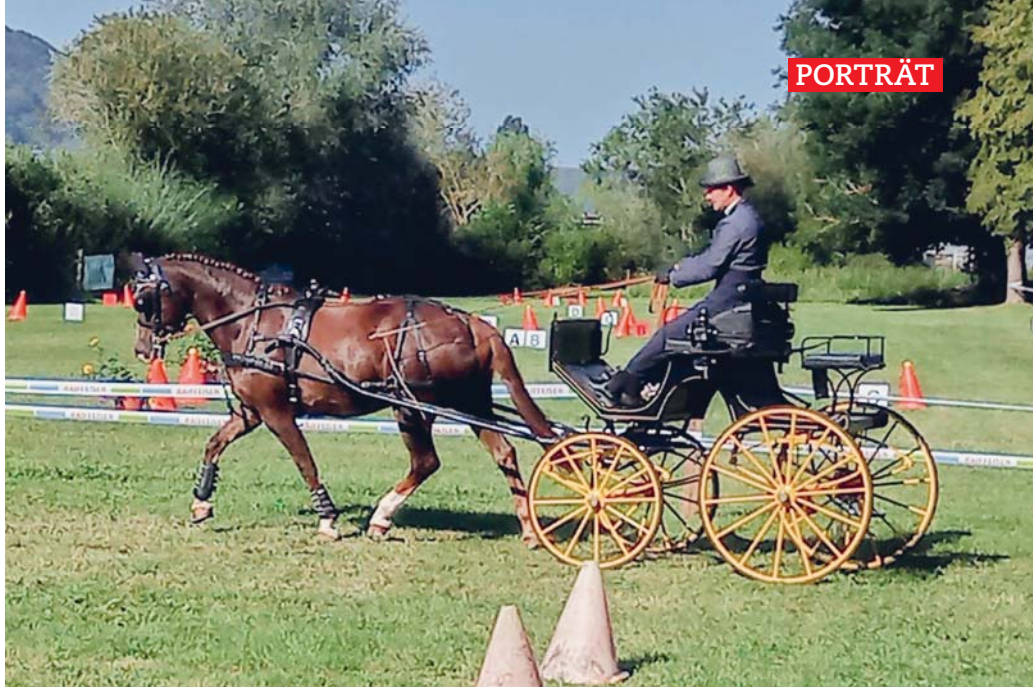
Hermine se présente bien, ici en 2021 au concours d'attelage de Witterswil. Hermine macht am Wagen eine gute Figur, hier im Jahr 2021 am Fahrtturnier in Witterswil.