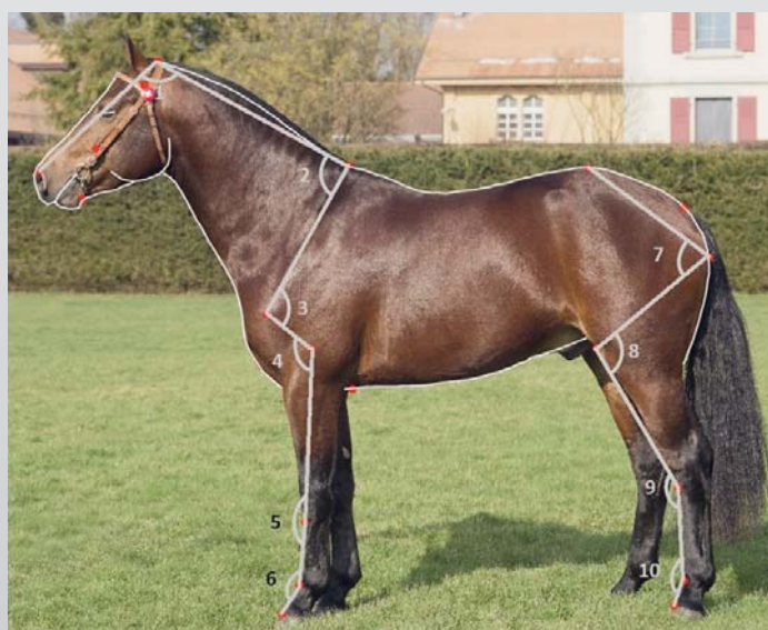
Figure 1 : Le Horse Shape Space, appliqué à un étalon franches-montagnes. On doit d'abord tracer le contour de toutes les photos de l'échantillon à l'ordinateur, puis extraire les angles morphologiques entre certains points anatomiques. Abbildung 1: Horse Shape Space Modell angewandt an einem Freiberggerhengst. Die Varianz im Umriss und einige Gelenkwinkel können aus dem Modell berechnet und analysiert werden. © Gmel et al. 2018

Cinq chevaux au total étaient en dessous de 150 cm au garrot, les plus petits, deux juments et un hongre, avaient une taille de 146 cm. Le groupe de hongres était en moyenne plus grand, avec plus de chevaux tirant dans les extrêmes et un maximum de 164 cm pour le hongre le plus grand. En moyenne, les juments étaient les plus petites. Chaque année (en 2020 et en 2021) un des élèves étalons mesuré toisait à 160 cm et donc atteignait la limite de taille maximum définie par le but d'élevage. Les plus petits élèves étalons mesuraient eux 152 cm.