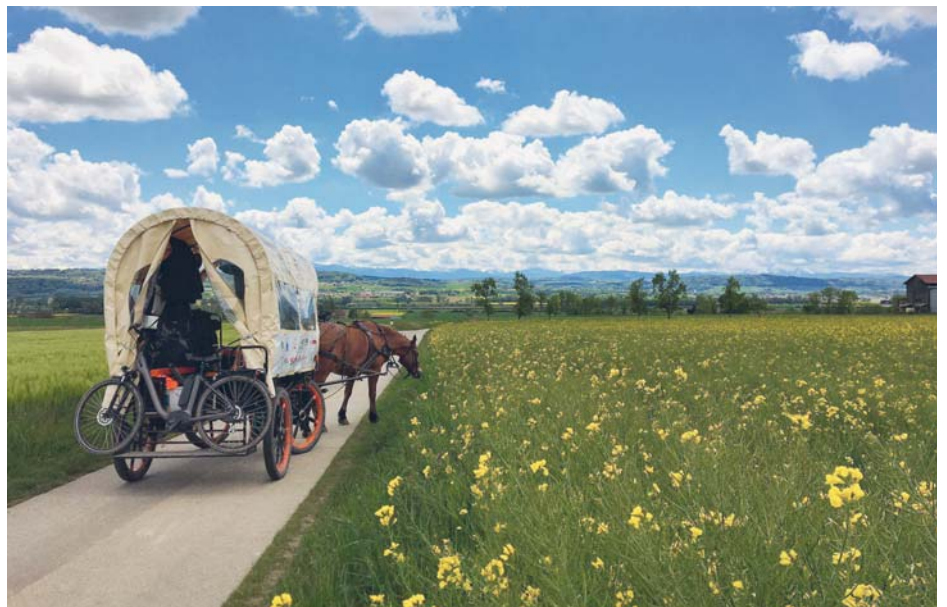
A travers les prairies d'Ajoie. / Durch die Wiesen von Ajoie.