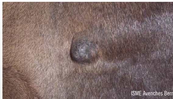
Beispiel eines nodulären Sarkoides / Exemple d'un sarcoïde nodulaire (ISME)

genetische Veranlagung einen wichtigen zusätzlichen Faktor bei der Entstehung des Equinen Sarkoides darstellt. Das ISME Bern-Avenches konnte zeigen, dass fast die Hälfte (48%) der bei 3-jährigen Freibergern vorhandenen Sarkoide im Alter von 5-7 Jahren spontan, das heisst ohne therapeutische Massnahmen, verschwunden sind, was auch ein Hinweis dafür ist, dass das Immunsystem des heranwachsenden Tieres und somit wahrscheinlich die genetische Prädisposition wichtige Faktoren bei der Entstehung von Sarkoiden sind.