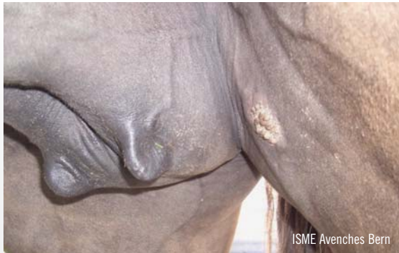
ISME Avenches Bern

Exemple d'un sarcoïde verruqueux / Beispiel eines verrukösen Sarkoides (ISME)