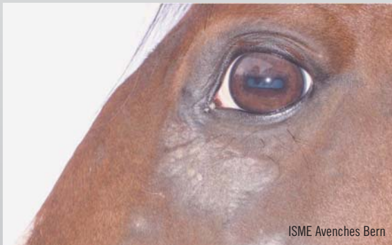
Exemple d'un sarcoïde occulte / Beispiel eines okkulten Sarkoides (ISME)

En règle générale, les animaux qui ont déjà eu un sarcoïde présentent un risque accru d'en développer d'autres. Cependant, les causes de cette maladie ne sont pas encore totalement élucidées. En plus de facteurs environnementaux, la génétique joue un rôle. Le papillomavirus bovin est un facteur externe important dans le développement des sarcoïdes. Il a été démontré expérimentalement que des injections de ce virus peuvent déclencher des tumeurs de type sarcoïde, qui disparaissent toutefois spontanément. Le virus n'est donc pas la seule cause, mais plutôt un important déclencheur de la maladie. Cette observation a renforcé l'hypothèse des chercheurs et chercheuses selon