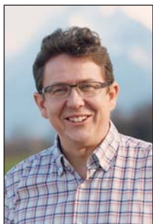
Albert Rösti Président Präsident