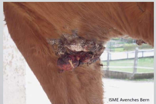
Beispiel eines fibroblastischen Sarkoides / Exemple d'un sarcoïde fibroblastique (ISME)

Grundsätzlich gilt, dass Tiere, die einmal ein Sarkoid entwickelt haben, ein erhöhtes Risiko für weitere Sarkoide tragen. Die Ursachen der Krankheit sind aber noch nicht vollständig geklärt. Neben Umweltfaktoren spielt die Genetik eine Rolle. Das Bovine Papillom Virus ("Rinderwarzen-Virus") stellt einen wichtigen äusseren Faktor bei der Entstehung des Sarkoides dar. Es konnte experimentell gezeigt werden, dass Injektionen dieses Virus Sarkoid-ähnliche Tumoren auslösen können, welche aber spontan wieder verschwinden. Das Virus ist also nicht die alleinige Ursache, sondern eher ein wichtiger Auslöser der Krankheit. Diese Beobachtung bestärkte die Forscher in der Annahme, dass das Immunsystem des individuellen Tieres und seine