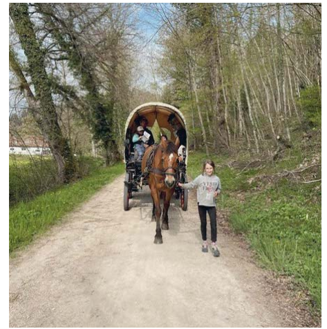
Un peu d'encouragement ! / Eine kleine Ermutigung!

Als leidenschaftliche Anhänger des lokalen Handels waren sie während drei Reisewochen nie in einem Coop oder einer Migros, das will etwas heissen! Als einziger kleiner Wermutstropfen bei diesem tollen Abenteuer herrschte im Mai ein ziemlich regnerisches und auch kühles Wetter während eines grossen Teils der Reise, was aber ihre Pläne nicht durchkreuzen konnte, im Gegenteil!