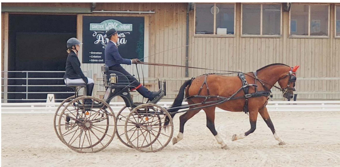
La jument Henjje (Never BW x Hâtif) gagnante de l'épreuve des 4-5 ans. / Die Stute Henjje (Never BW x Hâtif) Siegerin der Prüfung 4-5 Jahre.

Am Sonntag trafen sich die Konkurrenten und Konkurrentinnen unter einem grauen und manchmal drohenden Himmel zu den Promotionsprüfungen.