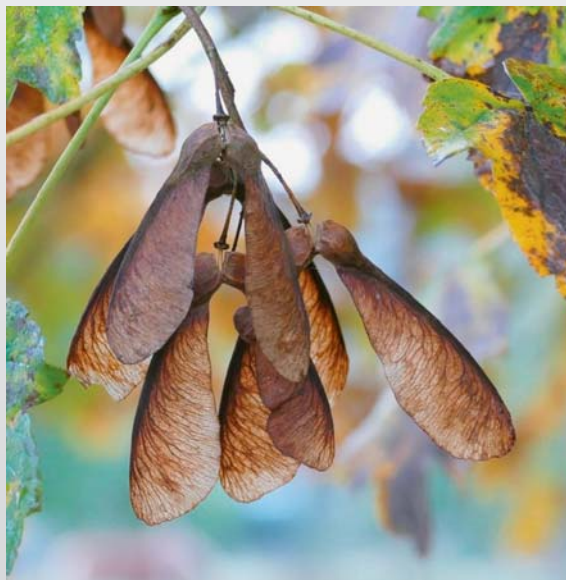
Die Samen des Bergahorns ( Acer pseudoplatanus ) treten paarweise auf und bilden einen spitzen Winkel, ein wenig wie „Reiterbeine“. Diese Art ist für Equiden giftig. Les samares de l'érable sycomore ( Acer pseudoplatanus ) sont portées par paire et forment un angle aigu comme des « jambes de cavalier ». Cette espèce est toxique pour les équidés.

Alexandra Minder Beratungsstelle Pferd Agroscope, Schweizer Nationalgestüt, SNG