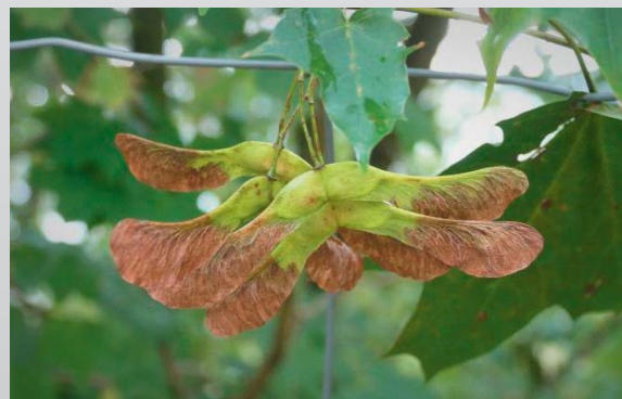
Die Samen des Spitzahorns ( Acer platanoides ) bilden einen weniger spitzen Winkel als die Samen des Bergahorns. Diese Art ist für Equiden nicht giftig. Les samares de l'érable plane ( Acer platanoides ) forment un angle moins aigu que les samares de l'érable sycomore. Cette espèce n'est pas toxique pour les équidés. (D-M. Votion)

Mehrere klinische Symptome müssen zusammenkommen, um die Erkrankung diagnostizieren zu können, aber keines davon tritt ausschliesslich im Rahmen der atypischen Weidemyopathie auf. Die unter einer durch HGA verursachten Vergiftung leidenden Pferde zeigen häufig Anzeichen für körperliche Schwäche und Muskelsteifheit, können zudem zittern oder eine von der Norm abweichende Atmung aufweisen. Aufgrund des Muskelzerfalls kann sich das Pferd zudem hinlegen und sich extrem müde zeigen. Weiterhin wird der Urin sehr dunkel, da er das durch die Verschlechterung des Muskelgewebes freigesetzte Myoglobin enthält. Die Schleimhäute um die Augen und am Kiefer können eine dunkelrote Färbung annehmen. Trotz dieser