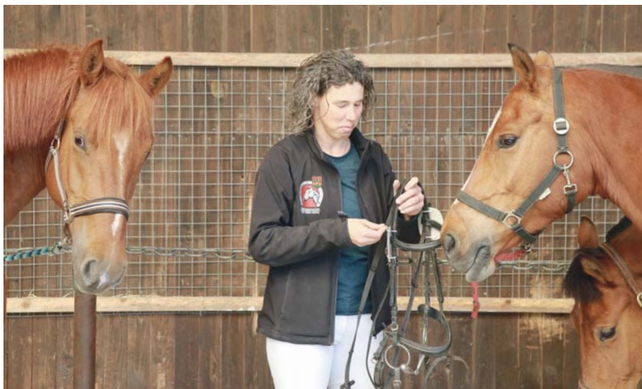
Des franchises-montagnes de différentes lignées, couleur de robe, âge ou de possibilité d'emploi sont disponibles à la vente. Verkäufliche Freiberger verschiedener Abstammung, Farbe, Alter oder Einsatzmöglichkeit stehen jeweils zum Verkauf.