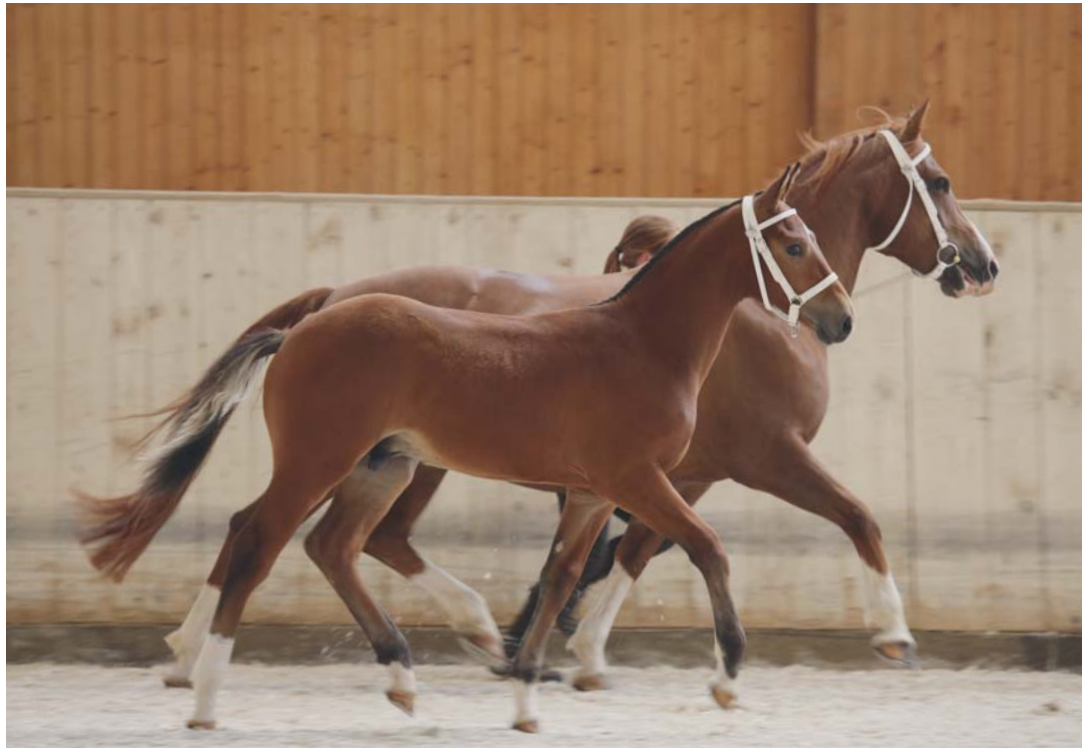
Valegro vom Bergli (Vartan) au rappel du concours des poulains de Härkingen en 2019. Valegro vom Bergli (Vartan) im Rappel an der Schau in Härkingen 2019.