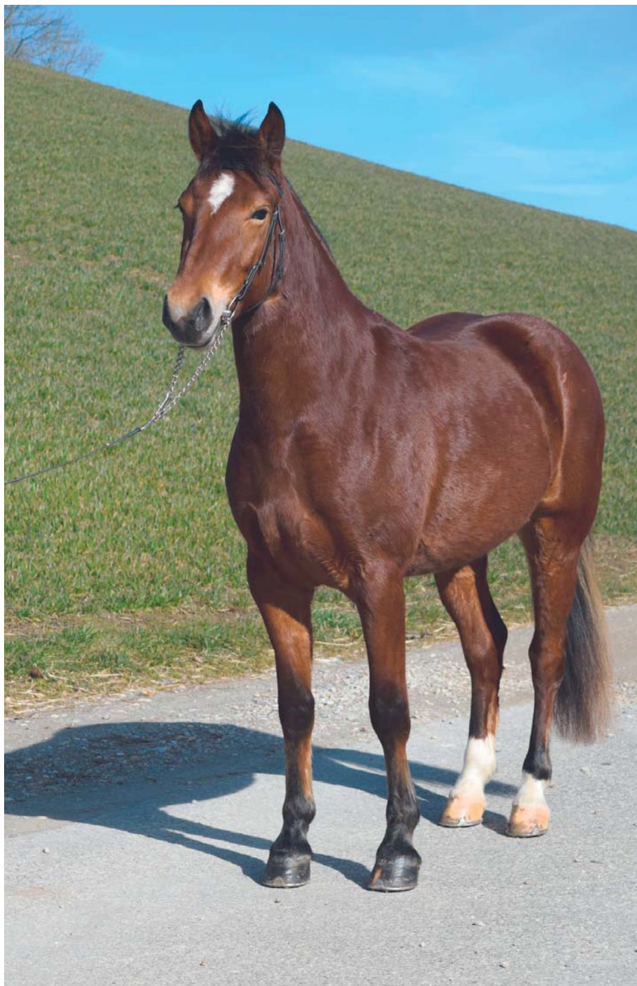
Exemple d'une jument franches-montagnes de trois ans à vendre, descendante de Hamlet des ronds prés. Beispiel einer verkäuflichen dreijährigen Freibergerstute, abstammend von Hamlet des ronds prés.

Le but de cette manifestation est de présenter sur place aux potentiels acheteurs une palette aussi large que possible de chevaux franches-montagnes à vendre. Ceux-ci peuvent être essayé en selle ou en attelage, avec le consentement du vendeur. Les chevaux peuvent donc être observés, comparés et testés en prenant son temps. Depuis 2015, l'expo-vente dispose d'une offre supplémentaire, à savoir un site web sur lequel les profils des chevaux à vendre peuvent être consultés pendant une année. Cette année, malheureusement, cette expo-vente traditionnelle a dû être annulée en raison de l'interdiction relative aux manifestations décidée par le Conseil fédéral dans le cadre