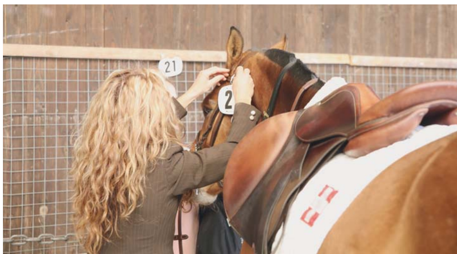
Un franchises-montagnes est préparé pour un essai en selle. / Ein Freiberger wird für das Probereiten gesattelt.