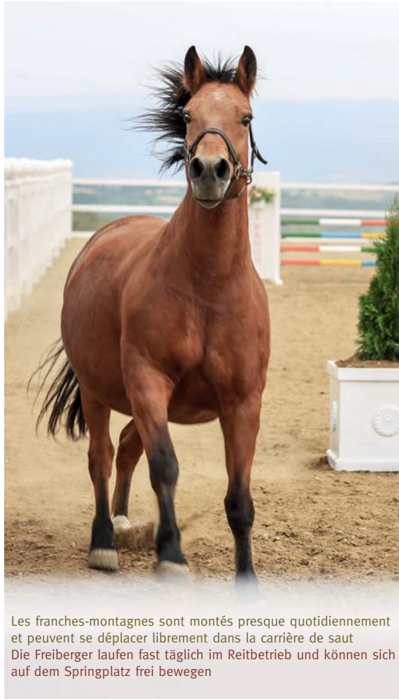
Les franches-montagnes sont montés presque quotidiennement et peuvent se déplacer librement dans la carrière de saut Die Freiberger laufen fast täglich im Reitbetrieb und können sich auf dem Springplatz frei bewegen