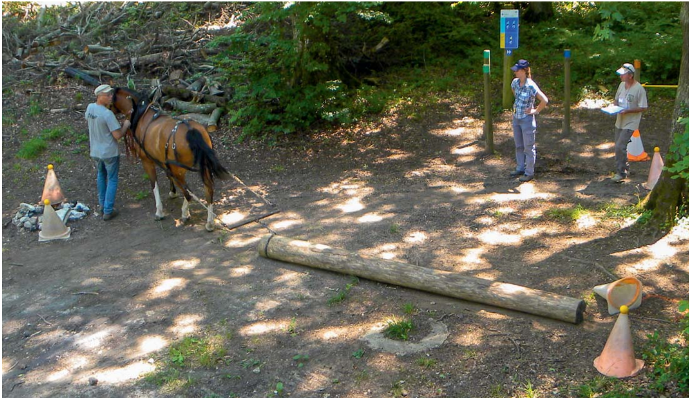
Depuis la butte, les spectateurs ont eu une très bonne vue des participants au débardage. Ici Pierre Aufranc Vom Hügel aus hatten die Zuschauer eine sehr gute Sicht auf die Teilnehmer des Rückewettbewerbs. Hier Pierre Aufranc

Le dimanche 18 juin, après un samedi consacré aux épreuves de dressage et au Championnat Neuchâtelois, le paddock était à la disposition des chevaux franches-montagnes.