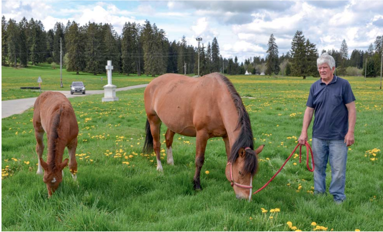
directeur du Parc du Doubs. Maeder, Direktor des Doubs Parks.