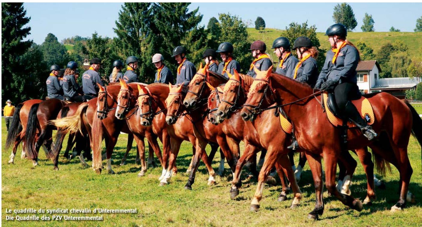
Le quadrille du syndicat chevalin d'Unterehmental Die Quadrille des PZV Unterehmental