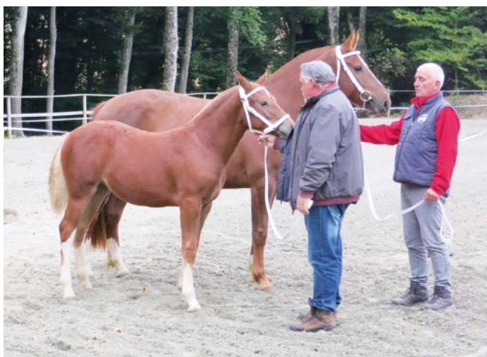
La grande gagnante du concours des poulains avec les notes 8-7-7, Bahia A.P, Cookie/Novartis Mit den Noten 8-7-7 die Siegerin des Concours der Fohlen, Bahia A.P., Cookies/Novartis