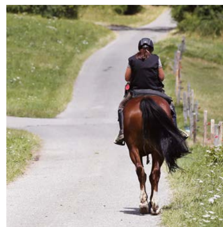
Le franches-montagnes révèle des aptitudes particulières pour cette discipline, étant donné sa robustesse et son rapport étroit avec la nature. Dank seiner Robustheit und seiner Naturverbundenheit eignet sich der Freiburger besonders für diese Disziplin.

Niveau ist, desto weniger kann man eine schlechte Leistung in einer anderen Disziplin wettmachen. «Der Orientierungsritt ist häufig auch für das Endergebnis entscheidend», bekräftigt die Meisterin aus Dompierre.