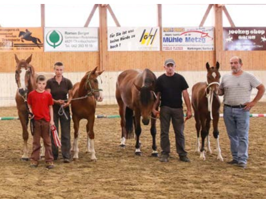
Schauplatz Härkingen, die Ränge 1 bis 4 von rechts nach links