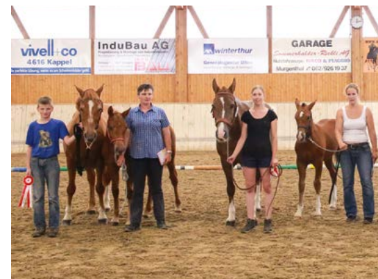
Place de concours de Härkingen, classement 1 à 4 de droite à gauche