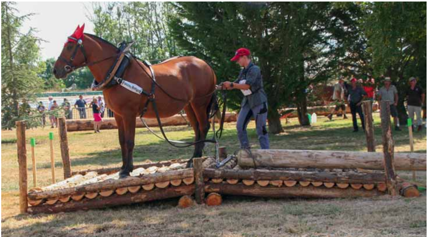
Une partie de l'épreuve de débardage était à faire uniquement avec la voix In der Rückprüfung durften die Anweisungen in einem Abschnitt nur mit der Stimme gegeben werden