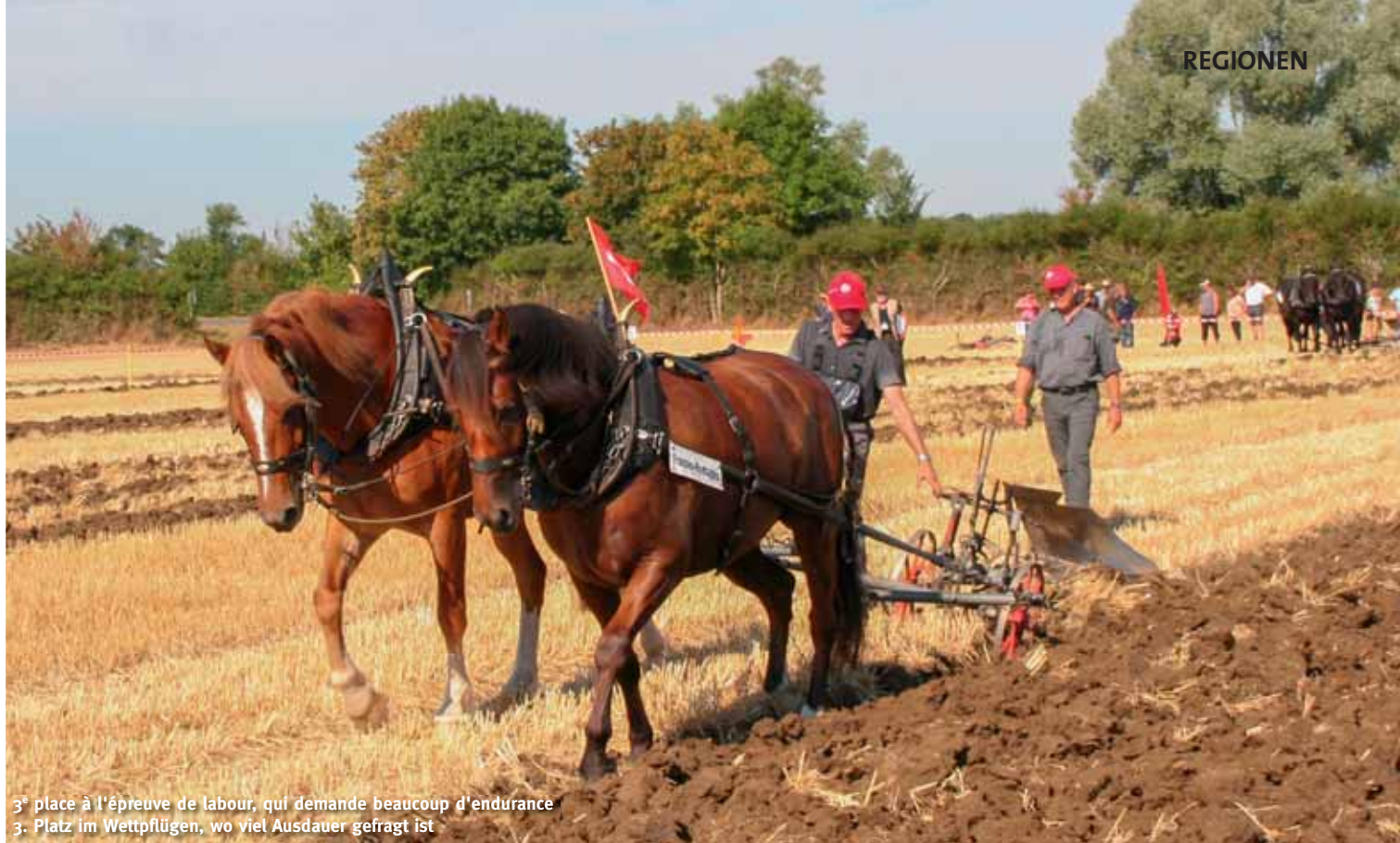
3 e place à l'épreuve de labour, qui demande beaucoup d'endurance 3. Platz im Wettpflügen, wo viel Ausdauer gefragt ist