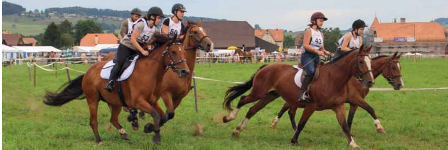
Beau galop lors de la course pour Franches-Montagnes et Haflinger Schöner Galopp während des Freiburger- und Haflinger Rennens