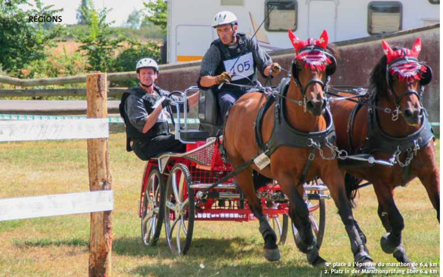
2 e place à l'épreuve du marathon de 6,4 km 2. Platz in der Marathonprüfung über 6,4 km