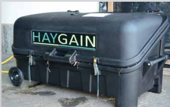
Fig. 1: Appareil de traitement à la vapeur utilisé pour cette étude

Le traitement à la vapeur n'a eu quant à lui qu'un léger impact sur les nutriments. Dans le foin rincé à l'eau, au contraire, plus le traitement était long, plus la teneur en sucres a diminué. Cette diminution est à mettre sur le compte de l'effet de lessivage, mais aussi de l'activité des levures, qui ont décomposé une partie des sucres.