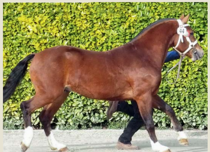
12. Calisto (Cardinal - Hendrix - Clémenceau)