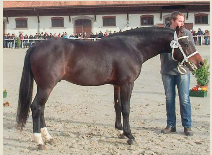
8. Laos (Libero - Excell - Hobby)