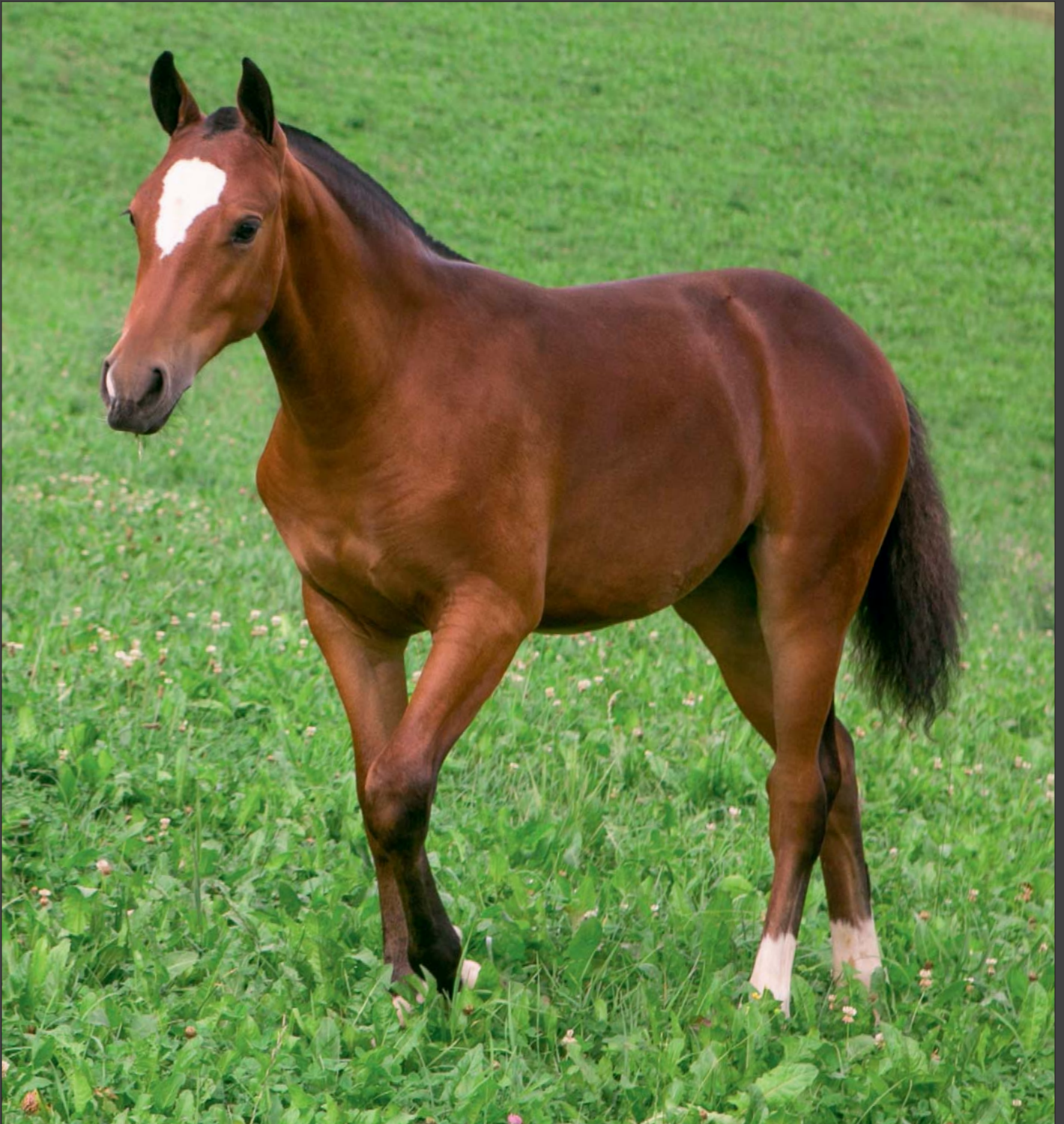
Dolce Vita de Sagnarbot par Noctambus et Delilah par Emilio, née en 2015 et propriété de Myriam Chapatte Dolce Vita de Sagnarbot, Abstammung Noctambus und Delilah, Abstammung Emilio, geboren im 2015, Besitzerin Myriam Chapatte