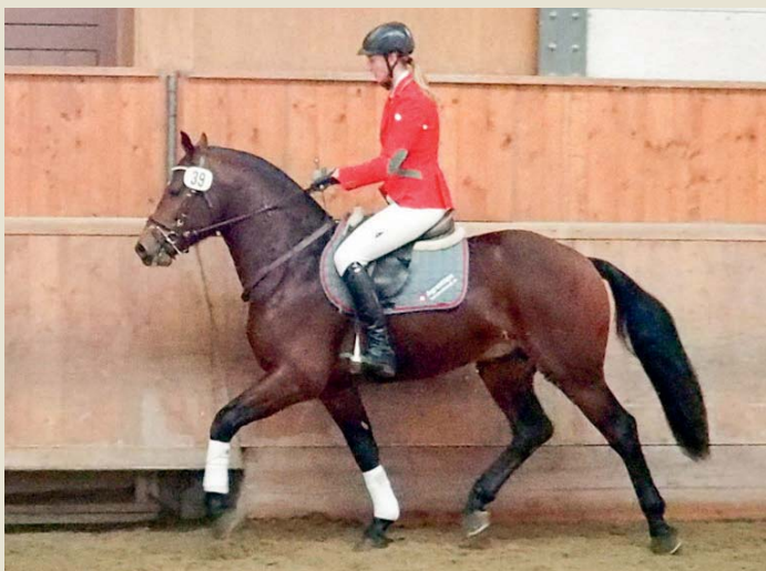
11. Capricchio vom Sagenhof (Casim - Neckar - Hendrix)