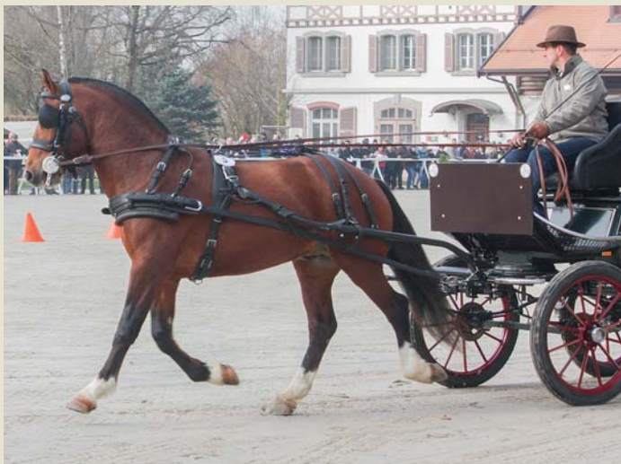
9. Napero (Noble Coeur - Crepuscule - Havel)