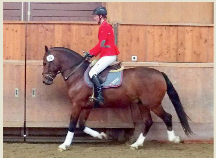
10. Querido MR (Quendal - Ricinus - Livius)