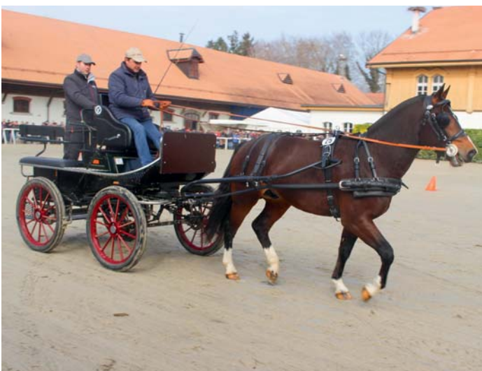
3. Navarino (Niro - Elysee II - Hollywood)