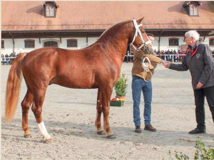
7. Closer (Coventry - Harquis - Estafette)