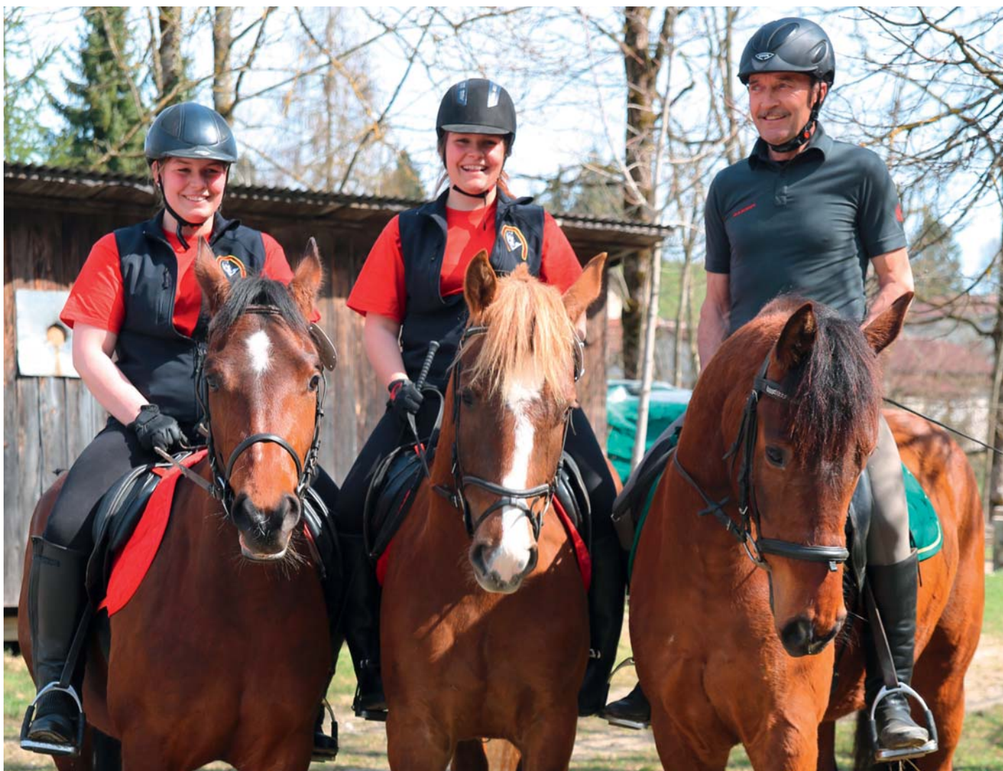
Le prochain trio se prépare pour l'épreuve d'équitation / Das nächste Trio macht sich bereit für die Prüfung im Reiten