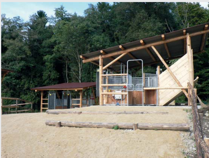
Distributeur automatique de fourrage permettant un affouragement individualisé Computergesteuerte Abruffütterung für eine individuell abgestimmte Zuteilung der Futterrationen

Der Trend zur Gruppenhaltung von Pferden hält seit geraumer Zeit an. Diese Haltungsform entspricht einerseits dem Wunsch vieler Pferdebesitzer, ihren Tieren ein naturnahes Leben zu gewähren. Andererseits verweist eine vor kurzem von Agroscope publizierte Analyse verschiedener Betriebstypen auf eine höhere Wirtschaftlichkeit der Gruppen- im Vergleich zur Boxenhaltung.