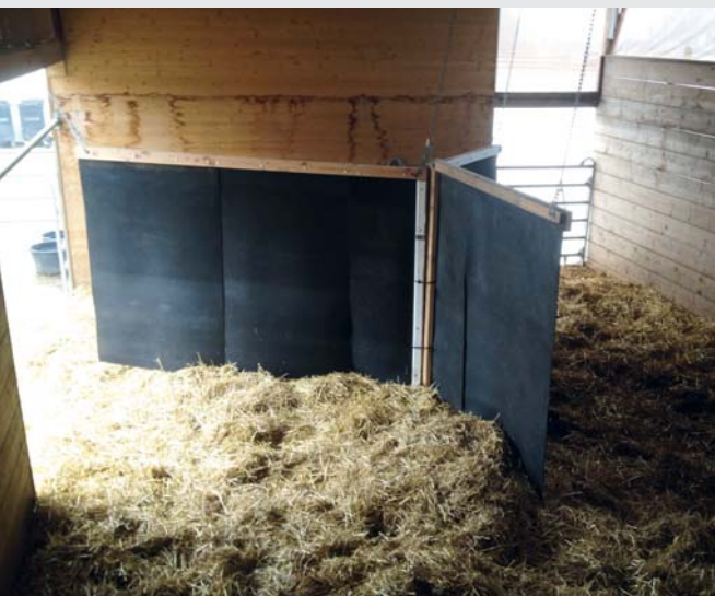
Structurer l'aire de repos pourrait aider les chevaux de rang hiérarchique inférieur à se reposer sans être dérangés Eine Strukturierung des Liegebereichs könnte tiefrangigen Pferden helfen, sich sicherer zu fühlen

Les défis à relever pour une garde de chevaux moderne résident principalement dans la gestion de l'affouragement, la conception des écuries et la gestion de la détention en groupe. Or, les propositions de solution n'auront d'avenir et un large impact que si les différents intérêts sont pris en compte dans un seul et même concept, applicable dans l'ensemble de la pratique et supportable financièrement. Il s'agit de tenir compte des besoins des chevaux, mais aussi des exigences des propriétaires/détenteurs-trices de chevaux. Telle est justement la mission de la recherche appliquée dans le domaine de la garde de chevaux: aborder les nouvelles problématiques et élaborer des réponses à l'intention de la pratique.