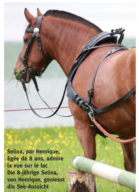
Selina, par Henrique, âgée de 8 ans, admire la vue sur le lac Die 8-jährige Selina, von Henrique, genießt die See-Aussicht

Bien qu'il ait encore plu des seilles le matin, le sol est resté impeccable et a permis aux cavaliers d'effectuer d'excellents parcours sur le terrain de saut. Avec une superbe vue sur le lac en toile de fond, on a pu assister aux parcours passionnants des franchises-montagnes qui se mesuraient dans trois catégories entre 70 et 90 cm et à la distribution des plaques d'écurie et des flots aux vainqueurs. Le dimanche également, les épreuves étaient richement dotées et les premiers classés recevaient des prix en nature en plus de la gerbe de fleurs. Dans les épreuves de débardage, tous les participants non classés