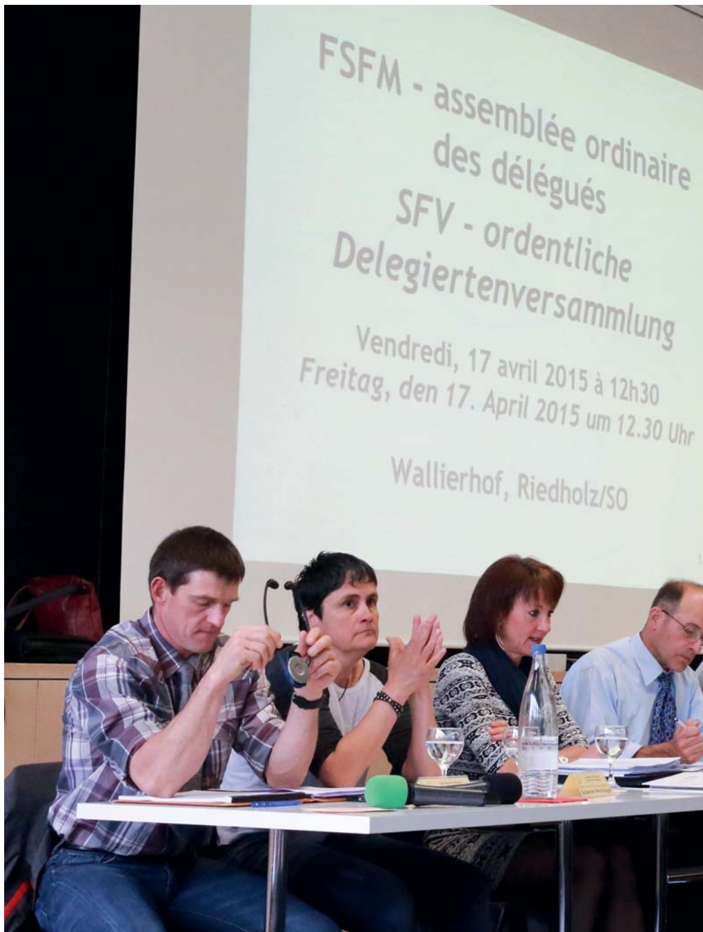
Le comité est prêt pour l'assemblée des délégués du 17 avril Der Vorstand ist bereit für die ordentliche Delegiertenversammlung am 17. April