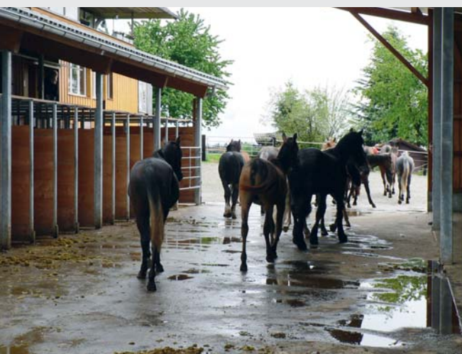
Une subdivision intelligente de l'espace contribue à diminuer les conflits sociaux entre les chevaux Die klare Trennung der einzelnen Funktionsbereiche hilft mit, Auseinandersetzungen zu vermeiden

Die Herausforderungen für eine zeitgemässe Pferdehaltung liegen vor allem im Fütterungsmanagement und in der baulichen Gestaltung und des Managements von Gruppenanlagen. Entsprechende Lösungsvorschläge haben nur dann eine Breitenwirkung und Zukunft, wenn die verschiedenen Interessen in ein und demselben praxistauglichen und finanziell tragbaren Konzept berücksichtigt werden. Es gilt, den Ansprüchen der Pferde, aber auch denjenigen der Pferdehaltenden gerecht zu werden. Die angewandte Forschung im Bereich Pferdehaltung hilft mit, neu auftauchende Fragen zu bearbeiten und Antworten für die Praxis zu erarbeiten.