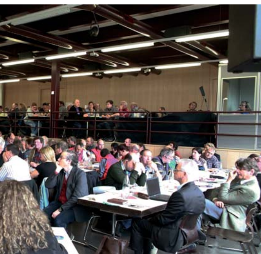
L'assemblée des délégués s'est tenue dans l'école d'agriculture du canton de Soleure, à Wallierdorf Die Delegierterversammlung fand in der Landwirtschaftlichen Schule des Kantons Solothurn – Wallierdorf – statt