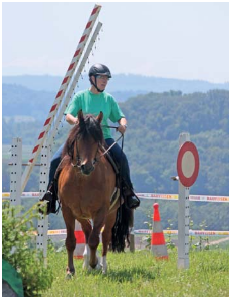
Le gymkhana à travers les éléments de chantier Durch die Baustelle führte der Weg im Gymkhana