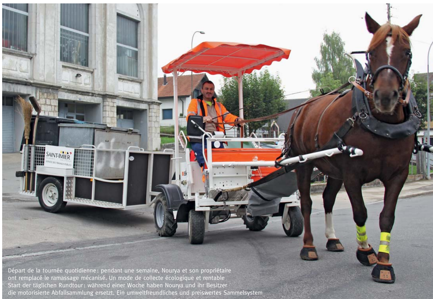
Départ de la tournée quotidienne: pendant une semaine, Nourya et son propriétaire ont remplacé le ramassage mécanisé. Un mode de collecte écologique et rentable Start der täglichen Rundtour: während einer Woche haben Nourya und ihr Besitzer die motorisierte Abfallsammlung ersetzt. Ein umweltfreundliches und preiswertes Sammelsystem

Andere jurassische Gemeinden wie Delémont und La Neuveville könnten die Rückkehr des Pferdes in die Stadt erproben. Henri Spychiger hofft, dass der Jura dieses Konzept weiterentwickelt, welches Pferd und Technologie vereint, denn dieses Vorhaben trägt zum Erhalt des Freibergers bei, er ist der wahre Star bei dieser aussergewöhnlichen Abfallsammlung und ausserdem wird das Bild einer Region vermittelt, die sich durch ihre technologischen Neuerungen auszeichnet. Auch die genferische Gemeinde Versoix hat ihr Interesse gezeigt. Erstaunlicherweise liegt für eine Ausweitung dieses Projektes auf andere Gemeinden eine grosse Schwierigkeit darin, Züchter zu finden, die sich für diese Tätigkeit engagieren wollen. Aufruf an alle Interessierten. (veg)