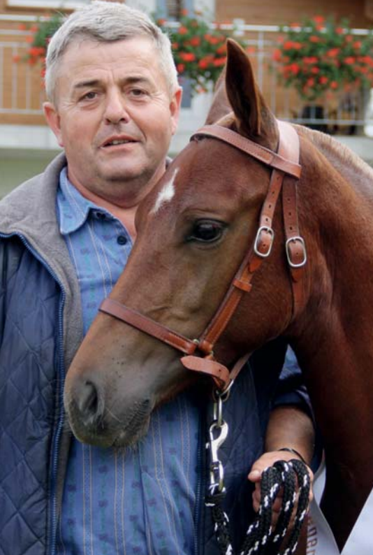
La pouliche gagnante Fay (Don Caprio) des frères Sommer, de Zollbrück Siegerfohlen Fay (Don Caprio) der Gebrüder Sommer aus Zollbrück