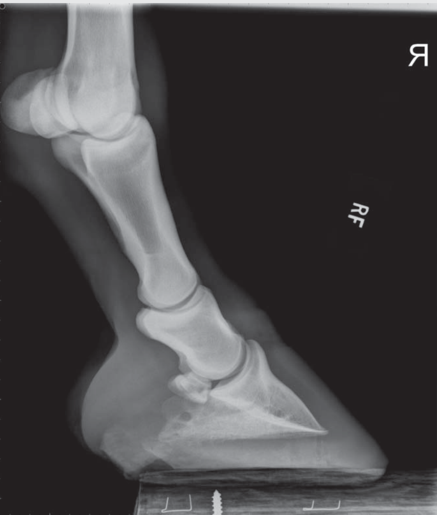
Radiographie d'un membre sain Röntgenaufnahme einer gesunden Gliedmasse

complètement et reflète le « tissu cicatriciel » qui a remplacé le tendon à l'origine en bonne santé. Au niveau biomécanique, ce « tissu cicatriciel » est bien inférieur au tissu tendineux sain. Le diagnostic d'une blessure au tendon est posé par examen aux ultrasons. Les tendons ne guérissent que très lentement car ils ont très peu de circulation sanguine. Lors de lésion aiguë au tendon (env. les 10 premiers jours après la blessure), on administre des anti-inflammatoires et on refroidit la jambe touchée, resp. on la masse avec un jet d'eau dense. Après ce stade initial, durant lequel le cheval doit être gardé strictement au box et n'être bougé qu'un peu au pas, ou durant lequel on bouge passivement le membre, le programme de remise en forme commence, durant lequel le cheval est bougé lentement durant 5 à 9 mois pour se remettre en forme et toujours sous contrôle. Comme