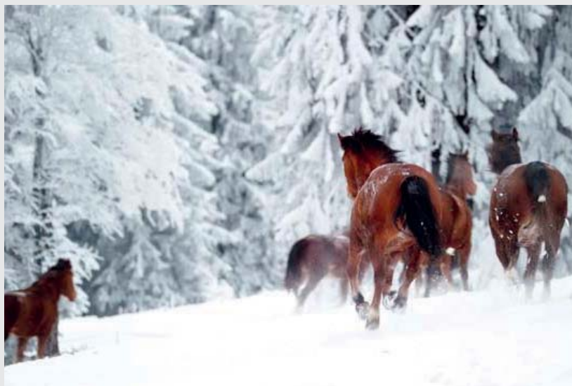
Les sorties en groupes contribuent justement en hiver au bien-être et à un bon système immunitaire. Auslauf in der Gruppe trägt gerade im Winter zum Wohlbefinden und zu einem guten Immunsystem bei.