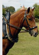
Couverture / Frontblatt Heimo (Halliday/Livius) Urs Duss, Doppelschwand

Etranger Ausland Raiffeisenbank Much-Ruppichteroth BLZ 37069524 – Deutschland Compte/Konto 5540011 Pour la France, envoyer votre chèque à: FSFM CP 190, Les Longs Prés 1580 Avenches