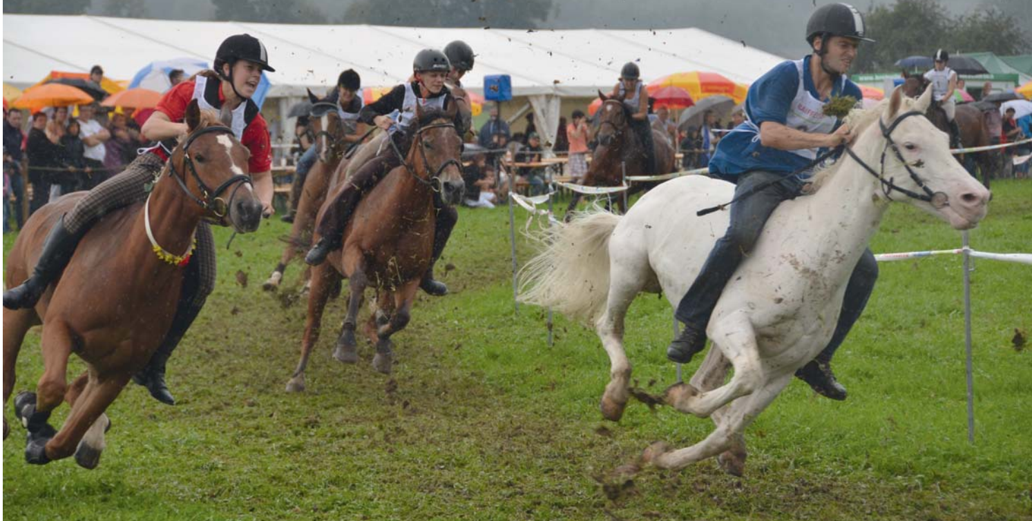
Ils ont tout donné malgré la pluie : cheval et cavalier à cru dans la course campagnarde. Trotz Regen alles gegeben : Pferd und Reiter am Bauernrennen ohne Sattel.