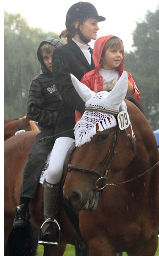
La pluie du dimanche n'a pas gâché le plaisir des familles.

Trotz den schlechten Wetter, viel Spass für die ganze Familie.