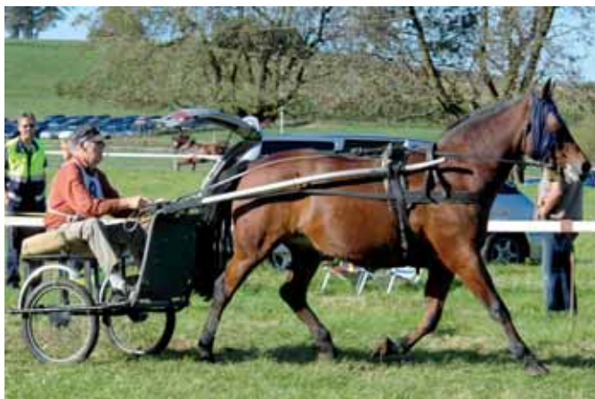
Une victoire de plus pour Roger Pillonel, de Billens, avec Havane. Ein weiterer Sieg für Roger Pillonel (Billens) und Havane.

Les paroxysmes se sont succédés les uns aux autres sur le champ de courses de Schwarzenburg à l'occasion des courses campagnardes. Les ingrédients de cette réussite sont à chercher parmi la multitude de races de chevaux, les cavaliers et meneurs réunissant jeunes et vieux sans distinction d'âge, une organisation des courses parfaite, des conditions de terrain idéales, une cantine fonctionnant à merveille et un public enjoué. Cerise sur le gâteau, le spectacle de cette fête équestre s'est déroulé sans accident majeur, comme s'est plu à le relever un samaritain en bord de piste. En outre, il a constaté avec une grande satisfaction que le niveau de maîtrise des cavaliers et des meneurs s'était sensiblement amélioré ces dernières années, tout comme la qualité du matériel d'attelage, ce qui amène un plus en matière de sécurité des courses.