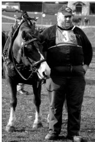
Placides, le meneur et sa bête attendent le départ. Gelassen wartet die Führperson mit ihrem Pferd auf den Start.