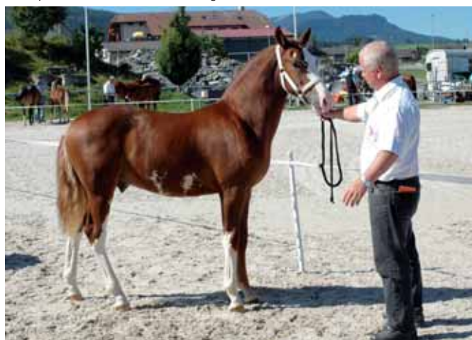
Vainqueur du matin à Planfayon: Harri (Harquis, Calgary, Lorrain) Vormittagsieger in Plaffeien: Harri (Harquis/Calgary/Lorrain)