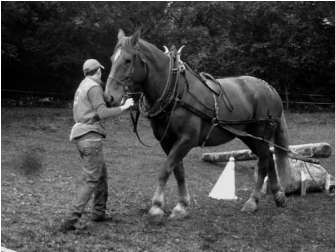
Le parcours de débardage attire aussi les attelers de compétition Zur Rückprüfung traten auch Fahrsportler

Les Journées amicales du syndicat d'élevage chevalin du Plateau de Diesse et environs se sont tenues le week-end du 10 octobre. Cette réunion placée, sous le signe du cheval et de l'amitié, au domaine de la Praye à Lignières rencontre un franc succès depuis une dizaine d'années.