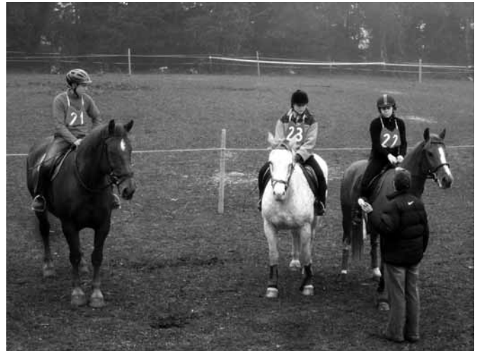
Une grande place est réservée à la jeunesse Für die Jugend war ein grosser Platz reserviert

Am Wochenende des 10. Oktobers fand das Freundschaftstreffen der Pferdezuchtgenossenschaft des Plateau de Diesse und Umgebung statt. Seit rund zehn Jahren erfreut sich dieses Treffen im Zeichen des Pferdes und der Freundschaft auf der Domaine de la Praye in Lignières einer grossen Beliebtheit.