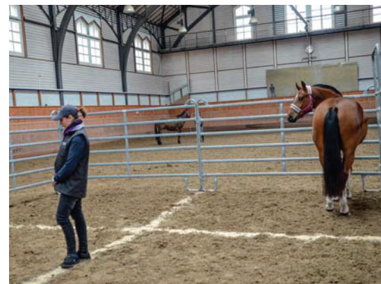
Die Reaktion auf einen unbekanntem Menschen ist einer der Tests, die für das Programm e-FM vorgeschlagen wurden. Le test de réaction à une personne inconnue est un des tests de personnalité qui sera proposé dans le programme e-FM.

Der Freiberger zeichnet sich durch seinen hervorragenden Charakter und seine Vielseitigkeit aus. Dieser goldene Charakter, das Ergebnis einer strengen Selektion, ist heute der Wettbewerbsvorteil der FM gegenüber