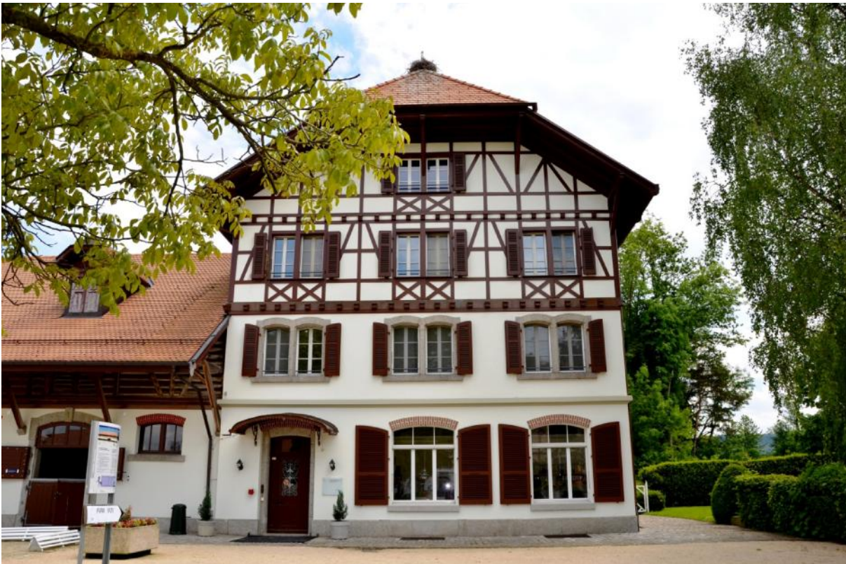
Gebäude mit den Büros der SFV Geschäftsstelle in Avenches (Erdgeschoss und 1. Etage)